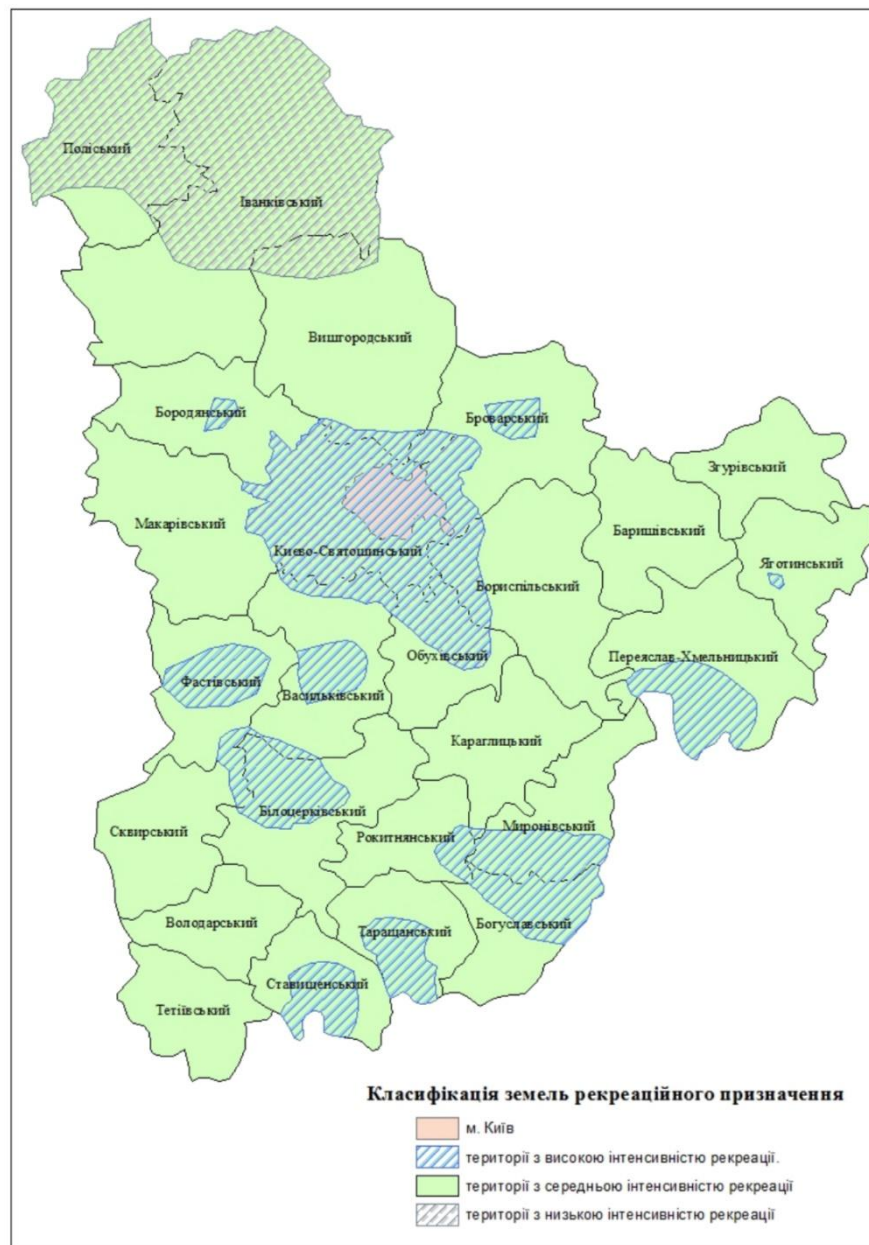
Мал. 2.2. Районування рекреаційного землекористування Київської області