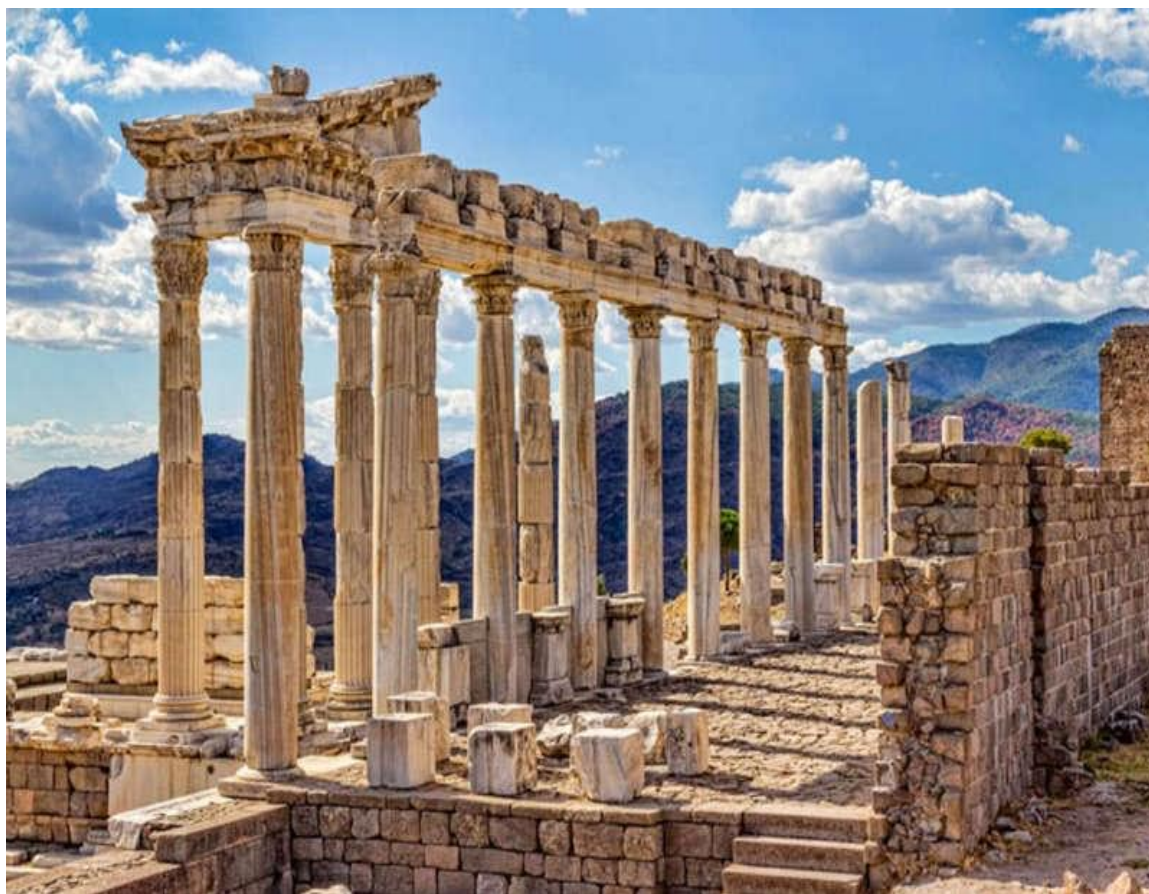
Рис. 2.4. Руїни Трої

численних будинків, храм, театр і величезного дерев'яного коня, побудованого в наші дні[3].