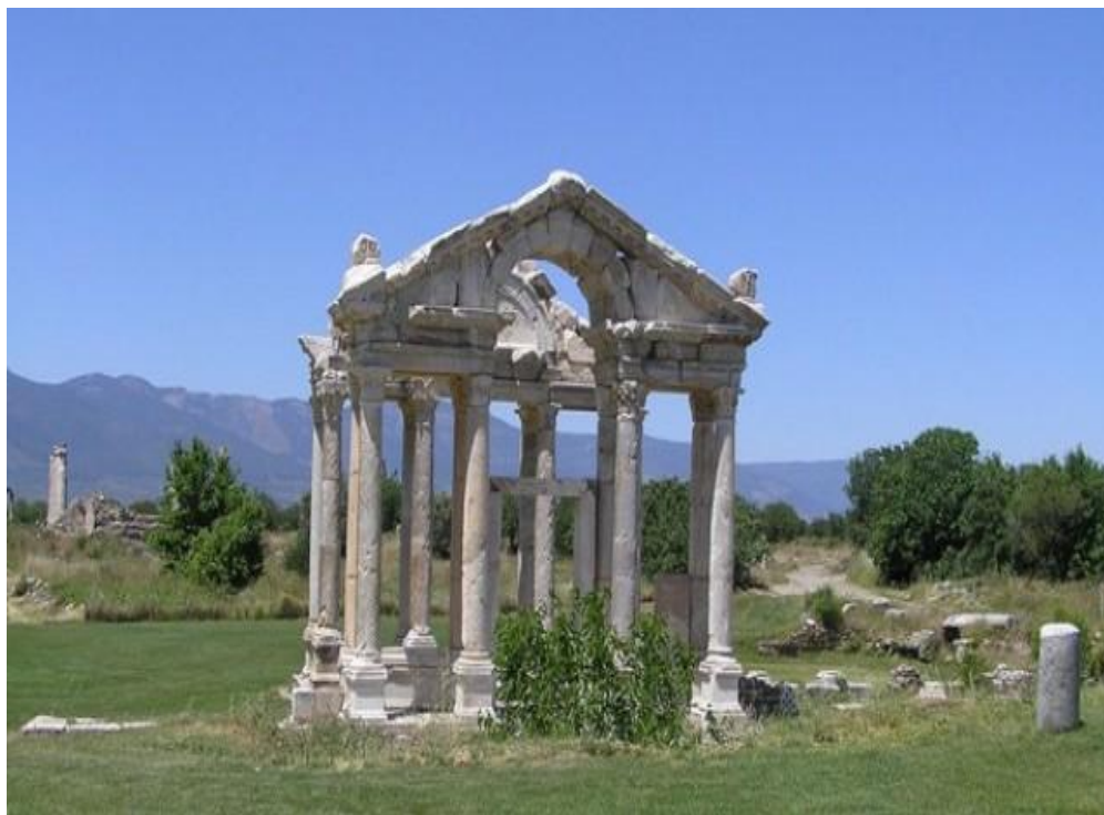
Рис. 2.8. Храм Афродіти.

Сельчук – поселення, що виникло на місці античного Ефесу, знаменитого своїм храмом Артеміди. Після завоювання сельджуками в XI ст. місто одержало назву – Сельчук. На пагорбі Айясолук поруч з головною вулицею Сельчука знаходяться руїни візантійської фортеці. У цитаделі імператор Юстиніан у VI ст. н.е. наказав збудувати базиліку св. Іоанна, цілком облицьовану зсередини мармуром. Нижче цитаделі розташована мечеть Ісібєя, збудована в 1375 р., у дворі якої встановлені колони з античного Ефеса. Вхідний портал, над яким піднімається мінарет, прикрашений сталактитовим декором і орнаментом у вигляді переплетених стрічок із чорного і білого мармуру. Від всесвітньо відомого храму Артеміди (рис. 2.9), одного із семи чудес світу, збереглася лише одна відновлена колона. Перший храм був споруджений у VI ст. до н.е.