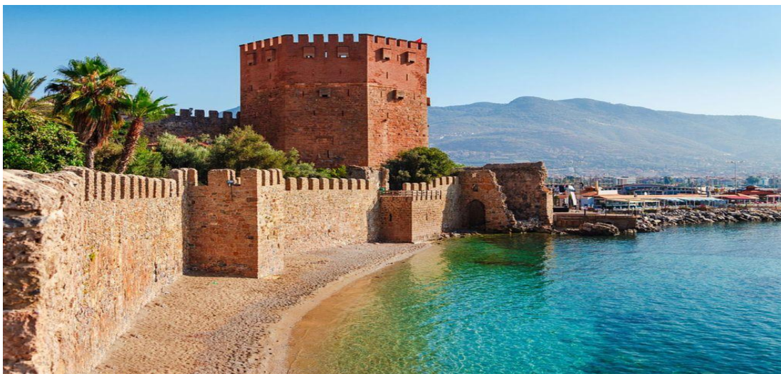
Рис. 2.6. Червона вежа

Сіде, оточений сучасними туристичними комплексами, є одним з із найрозвинутіших курортів півдня Туреччини. Грецькі колоністи вперше оселилися тут у VII ст. до н.е. Місто стало розвинутим торговим портом, яке зобов'язане своїм процвітанням піратству і работоргівлі. Незважаючи на ряд землетрусів, у Сіде збереглися багато історичних пам'яток: статуя імператора Віспасіана, храм Фортуни, Агори, амфітеатр на 16 000 місць. (рис.2.7)