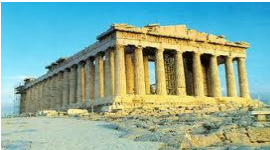
Рис. 2.9. Храм Артеміди

Перше поселення на місці сучасного Мармариса було засновано в IV ст. до н.е. і називалося Фіскос, у північній частині міста, де розташовувалося це поселення, проводять археологічні розкопки. Мармарис відомий масовими заходами: на початку травня проводиться відомий міжнародний вітрильний фестиваль, у червні – фестиваль музики і кіно й естради. Найпопулярніше серед туристів Старе місто з вузькими грецькими вуличками і гучним базаром, центр Старого міста – османська фортеця Мармара-калесі, збудована за розпорядження Сулеймана Чудового[17].