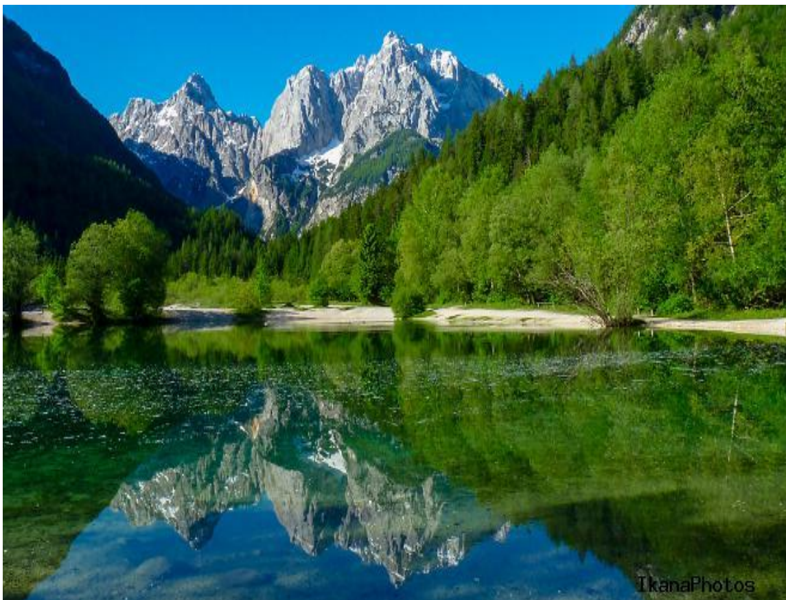
Рис. 2.1. Національний парк Олімпос – Бейдаглари

Національний парк лежить в 3 км на північний схід від Учхисар (Каппадокія) і являє собою справжній музей під відкритим небом площею близько 300 кв. км. На території парку виявлено безліч скельних монастирських комплексів і печерних поселень, 6 церков, більше двох десятків стародавніх селищ «звичайного» типу і музейний комплекс. Вся територія Гйореме разом з прилеглими районами долини Горгундере включена до Списку Всесвітньої спадщини ЮНЕСКО.