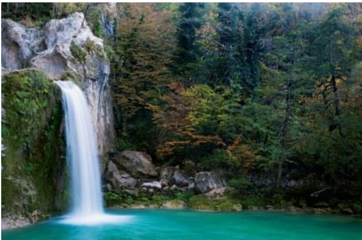
Рис. 2.2. Національний парк каньйону Кеprüлю

курортної зони Анталії, в літній період ці красиві місця буквально затоплені туристами[43].