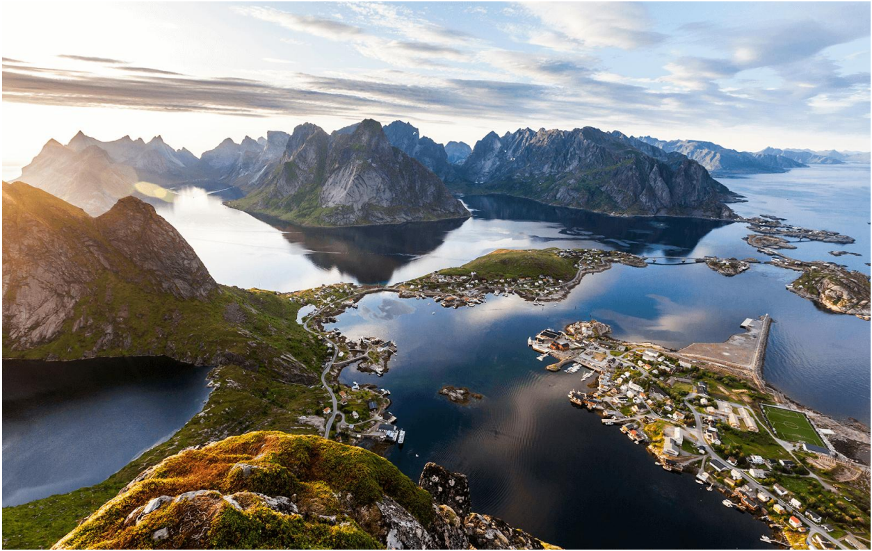
Рис.3 (Лофотерські острови)