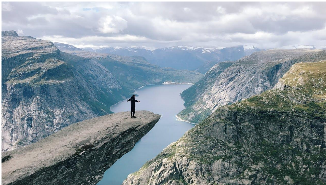
Рис.5 (Язык Троля)