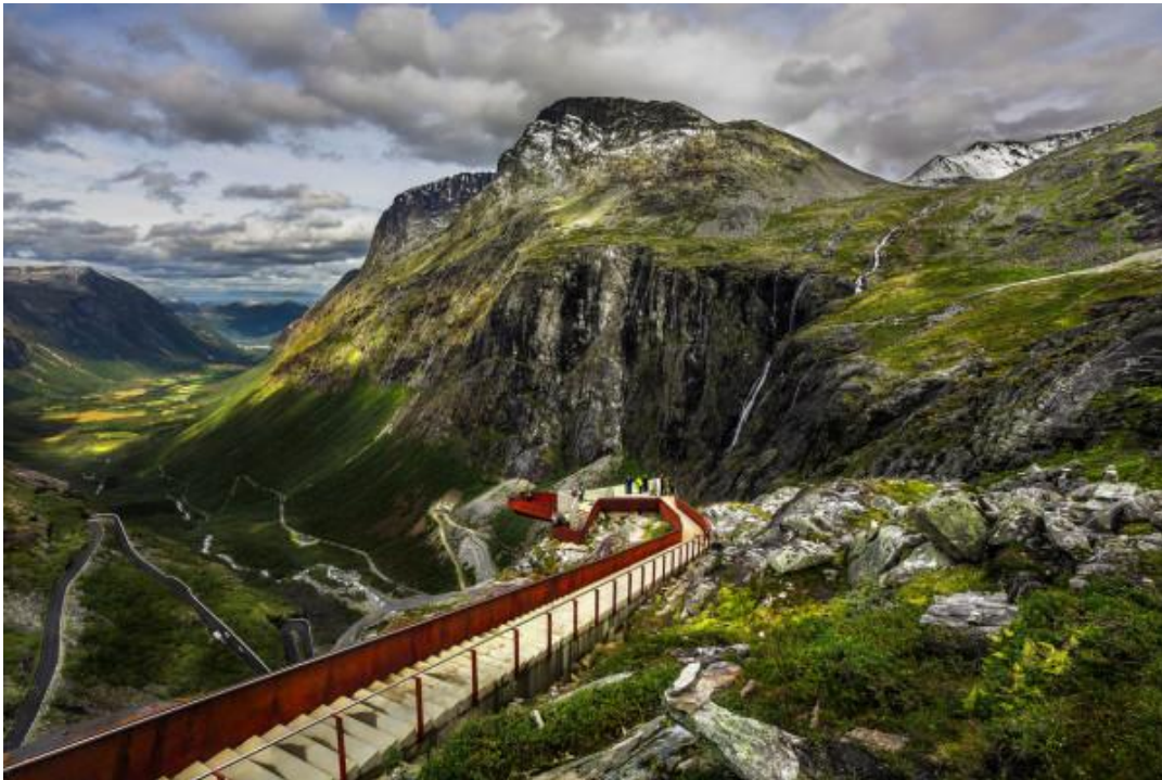
Рис. 4 (Стіна Тролів)