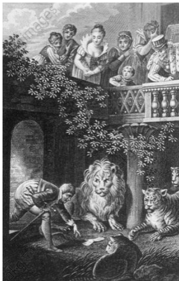
Abb. 2. Zur Übung 8

Aufgabe: Beschreiben Sie das unten stehende Bild mithilfe des Gedichtes (Abb. 2).