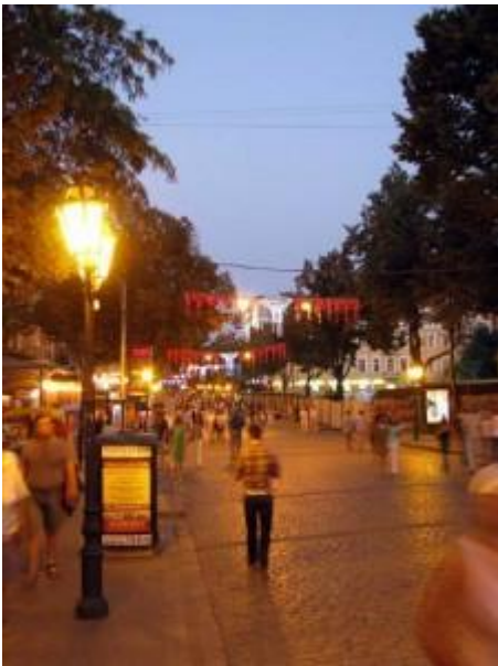
Дерибасовская улица в Одессе