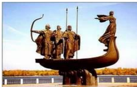
Памятник основателям Киева (скульптор Василий Бородай)