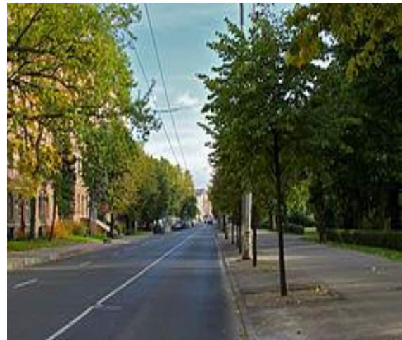
Бульвар Райниса в Риге