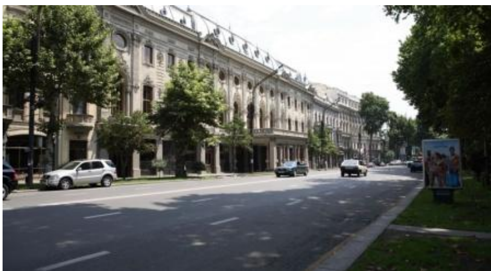
Проспект Шота Руставели в Тбилиси