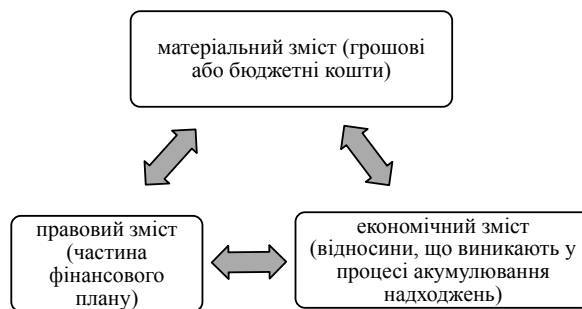
Рис. 1. Підходи до визначення поняття доходів бюджету

мірне явище, а саме як економічну, правову та матеріальну категорію (рис. 1).