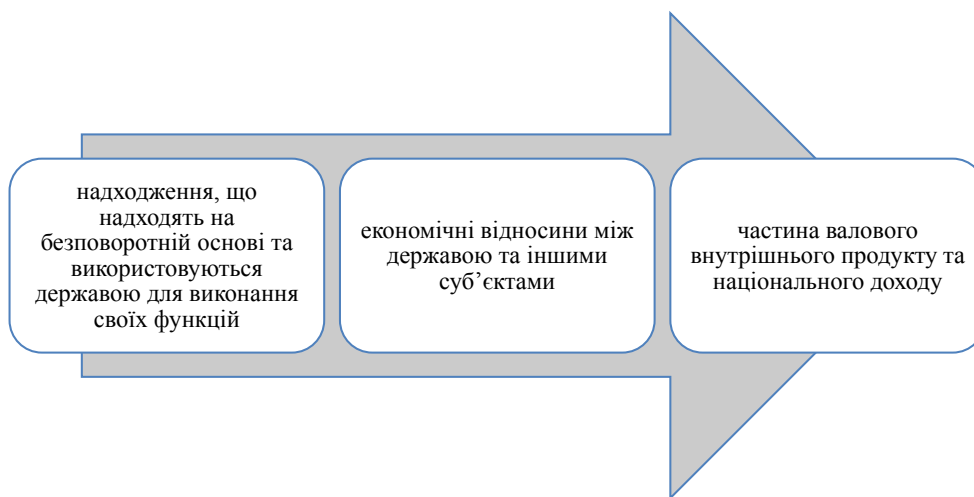
Рис. 2. Напрями щодо визначення поняття «доходи бюджету»

Традиції бюджетування державних доходів у нашій країні мають тривалу історію. Різними науковцями надаються визначення цього поняття з певними особливостями (табл. 1)