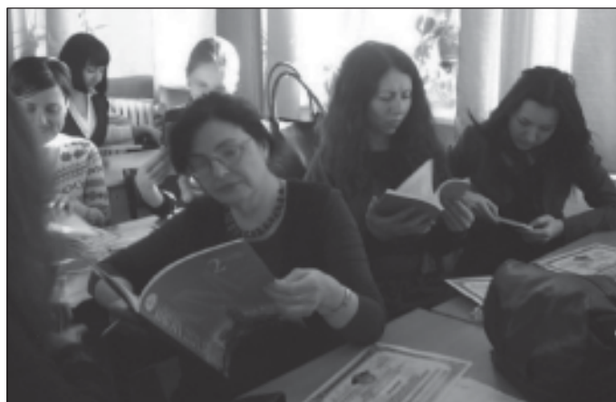
Вчителі гімназії знайомляться з новими публікаціями кафедри методики викладання іноземних мов КНЛУ