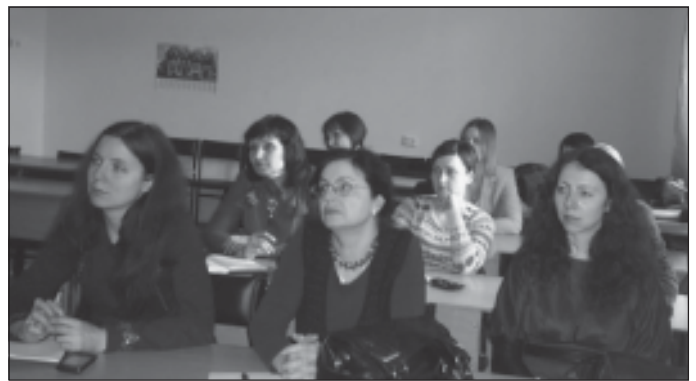
Вчителі гімназії № 191 уважно слухають доповідь