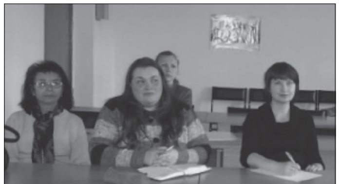
Викладачам кафедри методики є також що законспектувати