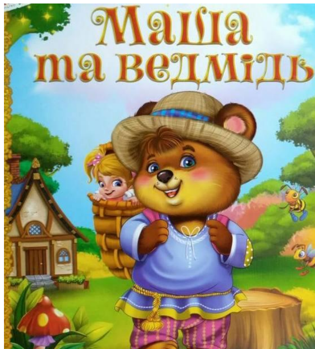
Рис. Г.2 Матеріал для дидактичної гри «Казковий етикет», ілюстрація казки «Маша і ведмідь»