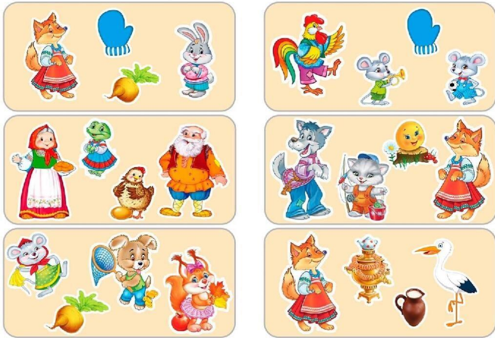
Рис. Б.1 Матеріал для дидактичної гри «Що зайве?»