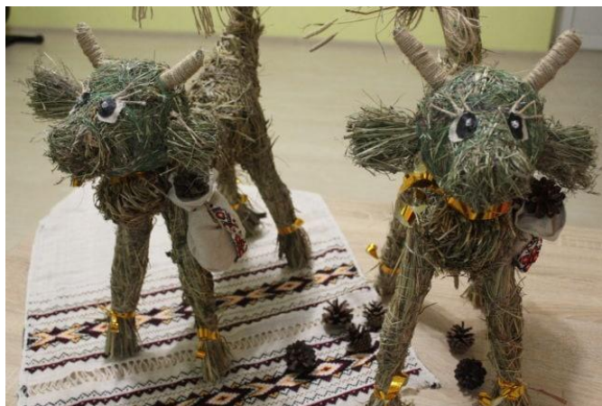
Рис. А.3 Приклад іграшки-головного героя твору «Солом'яний бичок»