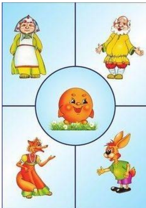
Рис. В.1 Матеріал для дидактичної гри «З якої казки герой?»