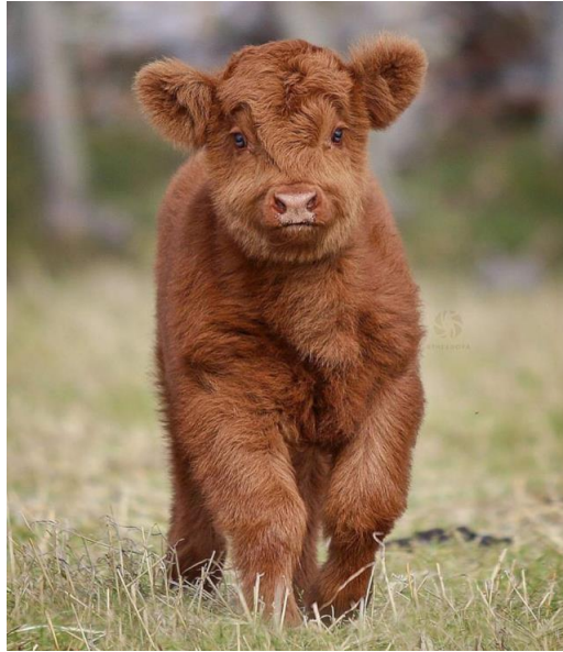
Рис. А.1 Приклад зображення живого теля