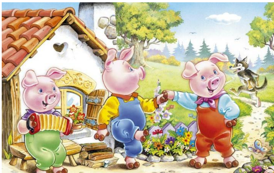
Рис. Д.2Матеріал для дидактичної гри «Казкова плутанина», ілюстрація казки «Три поросся»