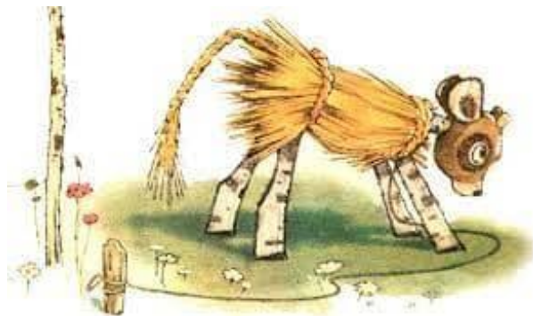
Рис. А.2 Приклад зображення головного героя твору «Солом'яний бичок»