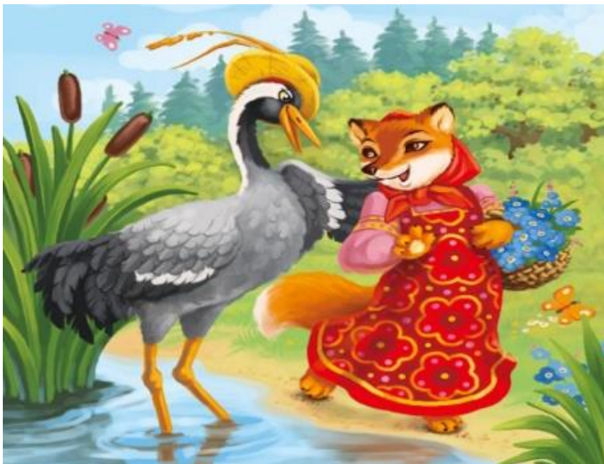
Рис. Д.3Матеріал для дидактичної гри «Казкова плутанина», ілюстрація казки«Лисиця та журавель»