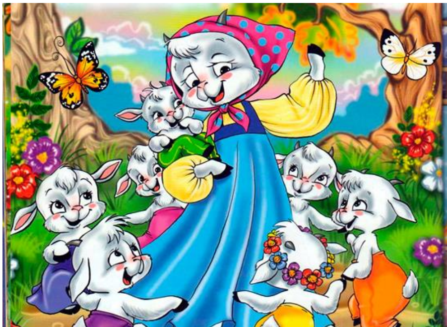
Рис. Д.1Матеріал для дидактичної гри «Казкова плутанина», ілюстрація казки «Коза і семеро козенят»