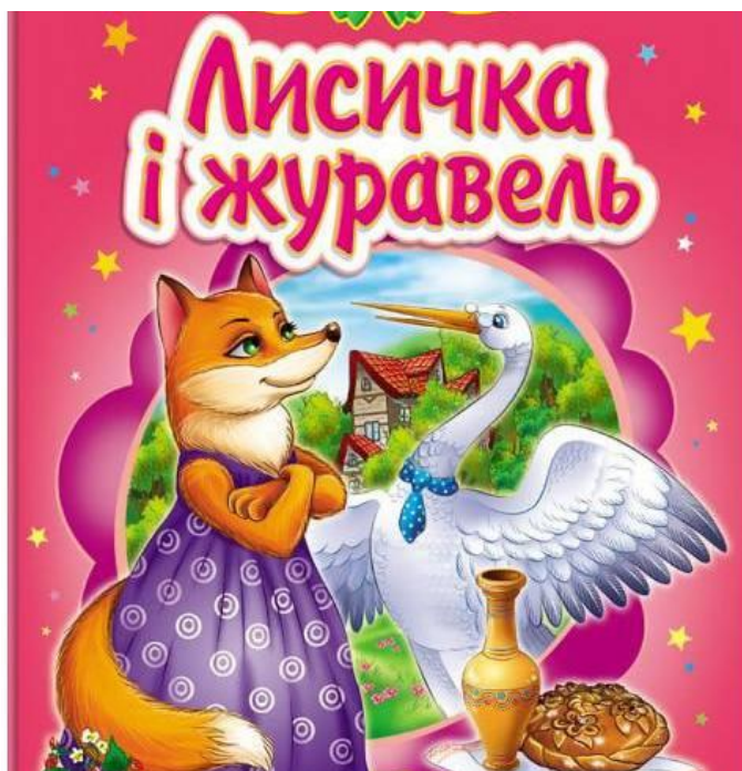
Рис. Г.3 Матеріал для дидактичної гри «Казковий етикет», ілюстрація казки «Лисиця та журавель»