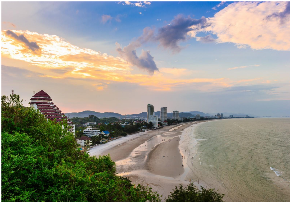
Рис. 2.7. Хуа Хін