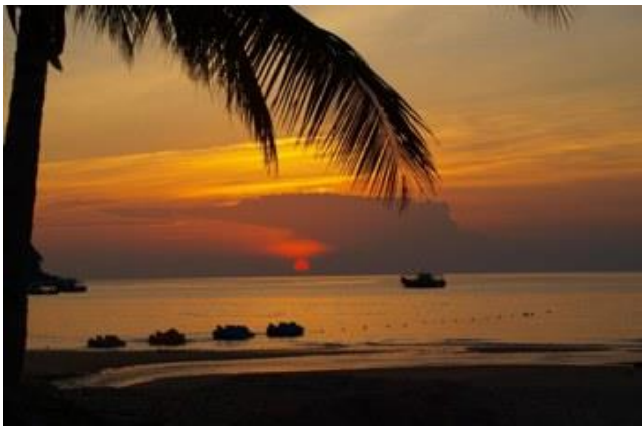
Рис. 2.15. Острів Тіоман