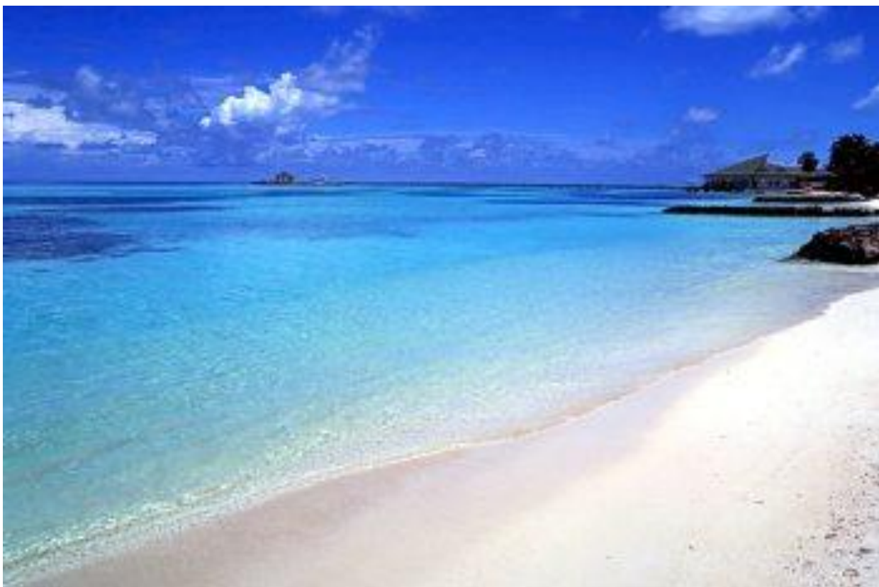
Рис. 2.18. Острів Реданг