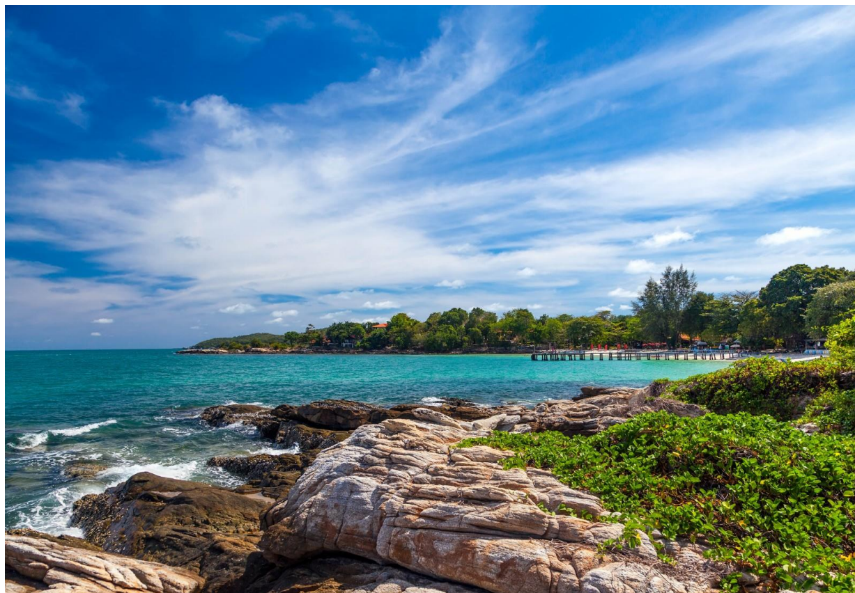
Рис. 2.10. Самет