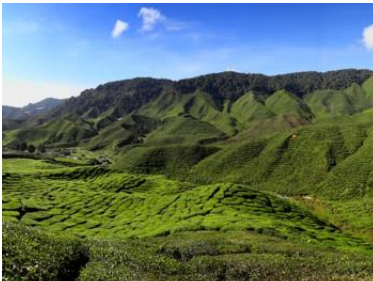
Рис. 2.19. Курорт Камерон