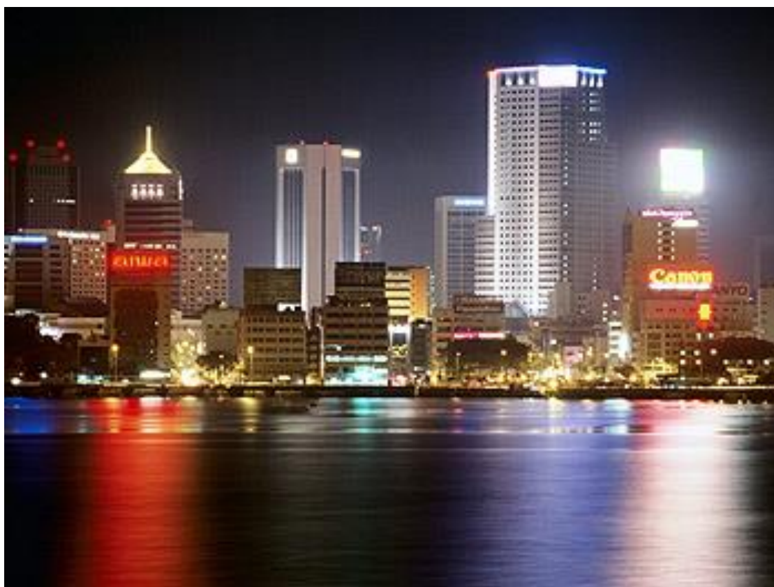
Рис. 2.20. Курорт Джохор-Бару