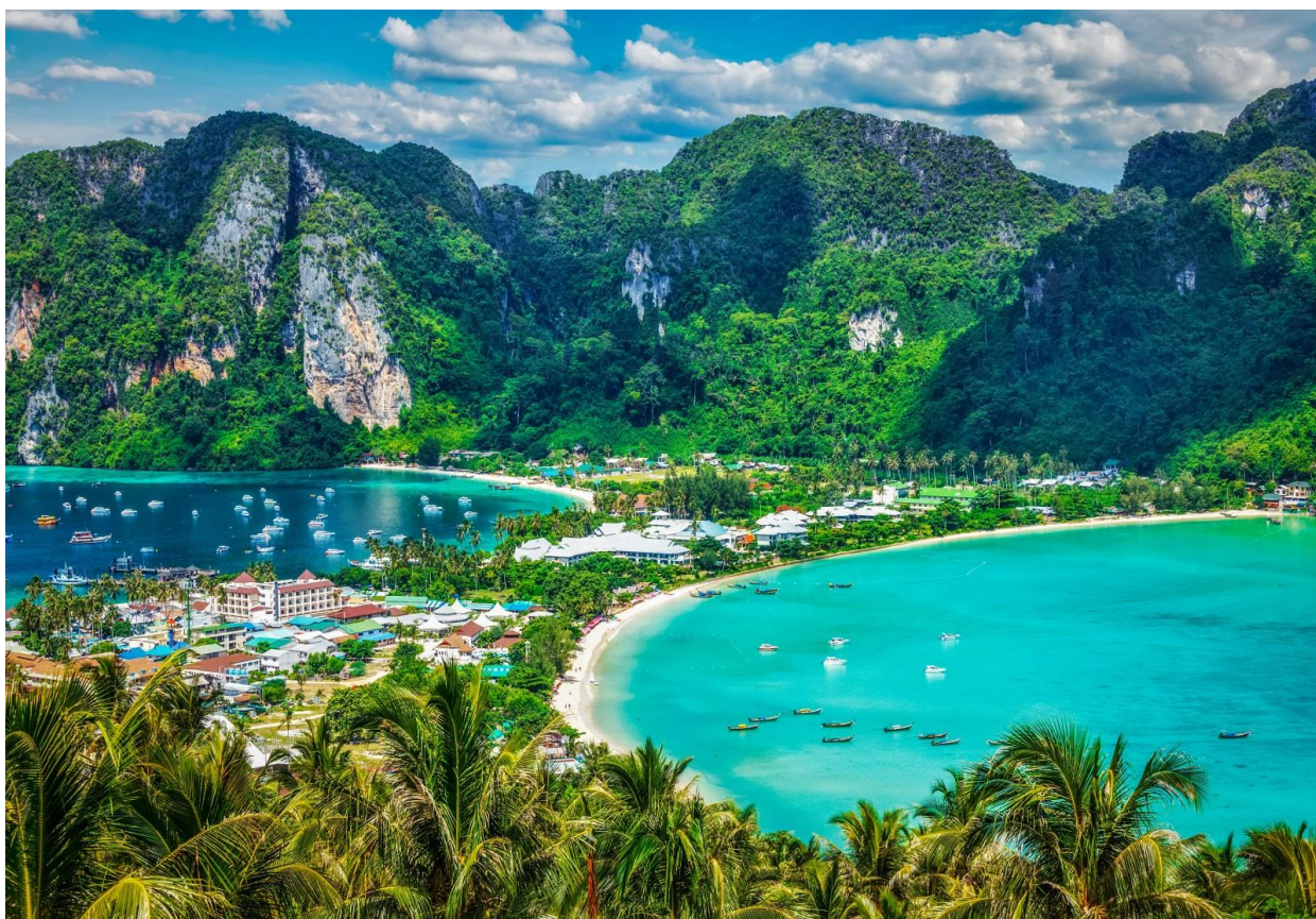
Рис. 2.4. Пхі-Пхі