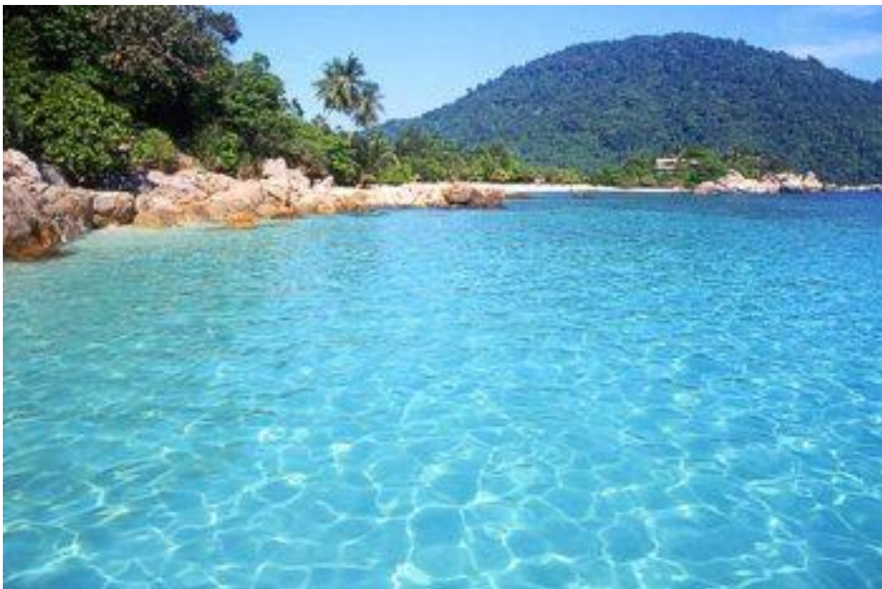
Рис. 2.17. Острови Перхентіани