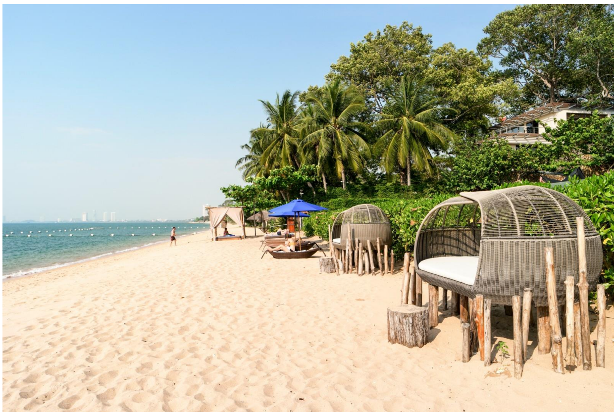
Рис. 2.5. Паттайя