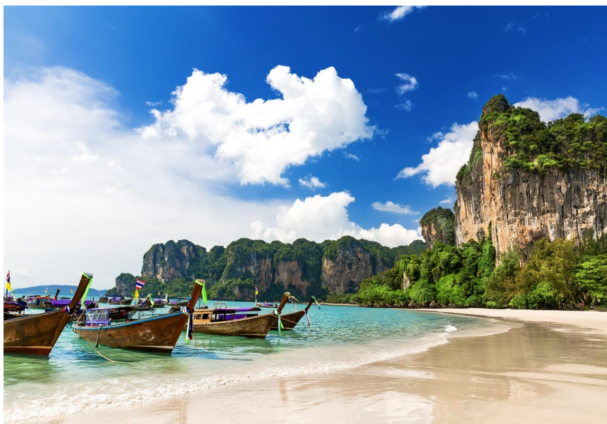
Рис. 2.2. Крабі