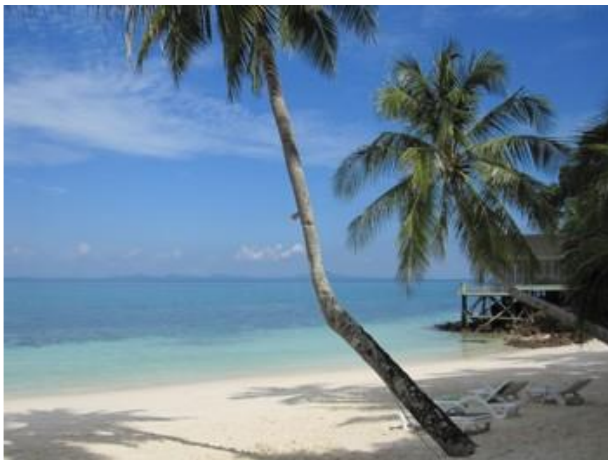
Рис. 2.16. Острів Рава