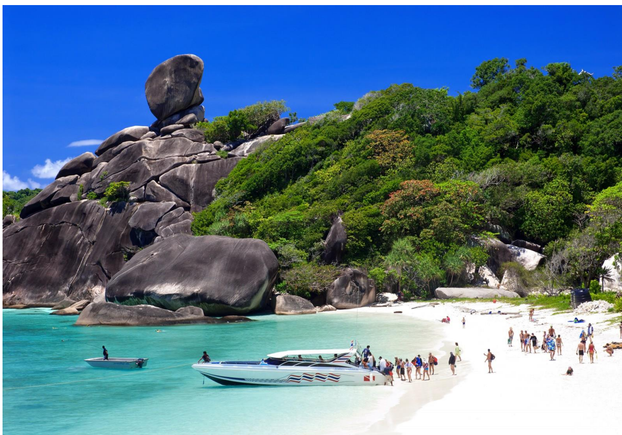
Рис. 2.8. Као Лак