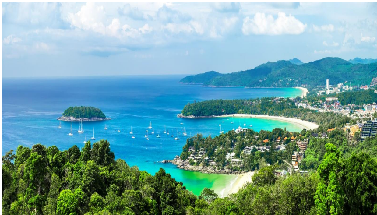
Рис. 2.1. Пхукет