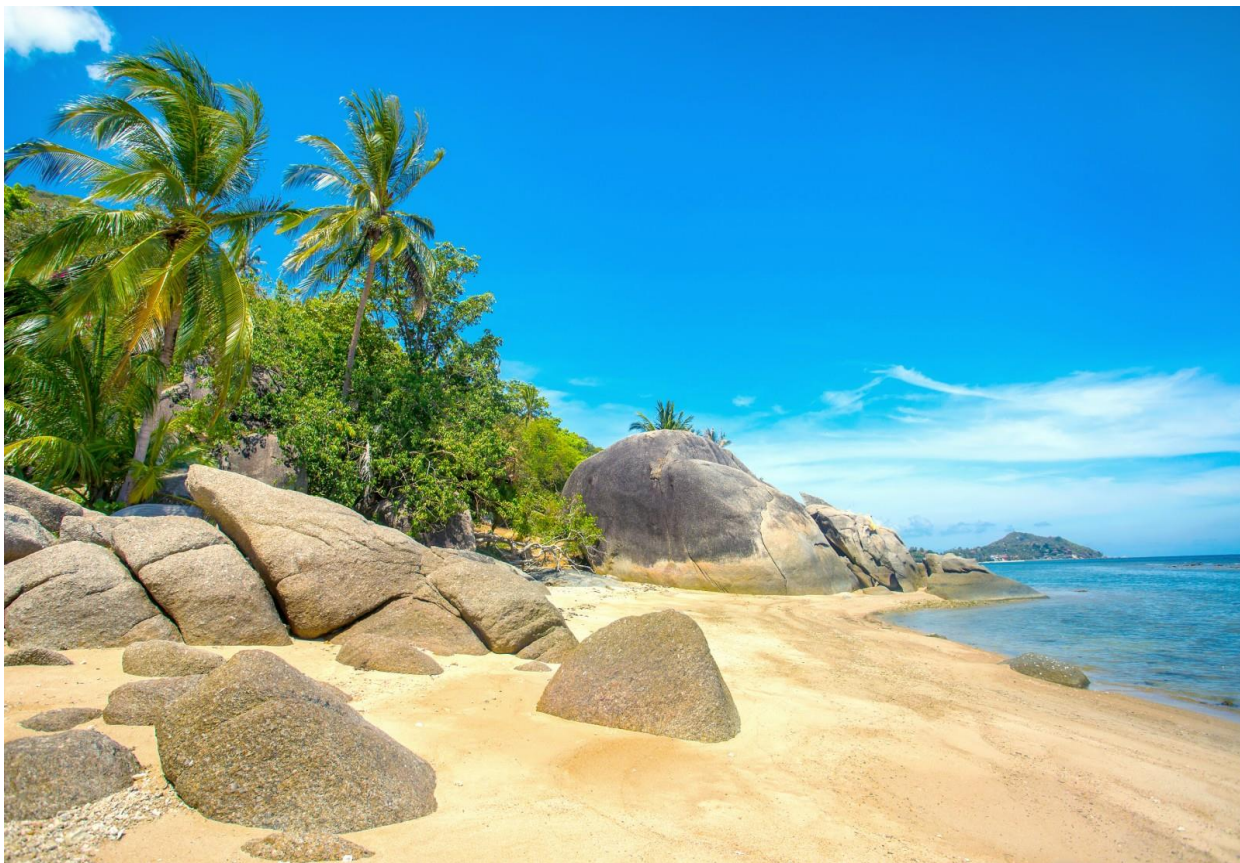
Рис. 2.9. Ко Панган