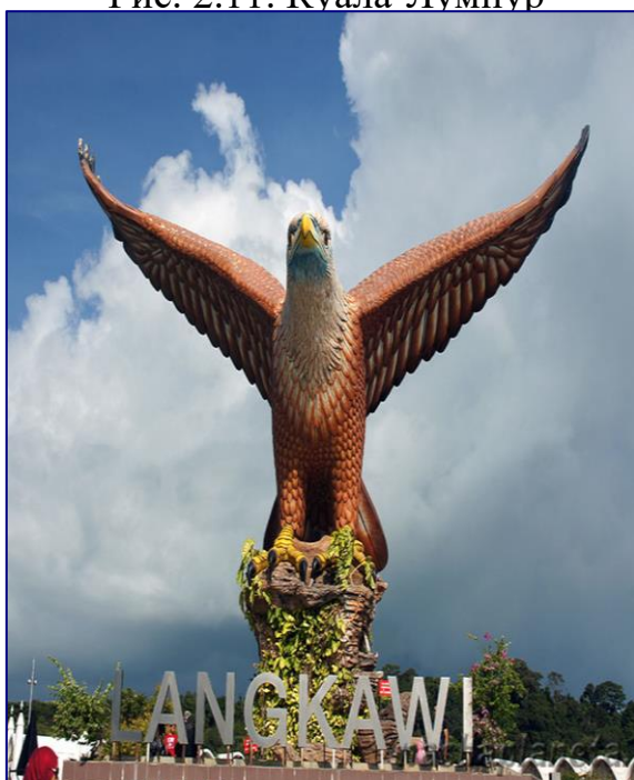
Рис. 2.13. Остров Лангкави