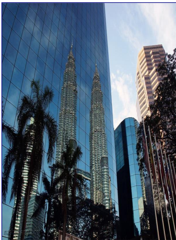
Рис. 2.11. Куала-Лумпур