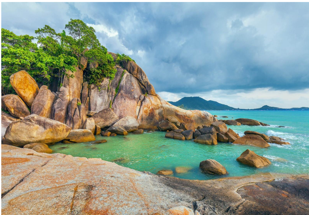
Рис. 2.3. Острів Самуї