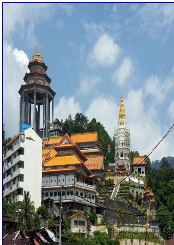
Рис. 2.12. Остров Пенанг