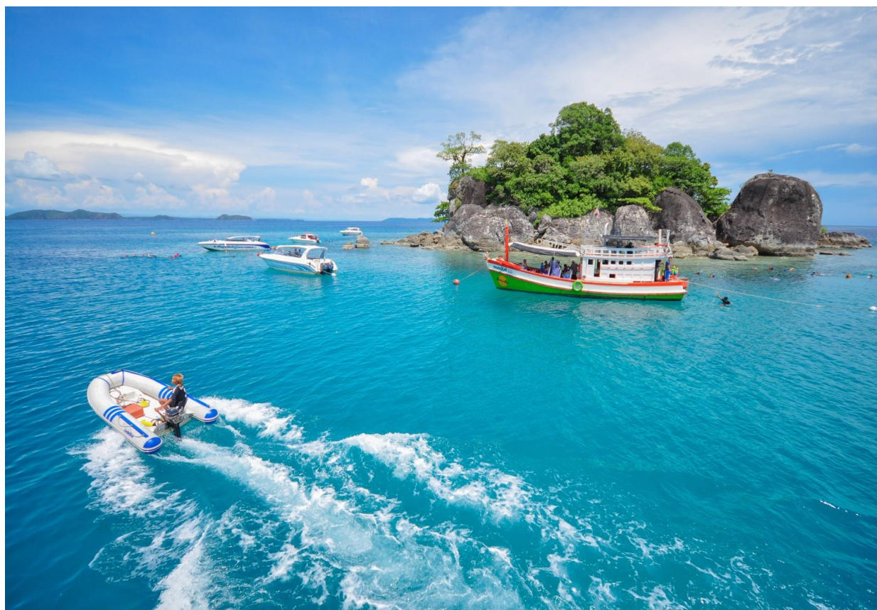
Рис. 2.6. Ко Чанг