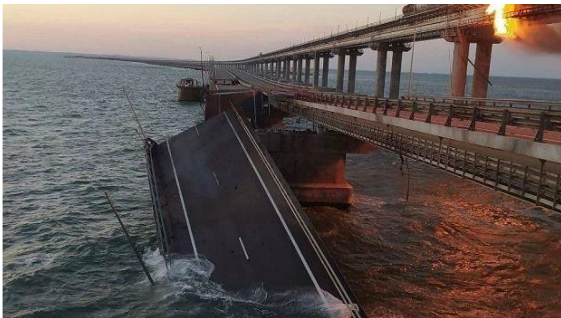
Кримський міст станом на 08.10.2022.