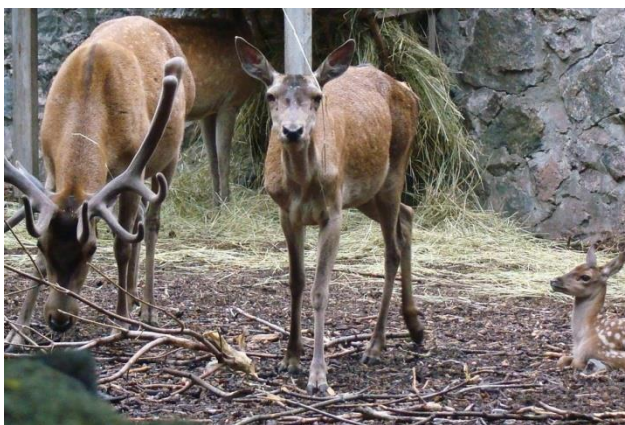
Рис. 3 Черкаський зоопарк

«Фельдман Екопарк» — зона сімейного відпочинку з розважальними закладами та контактним зоопарком. Вхід до парку безкоштовний, але гості можуть не лише подивитися на тварин, а й познайомитися з тваринами в зоні зоопарку ближче та погодувати деяких із них. Тут мешкає близько 300 видів тварин, у тому числі рідкісні та зникаючі. У сучасних вольєрах можна побачити представників леопардів, ягуарів, білих бенгальських тигрів, гімалайських ведмедів, плямистих оленів і багатьох інших тварин і птахів. Крім того, на території є дитячі майданчики, містечка ремісників, зони йоги тощо.