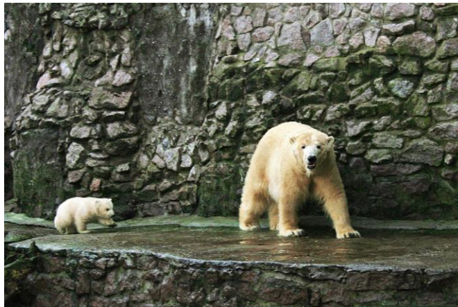
Рис. 5 Миколаївський зоопарк

Вік Миколаївського зоопарку понад 120 років. Він починався як приватна колекція риб і амфібій, а зараз є одним із найкращих зоопарків України. Фазани і павичі, єноти і росوماхи, леви і тигри, лемури і бабаки - тут мешкають понад 75 видів ссавців, 35 незвичайних рептилій, більше 70 красивих риб і близько 130 видів птахів. На території є окрема локація «Дідова хата», оформлена в стилі замиського дворика, де відвідувачі можуть поспілкуватися з деякими тваринами: погодувати їх і погладити. У зоопарку також є кілька дитячих майданчиків і ресторани швидкого харчування.