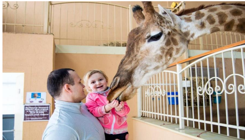
Рис. 2 Відвідувачі зоопарку "XII місяців"

Зоопарк «XII місяців» — ще один вражаючий зоопарк із великою та різноманітною популяцією, розташований у селі Демидів неподалік від Києва. «December Happy Animal Park» — комплекс відпочинку для всієї родини, на просторій території якого розташувався великий зоопарк, зелений сад, озера, фонтани та водоспади, а влітку — територія басейну та дитячий майданчик. Серед екзотичних і рідкісних тварин зоопарку — альпаки, антилопи кана, бенгальські тигри, білі носороги, зебри, скунси, капібари та шотландські поні. У певний час гості можуть взяти участь у годуванні жирафів і носорогів спеціальним кормом. Особливою родзинкою парку є фантастичний ресторан у стилі білого замку Нойшванштайн, прототипу замку Сплячої красуні Діснея.