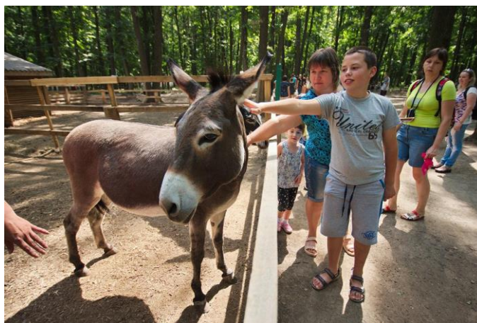
Рис. 4 «Фельдман-Екопарк»

«Фельдман Екопарк» — зона сімейного відпочинку з розважальними закладами та контактним зоопарком. Вхід до парку безкоштовний, але гості можуть не лише подивитися на тварин, а й познайомитися з тваринами в зоні зоопарку ближче та погодувати деяких із них. Тут мешкає близько 300 видів тварин, у тому числі рідкісні та зникаючі. У сучасних вольєрах можна побачити представників леопардів, ягуарів, білих бенгальських тигрів, гімалайських ведмедів, плямистих оленів і багатьох інших тварин і птахів. Крім того, на території є дитячі майданчики, містечка ремісників, зони йоги тощо.