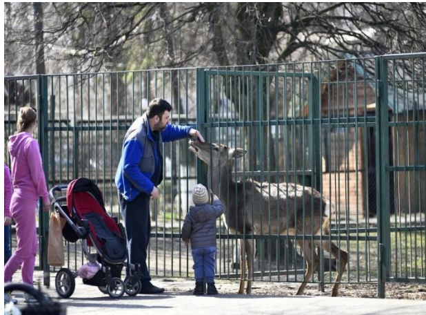
Рис. 9 Луцький зоопарк

часу зоопарк прикрасив нове місто з ведмежим вольєром, басейном і оглядовим майданчиком, а також вольєром для левів. У зоопарку мешкає понад 120 видів тварин і птахів, серед яких леви, тигри, лемури, рисі, мавпи, папуги, чорні лелеки та страуси. На території зоопарку організуються традиційні тематичні свята. Це чудове місце для сімейного відпочинку на природі, адже зоопарк розташований у зеленому парку імені Лесі Українки.