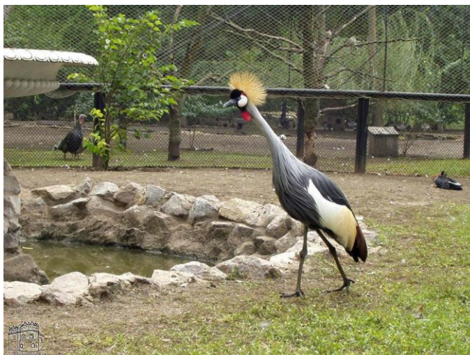
Рис. 6 Асканія Нова

«Біопарк» — невеликий, але дуже цікавий екзотичними тваринами, розташований на околиці Одеси. На його упорядкованій території є зелені зони для дозвілля, дитячий майданчик для маленьких гостей, заміський дворик та ресторан швидкого харчування. У сучасних вольерах живуть білі леви, бенгальські тигри, леопарди, арктичні вовки, гібони і шимпанзе, капуцини і лемури, гігантські черепахи, кенгуру, мангусти і жирафи. Ви не тільки зможете побачити тварин, але й познайомитеся з ними ближче. Серед послуг біопарку такі послуги, як «виїзд у лемурів», годування жирафів та фотографування з жирафами. Але головною родзинкою парку є справжня дика природа. Під час сафарі-драйву з гідом на приватному автомобілі гості можуть побачити стада страусів і бізонів, лаймів і буйволів, зебр і африканських річкових дельфінів в умовах, наближених до їх природного середовища існування.