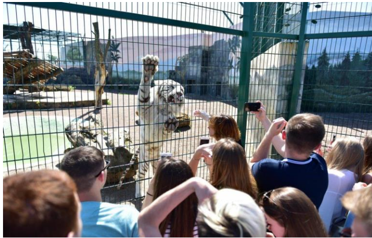
Рис. 7 Біопарк в м. Одеса

Подільський зоопарк — один із наймолодших зоопарків України, розташований у Вінниці. Тут мешкає близько сорока видів тварин і більше ста представників птахів. Цієї весни велика родина Подільського зоопарку поповнилася: три мангуста, дитинча червоної лами та гамартомова мавпа. Також серед постійних мешканців Вінницького зоопарку красуні-павичі та фазани, олені, зубри, страуси, муфлони, бізони, лами та ведмеді, які, до речі, нещодавно переселилися у новий просторий вольєр. Територія зоопарку прикрашена зеленню, декоративними ставками та красивими фотозонами, а також місцями відпочинку. Деяких тварин можна годувати, але тільки певними продуктами, такими як яблука, капуста, морква.