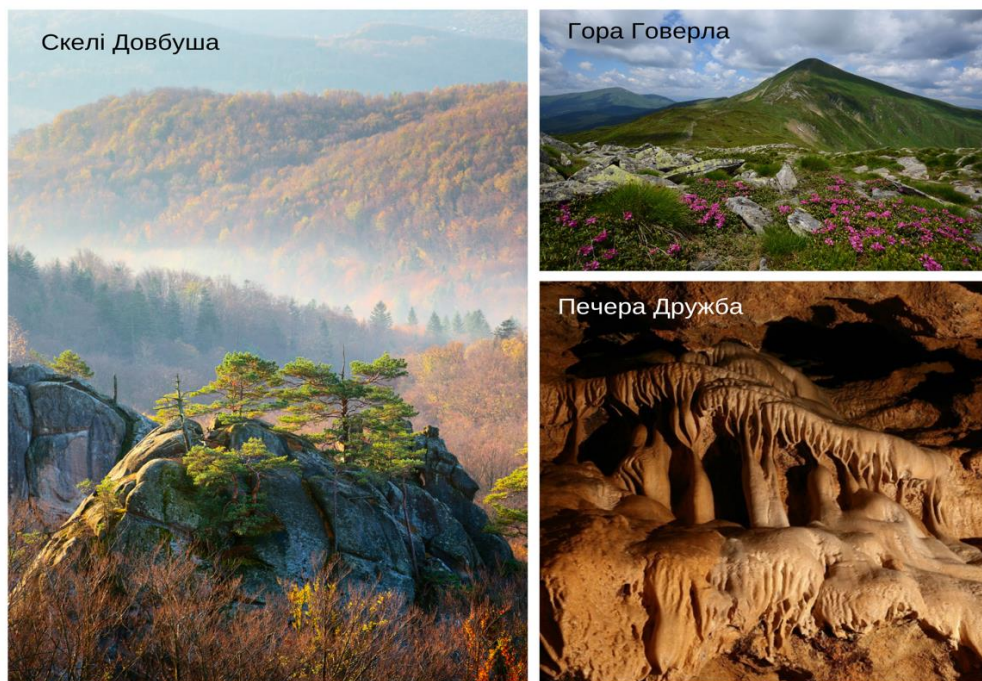
Рис 1.2 Атрактивні об'єкти неживої природи Українських Карпат

фортеця періоду X століття – знаходиться на висоті 668 м н.р.м. Це скелясті виступи пісковиків заввишки до 80 м, що утворились більше 70 млн років тому на дні моря [5, с.226].