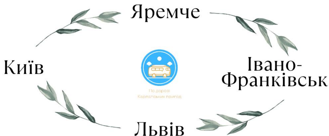
Рис. 2.1 Схема туру «По дорозі карпатських пригод»