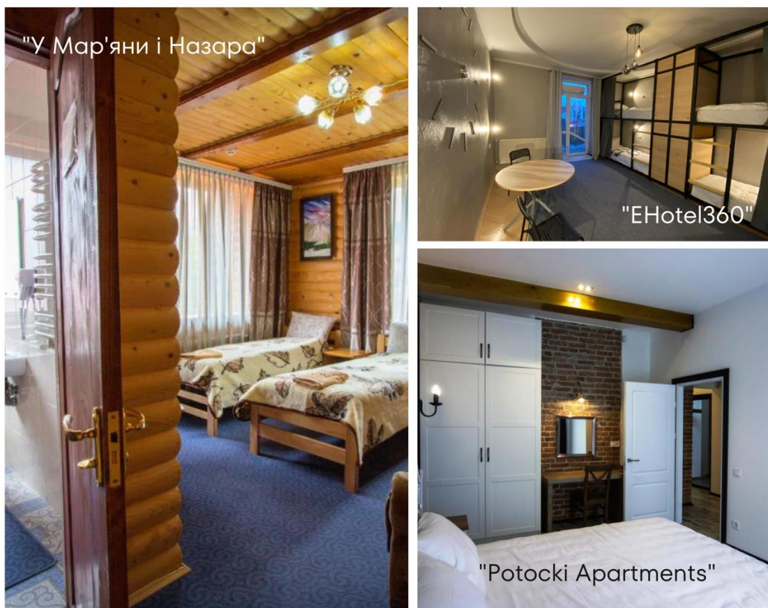
Рис. 2.2 Готелі, які потенційно розглядаються для проживання під час туру

Таким чином, розселення в готелях класу 3*-4* зі сніданками, які включені до вартості туру, гарантують комфорт та відпочинок у відповідності до найвищих стандартів.