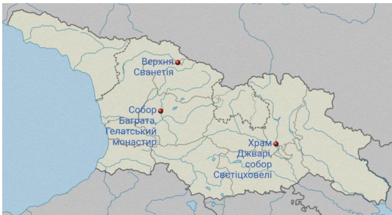
Рис.2.1. Об'єкти Світової спадщини ЮНЕСКО у Грузії