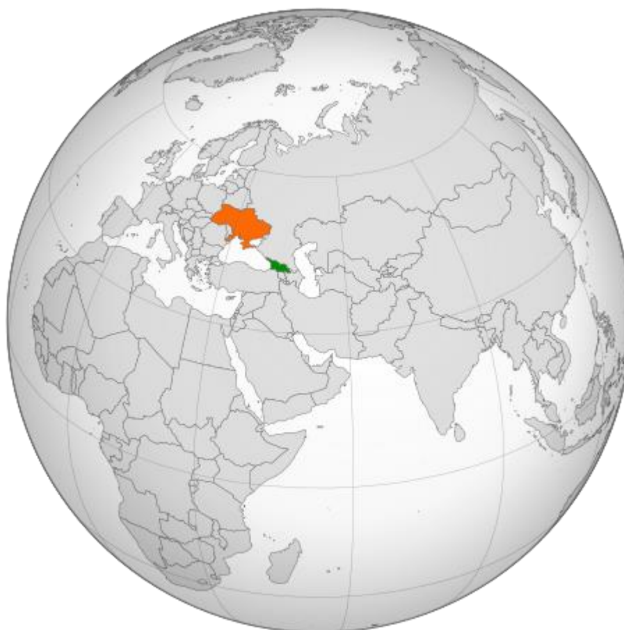
Рис.3.2. Зображення України та Грузії на карті