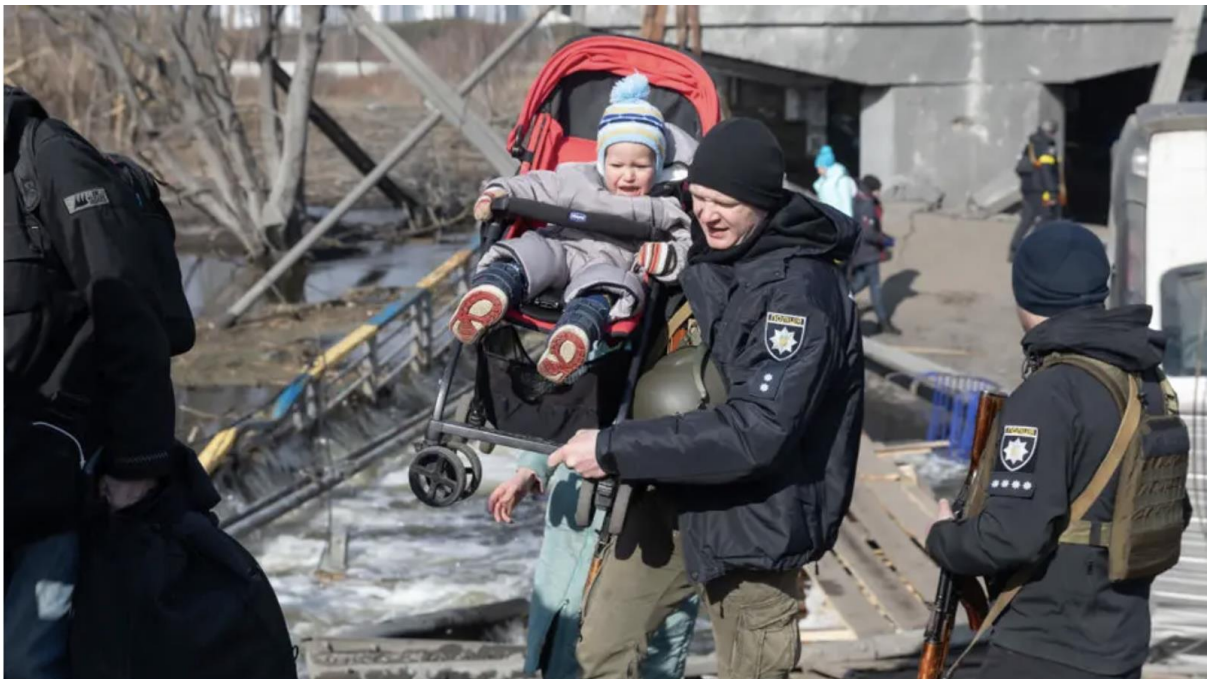
IRPIN, UKRAINE - 2022/03/09: A serviceman carrying a kid during the evacuation. Thousands of residents of Irpin have to abandon their homes and evacuate as Russian troops bomb the city.

2. Емоційні заклики: ЗМІ часто використовують емоційну мову, зображення та відео, щоб викликати почуття симпатії або обурення у своєї аудиторії. В іноземних ЗМІ здебільшого фото розбитих домівок, плачущих людей, інвалідів, дітей, які залишились без батьків і багато всього горя, яке наробила війна. Робиться це для того, щоб їх громадяни підтримували українців як мога більше, бо саме через людяність до них намагаються звернутися за поміччю. Прикладом може слугувати ця світлина, з американського журналу Fox 35 Orlando , 10 березня 2022 року: