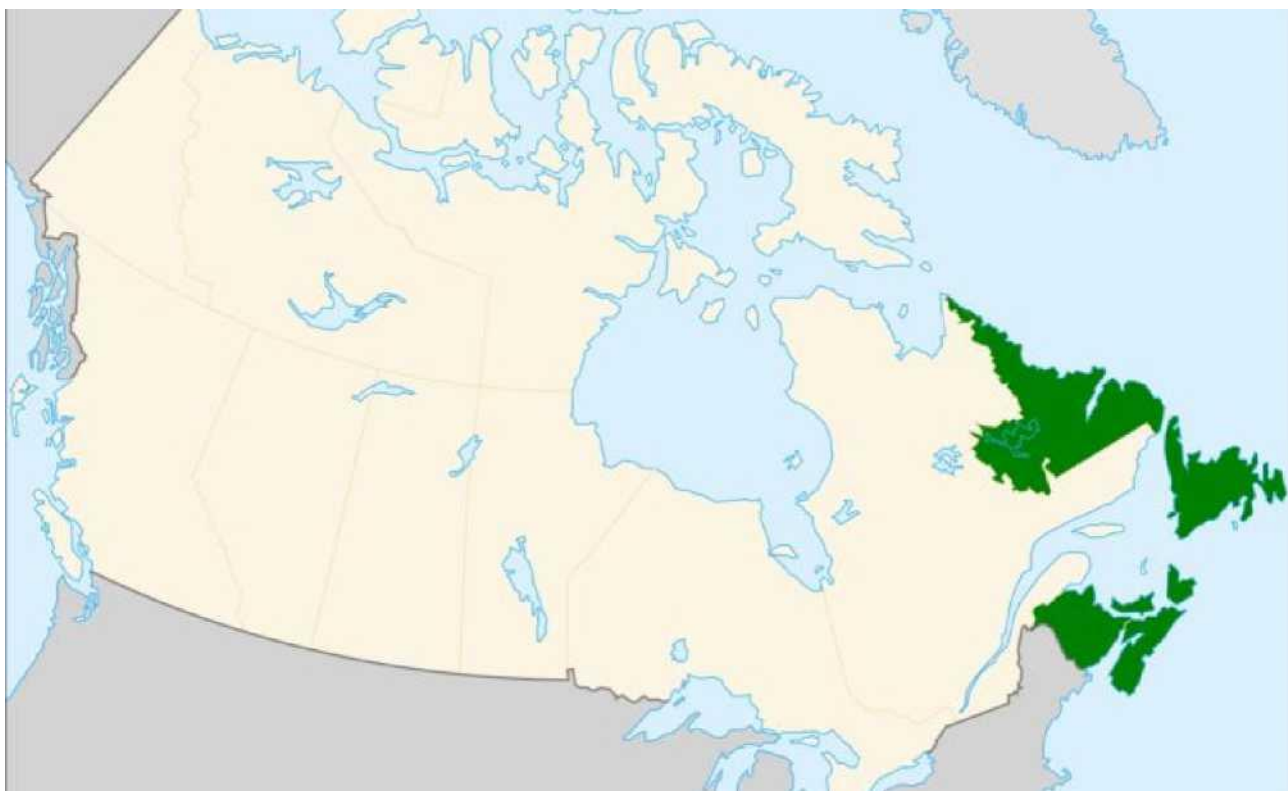
Рис. А.4. Атлантичний регіон Канади.