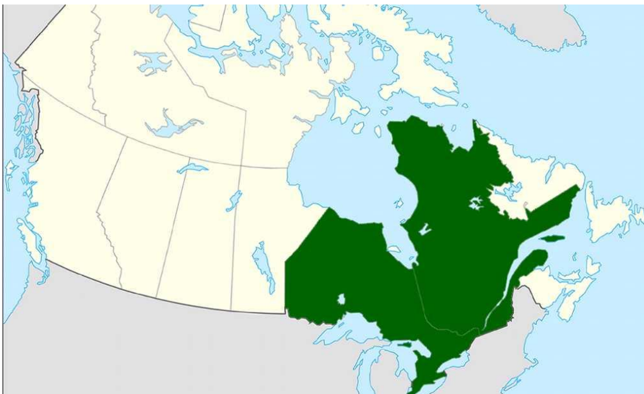
Рис. А.1. Центральний регіон Канади.