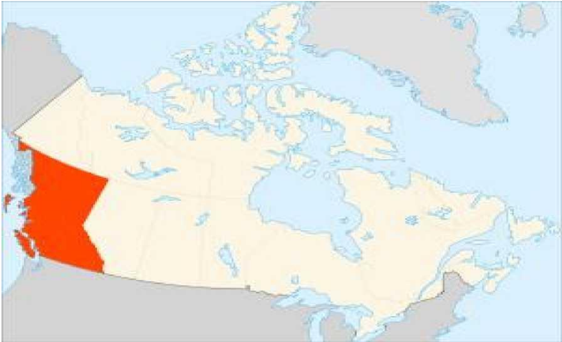
Рис. А.3. Тихоокеанський регіон Канади.