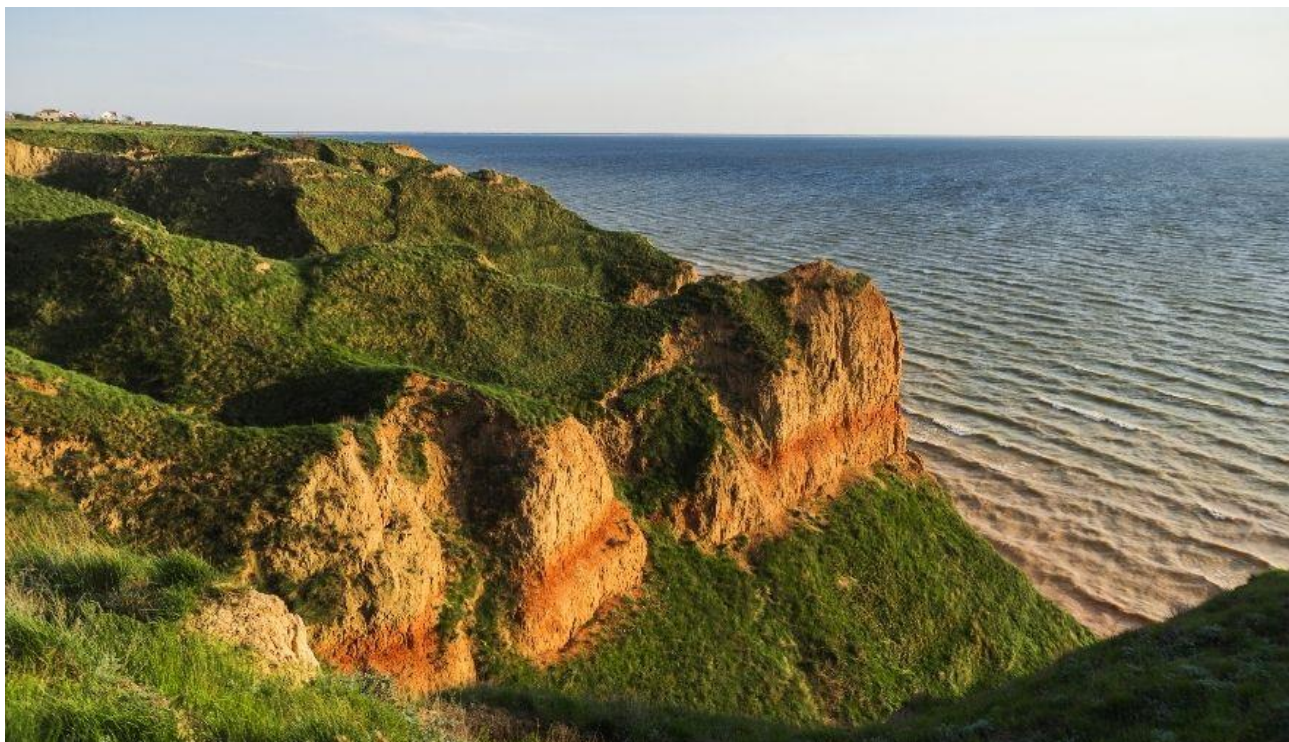
Додаток Б. рис. Б.5 Станіславські гори