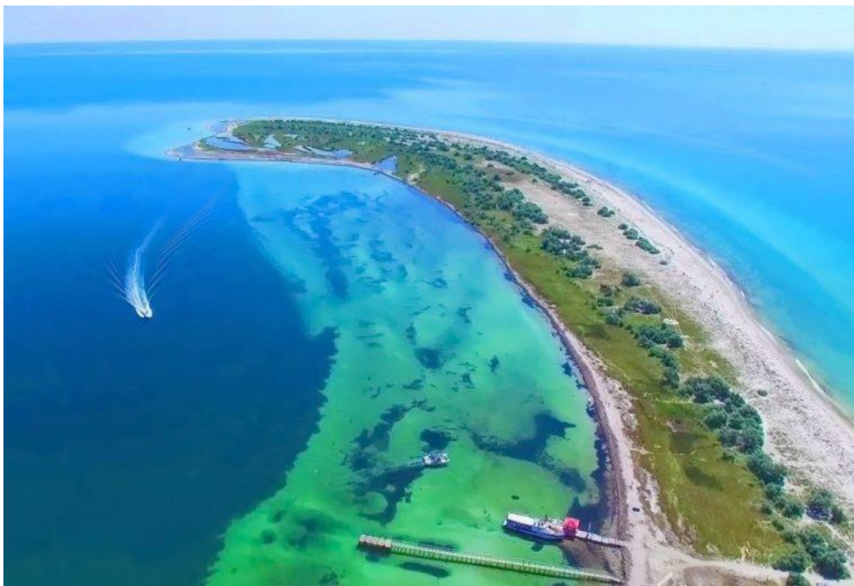
Додаток Б. рис. Б.4 Джарилгач