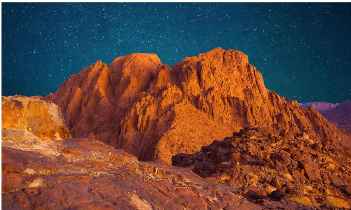
Додаток А. рис. А.2 Гора Мойсея