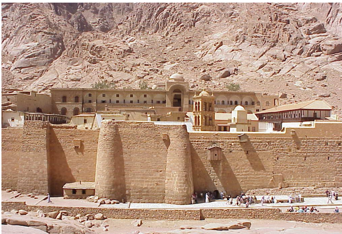
Додаток А. рис. А.3 Монастир св. Катерини