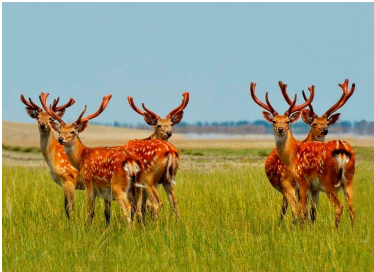
Додаток Б. рис. Б.1 Асканія Нова