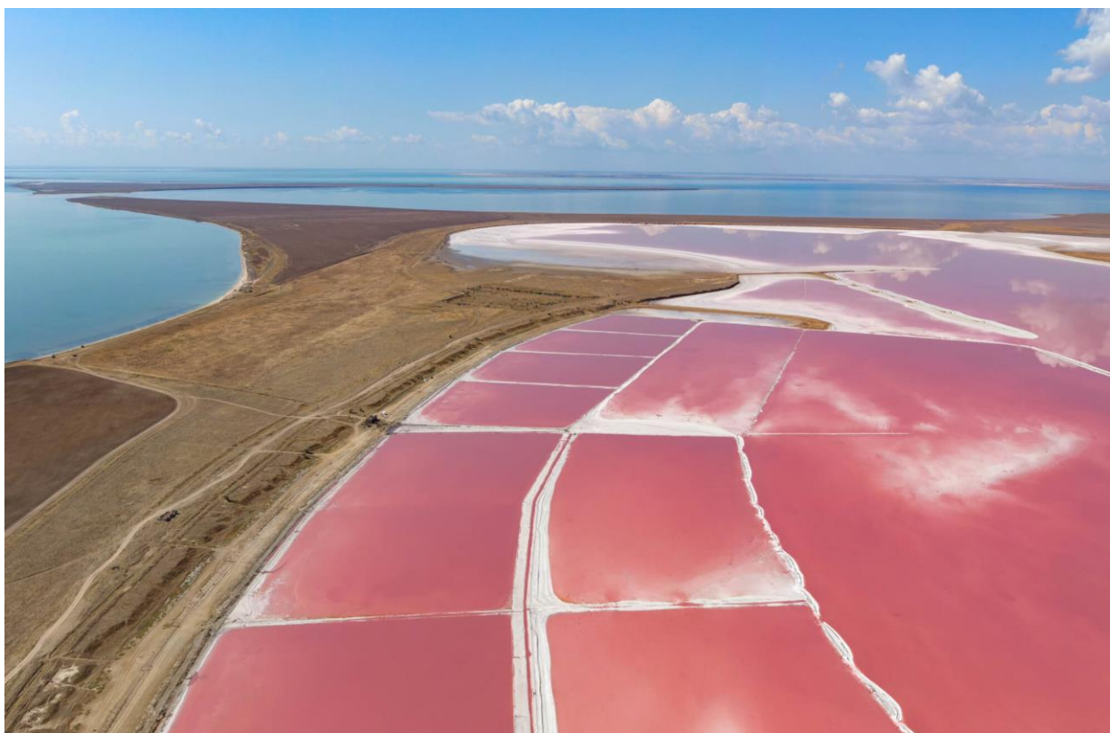
Додаток Б. рис. Б.5 Рожеві озера