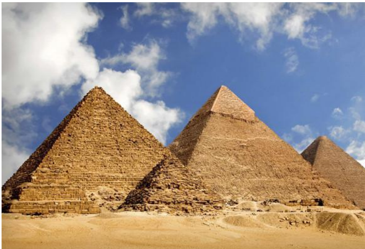
Додаток А. рис. А.1 Піраміди Гізи