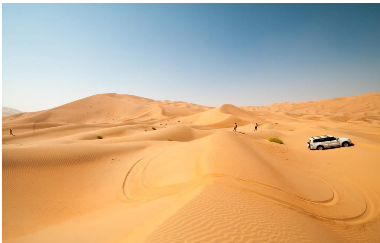
Додаток Б. рис. Б.2 Олешківські піски