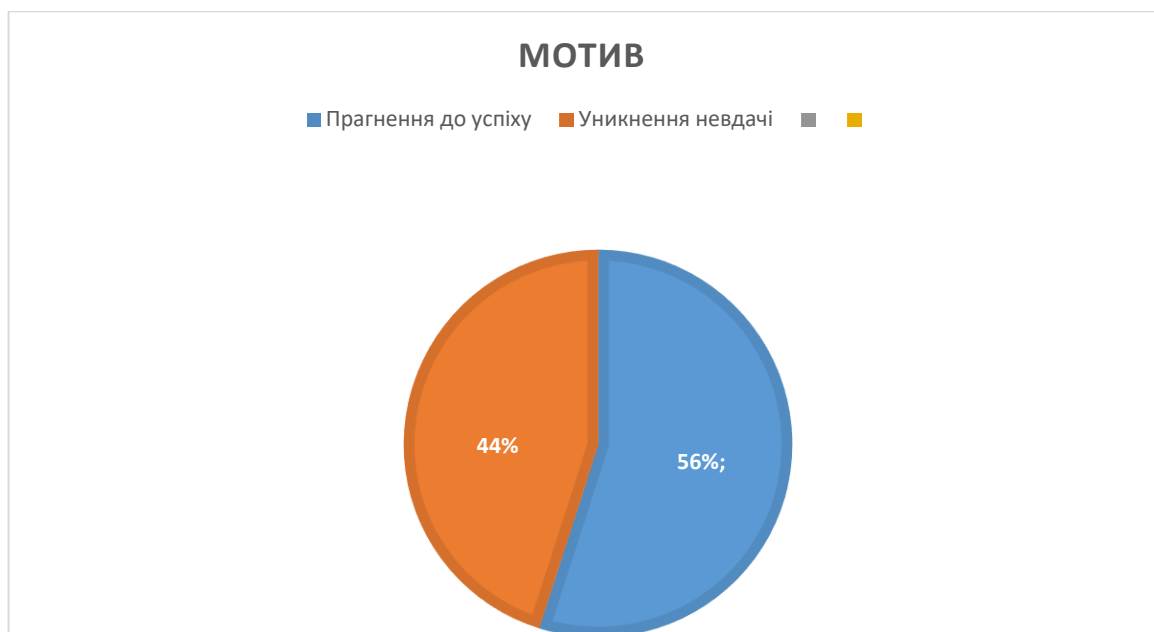
Рисунок 3.2. Кругова діаграма за переважанням мотиву

Різниця між цими двома мотивами полягає у: