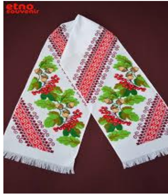
Рис. 2.7. Рушники вишиті

Тут речі умільців, ні з чим незрівнянні, Барвисті стрічки, рушники вишивані.