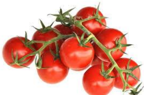
Рис. 2.3. Помідори