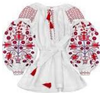
Рис. 2.9. Вишиванка