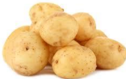
Рис. 2.5. Картопля