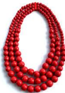
Рис. 2.8. Сопілки та намисто

Пісня звучить і діти підспівують: «Ходить гарбуз по городу...»