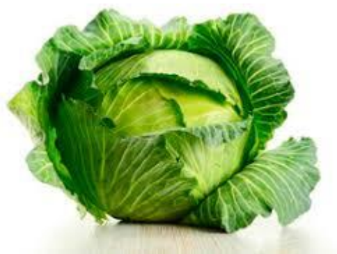
Рис. 2.1. Капуста

Діти: кожен називає рослину, яку запам'ятав і де її можна використовувати.