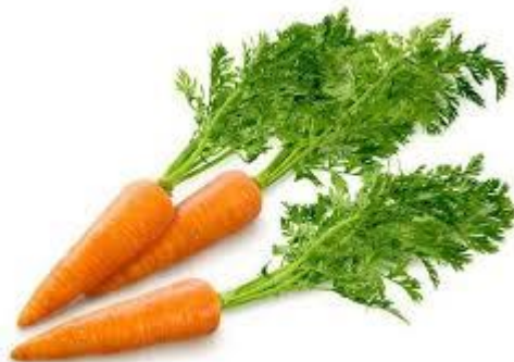
Рис. 2.2. Морква