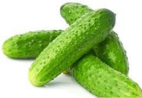
Рис. 2.4. Огірки