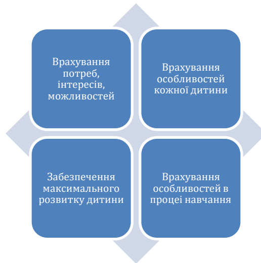
Мал. 3. Індивідуалізація підходу у роботі з дитиною.

Індивідуалізація підходу дає можливість забезпечити повноцінний розвиток кожної дитини з урахуванням її індивідуальних особливостей. Кожна дитина має свої особливості, і педагоги повинні враховувати це при розробці індивідуальних програм розвитку соціальних умінь і навичок.