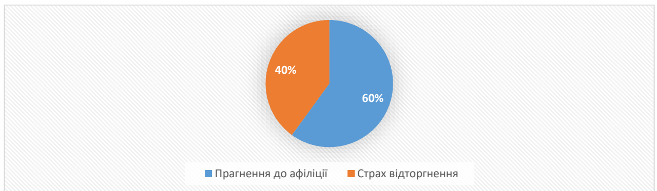
Рис.2.3.Результати діагностики за методикою «Мотивація афіліції (МАФ)»

Особливу увагу батькам, педагогам слід звернути на підлітків, у яких діагностовано тенденцію до виникнення страху відторгнення. Підлітки даної категорії схильні до негативного впливу неформальних груп, до розвитку залежностей і шкідливих звичок.