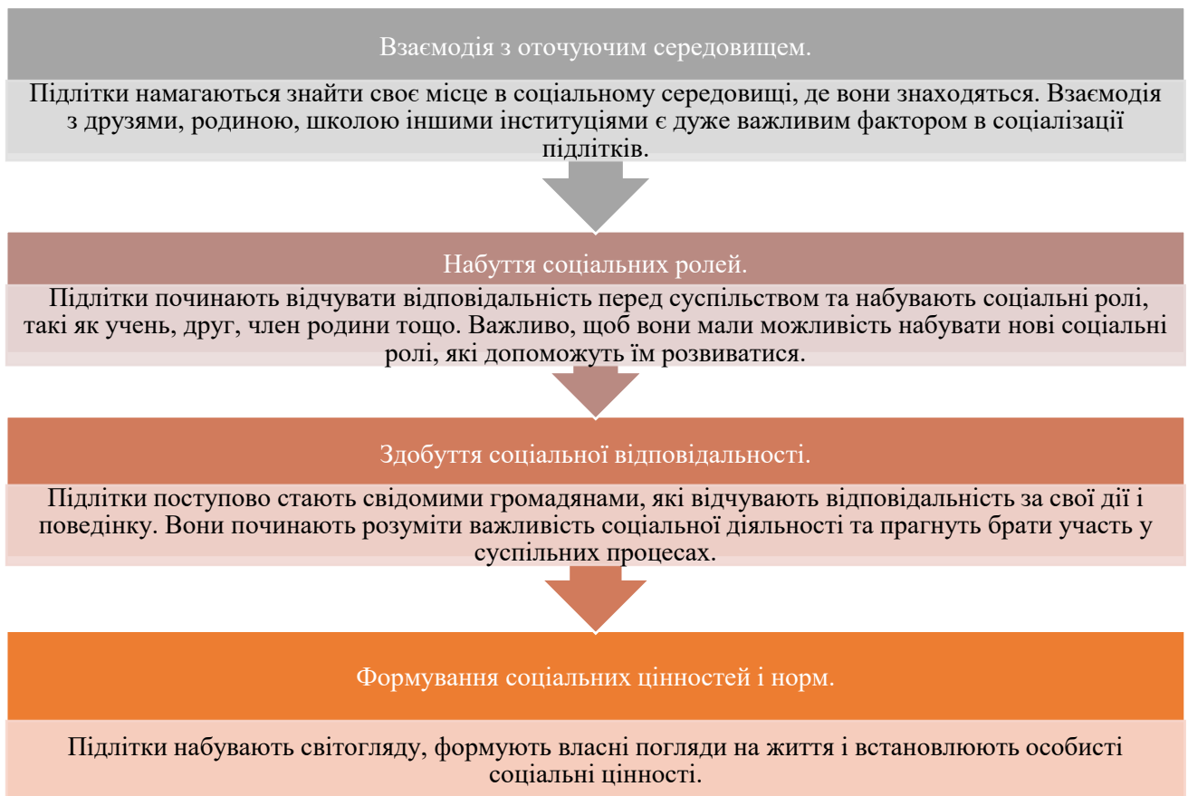
Рис.1.2. Аспекти соціального розвитку підлітка

Основними аспектами соціального розвитку підлітка є: взаємодія з оточуючим середовищем, набуття соціальних ролей, здобуття соціальної відповідальності, формування соціальних цінностей та норм (рис 1.2) [13].