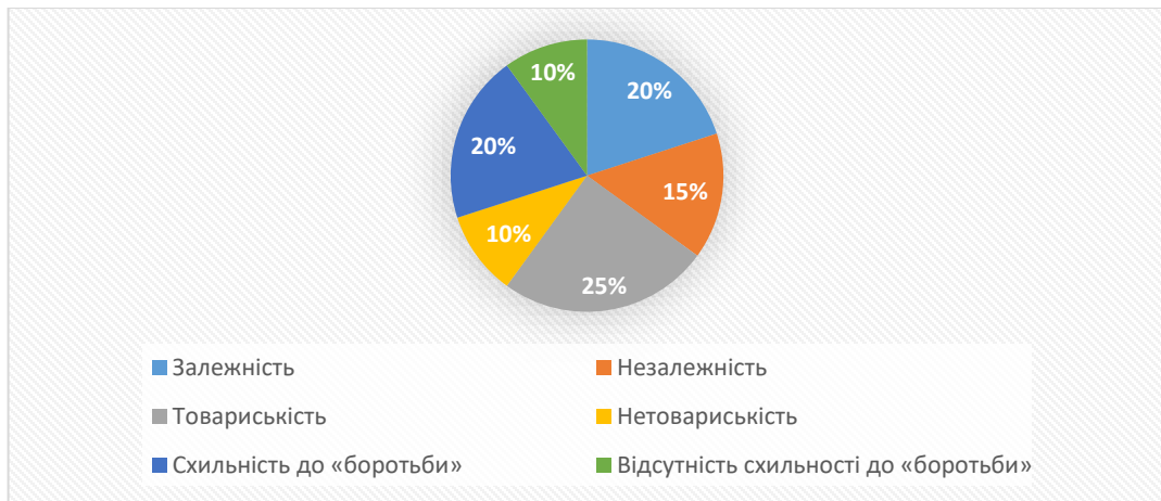
Рис.2.2. Результати діагностики за методикою «Q – сортування» (В.Стефансон)

Таким чином, ми можемо діагностувати переважання трьох тенденцій: до товариськості, до залежності та до боротьби. Відповідно до цього, участь у підліткових групах пояснюється прагненням до встановлення емоційних зв'язків з новими людьми, бажанням реалізувати лідерські якості та бути частиною самостійної системи, яка має власну систему цінностей. Тобто, підліткова група є платформою для самореалізації та самоствердження підлітка, способом розвитку комунікативних навичок.