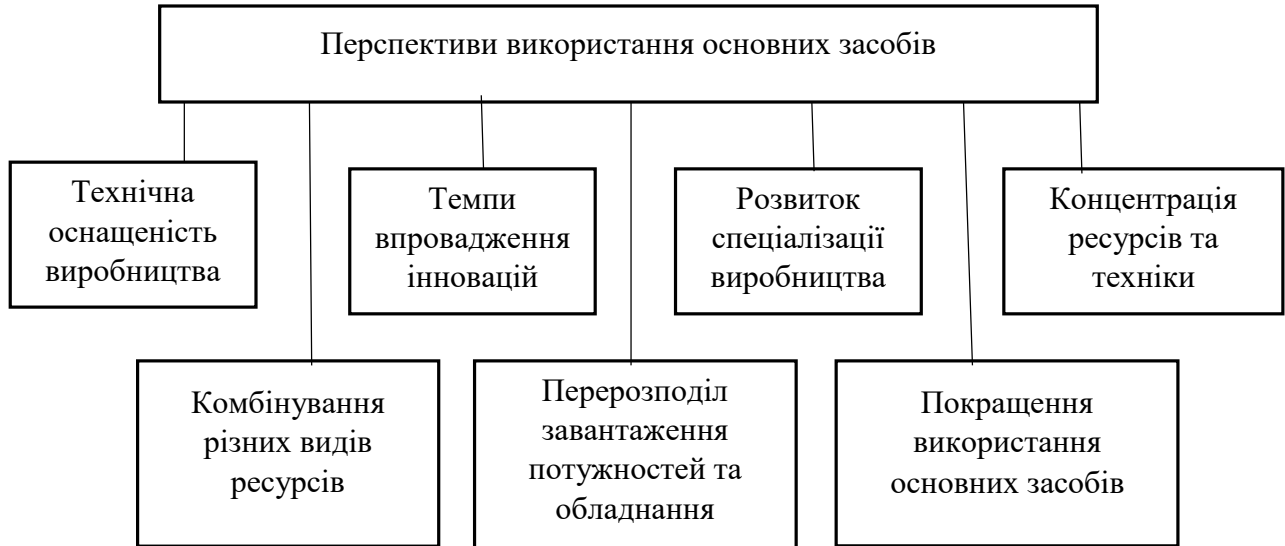
Рис. 1.1. Перспективи використання основних засобів [складено автором]

складову. До активної відносяться кошти, які беруть безпосередню участь у виробничому процесі, до пасивної – засоби, які забезпечують нормально функціонування виробничого процесу.