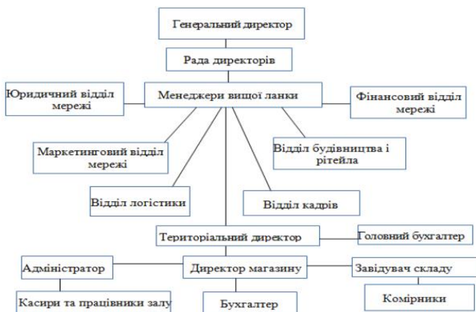
Рис.2.2. Організаційна структура ТОВ «АТБ-маркет»

Наведена вище схема організаційної структури підприємства є найбільш ефективною, оскільки на регіональному рівні управлінські рішення ухвалюються спеціалізованою командою, а на територіальному рівні існує декілька рівнів контролю.