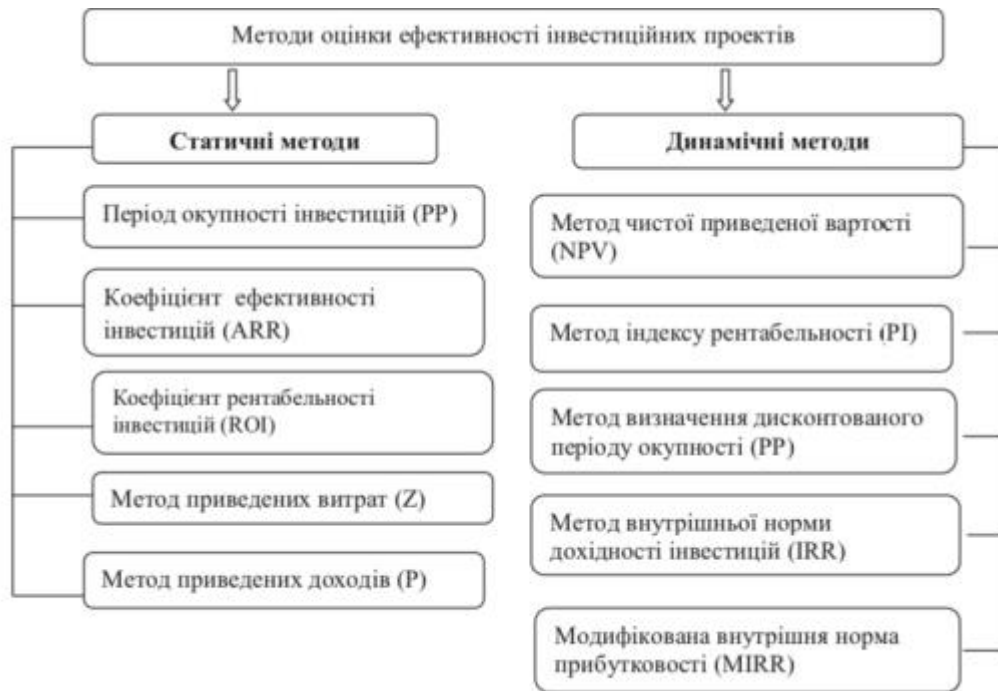
Рис. 1.1 Методи оцінки ефективності проєктної інвестиційної діяльності

методи оцінки – проєктивні, планові та засновані на фактичних доказах витрат і вигод, отриманих в результаті впровадження інвестиційних проєктів у більш ефективну інвестиційну діяльність компанії. На рисунку 1.1. описано методи оцінки ефективності проєктної інвестиційної діяльності. У додатку А наведено алгоритм їх розрахунку.