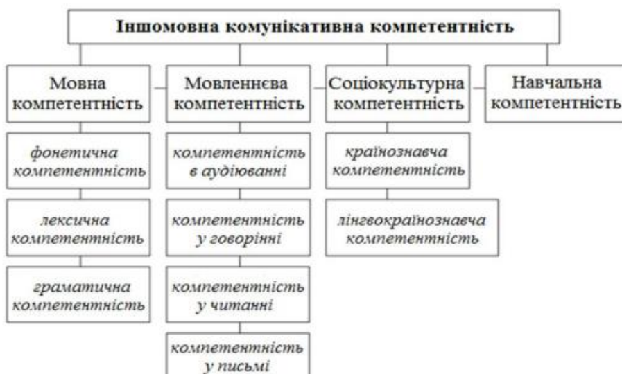
Рис.1.1 Структура іншомовної комунікативної компетентності

Структура комунікативної компетентності має чотири компоненти, а саме: мовна, мовленнєва, соціокультурна та навчальна компетентності.