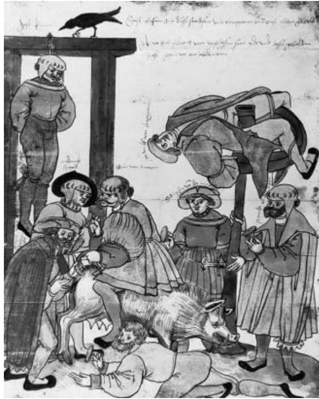
Рис.1 Приклад виховання