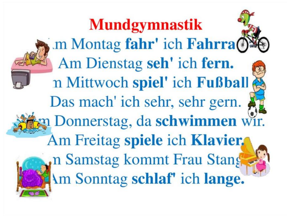
Рис. 3.4. Mundgymnastik

Відвідання виховних заходів учнів-практикантів, таких як «День ЗСУ» та «Я - українець. Я - людина», також сприяли розвитку комунікативних навичок учнів та допомогли збагатити їх знаннями. Було використано методичні прийоми, які відповідали віковим особливостям учнів та меті. На заходах було використано відео та презентації, що сприяло активізації уваги та підвищенню інтересу до події.