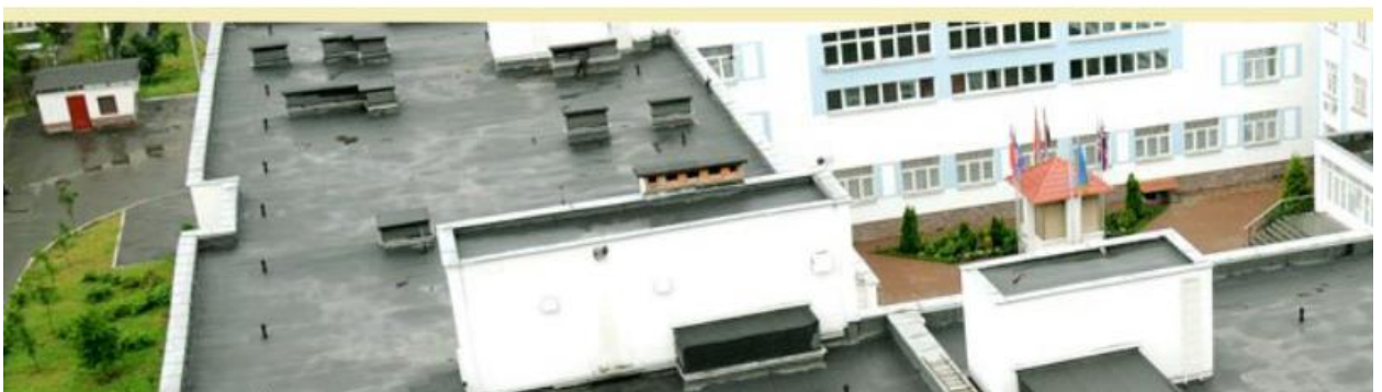
Рис. 2.1. Скандинавська гімназія у м. Києві

ЗАГАЛЬНООСВІТНІЙ НАВЧАЛЬНИЙ ЗАКЛАД I-III СТУПЕНІВ