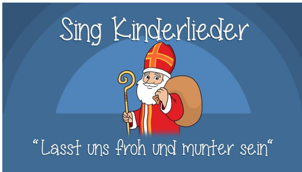
Рис. 3.2. Пісенний матеріал "Lasst uns froh und munter sein - Weihnachtslieder zum Mitsingen"

В цілому, навчальна та виховна робота з німецької мови була проведена на достойному рівні. Використання різних методів та засобів дозволило зробити уроки цікавими та ефективними для учнів, сприяло розвитку мовленнєвих навичок та засвоєнню нового матеріалу. Взаємодія з учнями була конструктивною та позитивною, що сприяло створенню комфортної атмосфери на уроках.