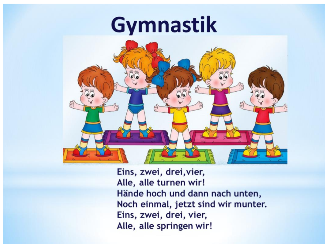
Рис. 3.3. Фізкультхвилинка

Проведення виховної роботи з учнями є важливим компонентом навчально-виховного процесу. Класний керівник, який виконує функції та обов'язки організатора виховної роботи, має важливе завдання допомогти учням розвиватись в цілісні та гармонійні особистості.