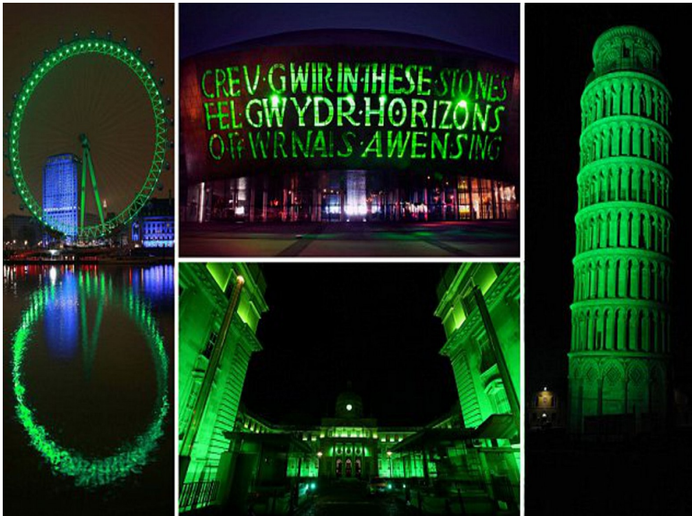
Рис. 3.5. Ілюмінація туристичних пам'яток у рамках Глобальної ініціативи екологічного туризму

Починаючи з 2010 року, в День святого Патріка визначні пам'ятки підсвічують зеленим кольором у рамках «Глобальної ініціативи екологічного туризму» («Global Greening Initiative» та «Going Green for St Patrick's Day») (рис. 3.5). Започаткували цю традицію Оперний театр Сіднея та Скай-Тауер в Окленді, і зараз понад 300 пам'яток у п'ятдесяти країнах світу підсвічують зеленими на день Святого Патріка. [99].