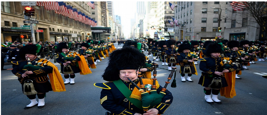
Рис. 3.4. Парад до Дня святого Патріка у Бостоні, США

Спочатку паради Дня святого Патріка почала проводити ірландська громада в Північній Америці у XVIII столітті (рис. 3.4), але згодом ця традиція була підхоплена в Ірландії в XX столітті [99].