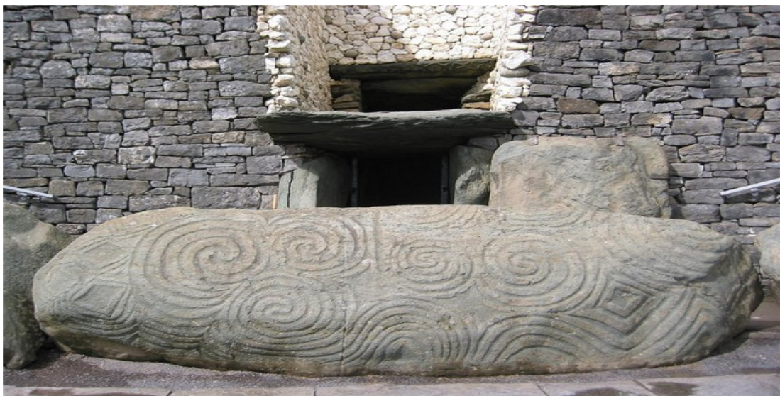
Рис. 2.2. Візерунки на камені біля входу до кургану Ньюгрендж

Курганне поховання Ньюгрендж (ірл. Sí an Bhru ) - одна з найдавніших споруд у Західній Європі антропогенного походження, споруджена приблизно 5000 років тому. Курган був зведений з 200 тис. тонн каміння і землі. Висота його 11 метрів, загальний діаметр близько 79-85 метрів. Він обрамлений 97-ю кам'яними брилами, на багатьох з яких збереглися стародавні візерунки. На камені, розташованому біля входу до кургану також висічені візерунки, значення яких досі є невідомим (рис. 2.2).