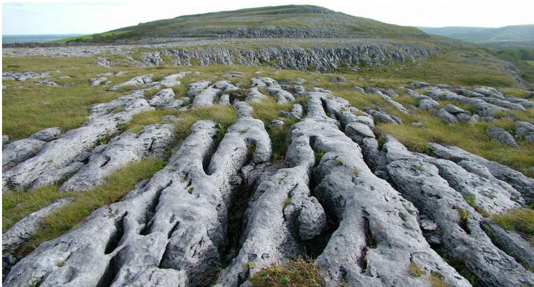
Рис. 2.1. Унікальний ландшафт геопарку Буррен

визначних пам'яток у 2006 році, залучивши майже мільйон відвідувачів (в офіційному туристичному центрі, а додаткові відвідувачі відвідують інші місця); загальна кількість відвідувань зараз становить близько 1,5 млн. щорічно. Починаючи з 2011 року, скелі увійшли до складу геопарку Буррену та скель Мохера (Burren and Cliffs of Moher Geopark), одного з декількох геотуристичних парків Європейської мережі геопарків, а також визнані ЮНЕСКО (рис 2.1). Скелі також є однією з важливих точок на офіційному туристичному маршруті «Дикий Атлантичний Шлях» (Wild Wild Way). На скелях гніздяться 29 видів птахів, які, у свою чергу, є атракцією для орнітологів [44].