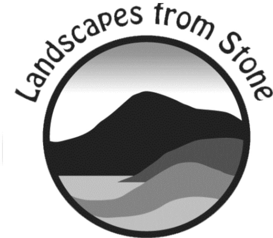
Рис. 3.2. Офіційний логотип «Кам'яних пейзажів»

зрозуміло, що для підвищення обізнаності громадськості про значення ландшафтного туризму як основи для економічного відродження в регіоні буде потрібна конкретна ініціатива щодо брендингу та маркетингу, покликаних залучати відвідувачів до регіону. На ранньому етапі розробки проекту команда розробила концепцію бренду «Кам'яні пейзажі» з наступним логотипом марки (рис.3. 2). Під час етапу формування проекту були проведені переговори з усіма місцевими радами в регіоні для отримання консультацій та підтримки.