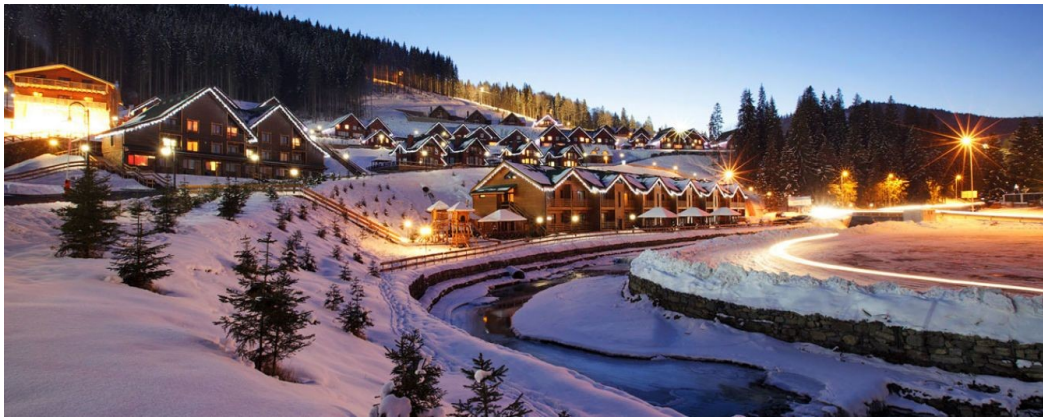
Рисунок 3.1. Гірськолижний курорт «Буковель»

Славське (Львівська область) – це один з перших гірськолижних курортів України, на якому тренується олімпійська збірна. Славське має добре розвинену інфраструктуру, комплекс містить кілька трас європейського значення.