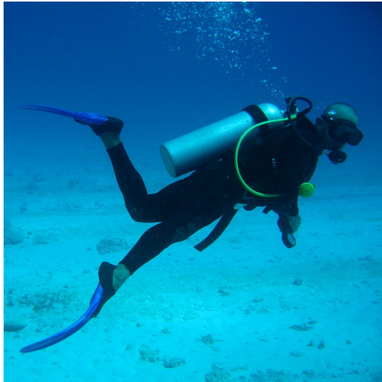
Рисунок 1.4. Дайвер під водою

Найпопулярнішим видом водного туризму є дайвінг. Дайвінг користується популярністю у мешканців всіх країн світу. В більшості, люди віком 30 років займаються дайвінгом. Сьогодні у світі засвідчено майже двадцять мільйонів дайверів-аматорів [25]. Американська статистика вказує на те, що дайвінг займає 22 сходинку за кількістю нещасних випадків на 10 тис. осіб.