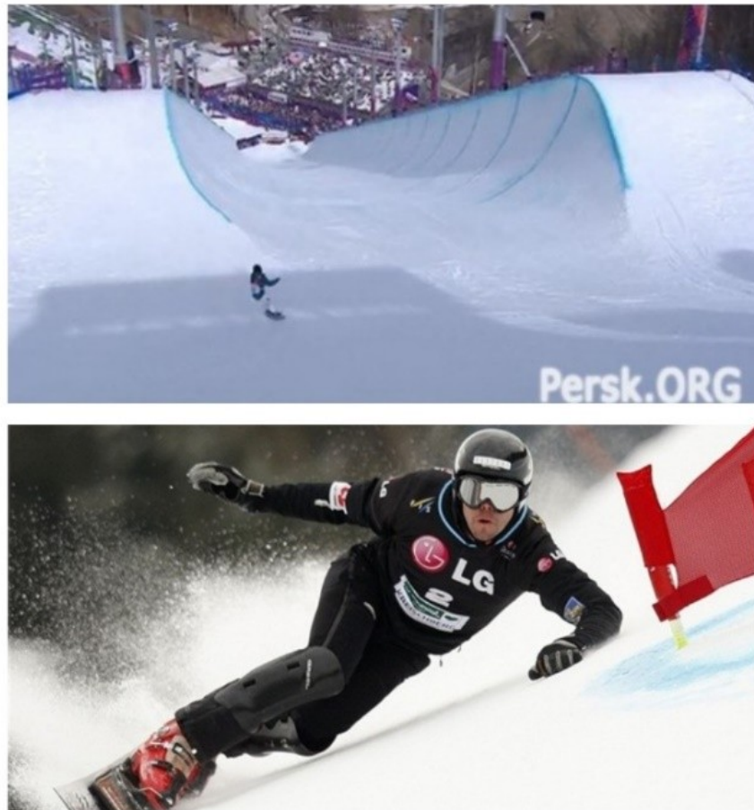
Рис. 1.2. Хаф-пайп і гігантський слалом в сноубордингу

Екстремальний туризм захоплює все більше і більше людей, не дивлячись на різницю у статі чи віку.