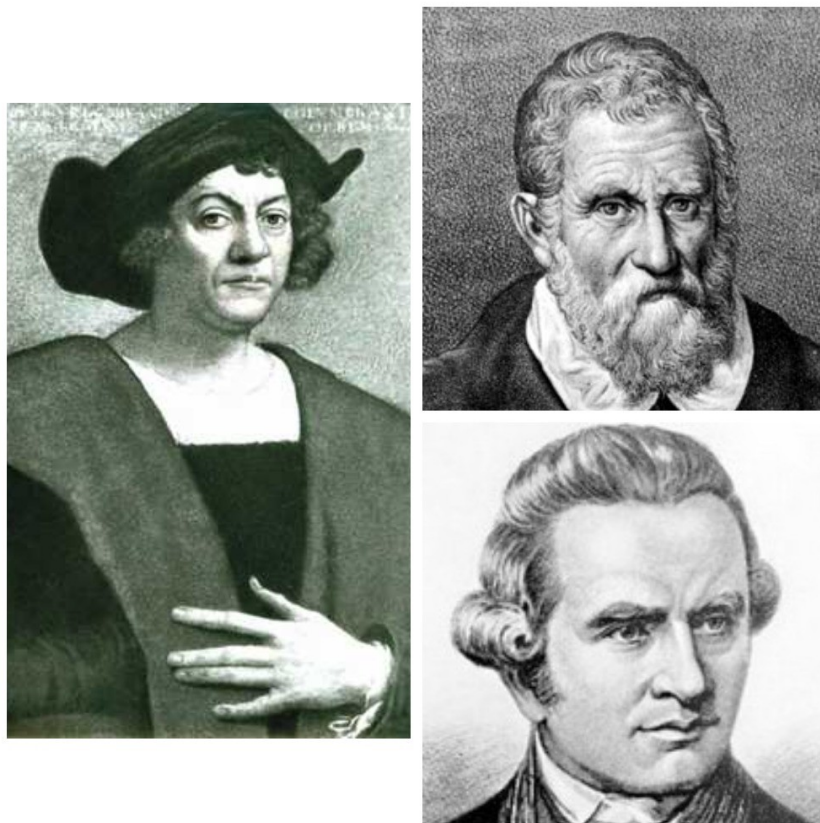
Рис. 1.1. Х. Колумб, М. Поло, Д. Кук

Історично, згідно з даними Всесвітньої організації туризму (UNWTO), пригоди та подорожі були частиною людської історії протягом сотень років. Такі відомі особистості в історії, як Марко Поло, Христофор Колумб та Джеймс Кук, вважаються першими представниками пригодницького туризму, що передували розвитку екстремального.