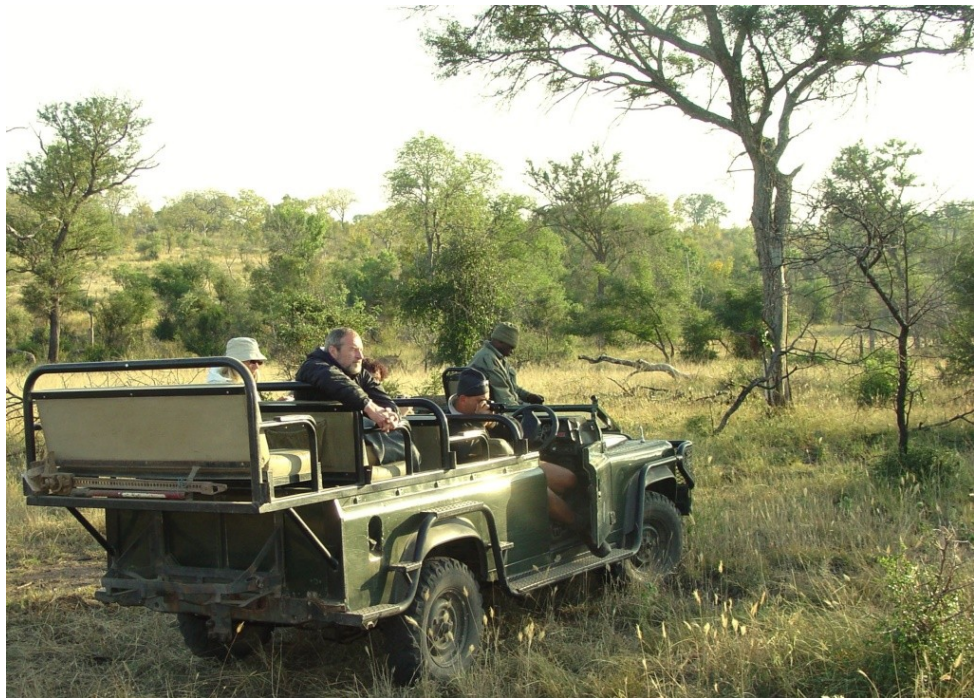
Рисунок 1.9. Сафарі-фотополування в Лімпopo, ПАР.

Сафарі. На батьківщині сафарі мандрівники найчастіше борознять простори національних парків на обладнаних джипах. Поїздки тривають від трьох днів до двох тижнів і довше. В день буває кілька вилазок, оскільки у всіх тварин свій розпорядок. У деяких парках є місця для спостереження за тваринами вночі. Зазвичай же з настанням темряви всі розміщуються в кемпінгах. Сафарі затребуваний заможної публікою є гібридом сафарі і спа. В одній поїздки гірські прогулянки, спілкування з племенами, та спостереження за тваринами, поєднуються з оздоровчими процедурами.