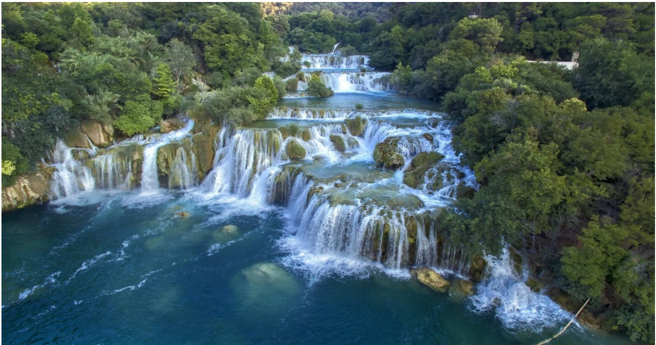
Рисунок 2.2 Хорватія

Хорватія лідирує серед своїх регіональних ровесників через великі ресурси пригодницько-екстремального відпочинку. На думку національної туристичної ради, найпопулярнішими видами такого відпочинку є катання на велосипеді в горах, гірські піші прогулянки, рафтинг та морський каякінг. Завдяки 1200 островів які входять до складу Хорватії, морський каякінг є прекрасним способом познайомитись з країною. Туристи, які користуються байдарками можуть подорожувати на приховані пляжі та затоки, більшість з яких не доступні для транспортування іншим транспортом. Сплави річками дозволяють відчувати адреналін при спуску водоспадами та глибокими каньйонами (Рис. 2.2).