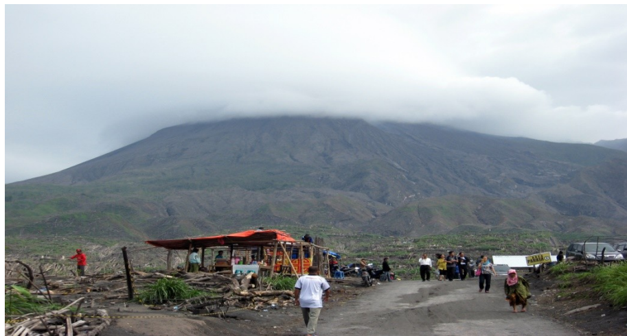
Рисунок 1.10 Туристи на вулкані Мерані (Ява)

Туристична діяльність такого роду піддається критиці, оскільки вона вважається нечутливою, через пропозицію об'єктивувати страждання жертви, наприклад, турист, який відвідує Новий Орлеан після урагану Катріна. Однак катастрофічний туризм може також поєднуватися з волонтерським туризмом: у 2004 р. після Катастрофи Цунамі, замість того, щоб лише оглянути територію та бути учасником екскурсій, туристи також мали змогу допомогти місцевим жителям оговтатися від трагедії. (волонтерство Цунамі)