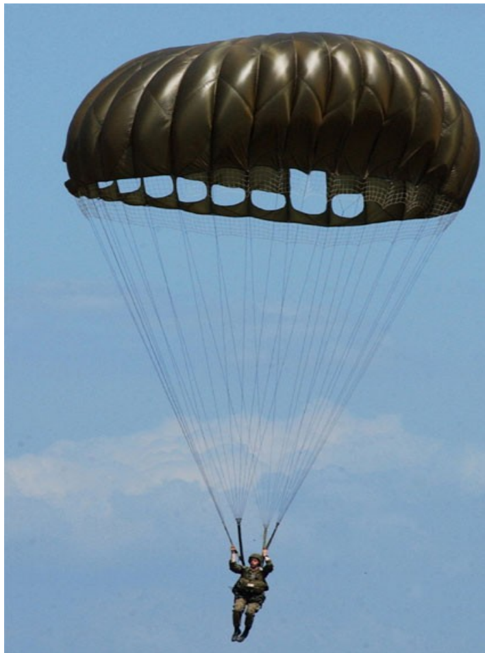
Рисунок 1.6. Парашутист – серія МС1-1С

Класикою парашутизму є дві вправи – стрибки на точність приземлення та комплекс фігур у вільному падінні. Суть першої вправи – треба уразити мішень, чий розмір не є більшим за 3 см. Суть другої вправи – потрібно робити фігури у повітрі, діяльність ведеться на час, і тому це є консервативний спорт з елементами змагання. Самі фігури є такими ж самими вже багато років. Ця вправа потребує великий професіоналізм та майстерність у виконанні (Рис.1.6).