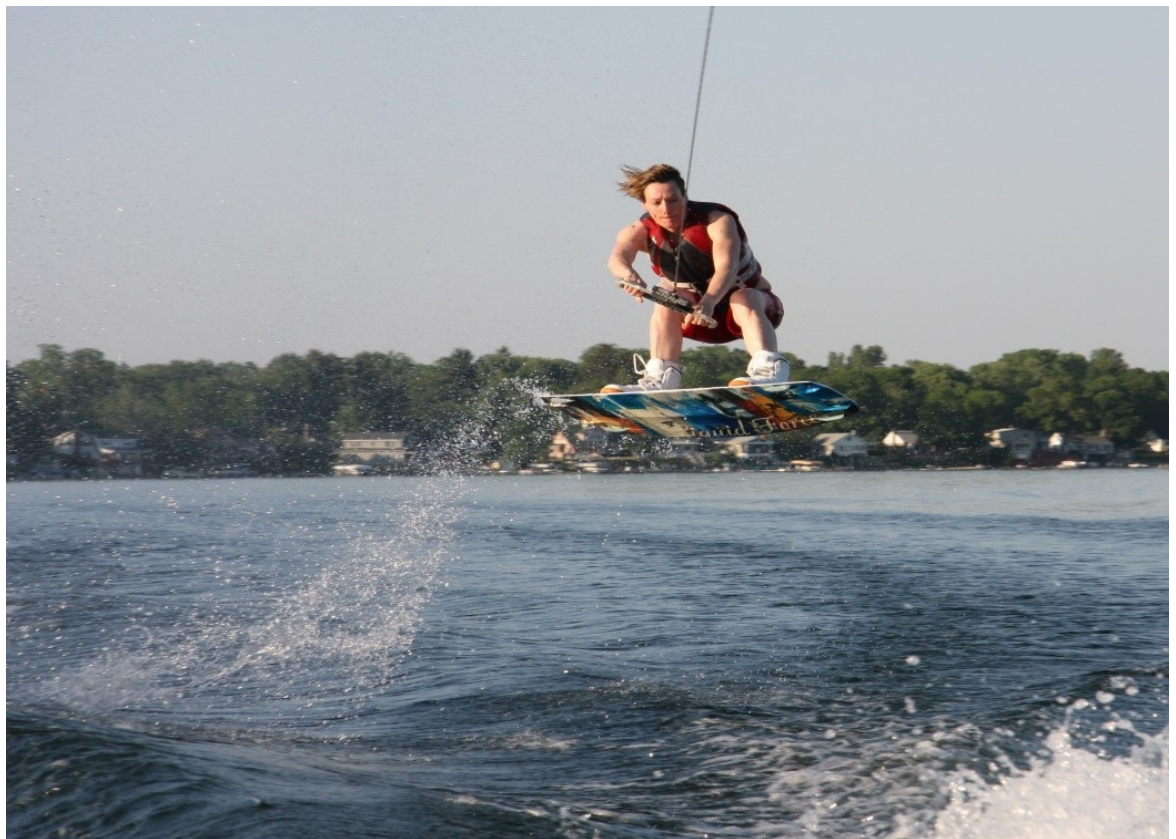
Рисунок 1.5. Процес вейкбордингу

Вейкбординг – вид екстремального спорту, який комбінує в собі елементи водних лиж, сноубордингу, скейтбордингу та серфінгу. Заняття цим спортом відбувається шляхом буксування катером людини, під ногами якої є коротка, широка дошка, приблизно зі швидкістю 30 кілометрів за годину. Хвиля, яка є пост-ефектом від пересування катеру, використовується рейдером як трамплін для виконання різноманітних трюків [11][12][13].