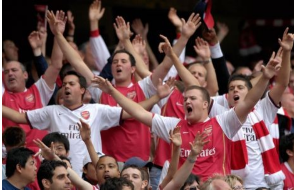
Рис. 2.5. Фанати футбольного клубу «Arsenal»

футбольної атрибутики, суперечки в барах), особливо в таких «гарячих», з цієї точки зору, країнах, як Італія, Іспанія або Великобританія. Зокрема, в Лондоні продається спеціальна карта для туристів, де вказані райони проживання прихильників того чи іншого клубу (Рис. 2.5).