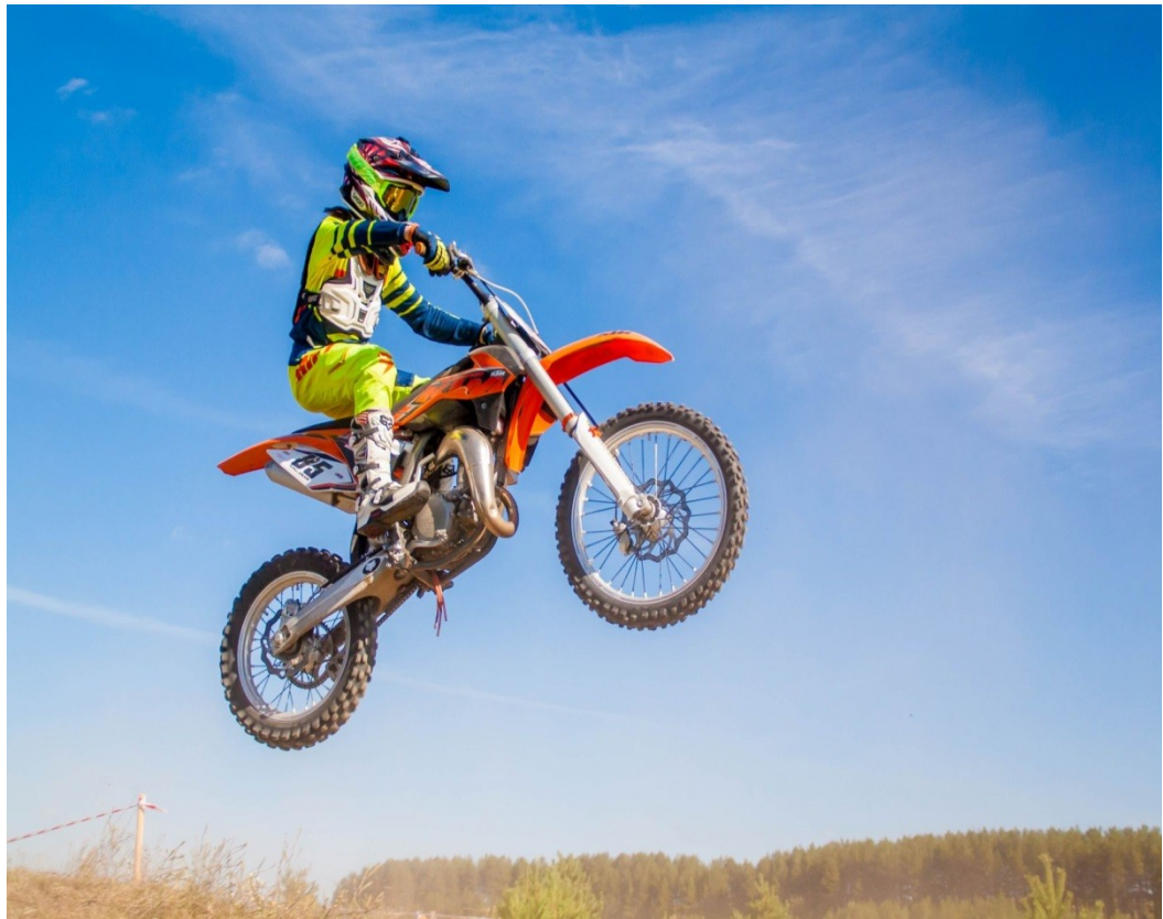
Рисунок 1.3. Мотоспорт

Мотоспорт – це спорт, в якому беруть участь автомобілі, такі як автомобілі та катери. Мотоспорт часто бере участь у гоночних змаганнях, таких як F1 та Moto GP. Ще один приклад у водних видах спорту – водний спорт та вейкбординг. Крім того, у повітряних видах спорту є повітряні перегони та пілотаж.