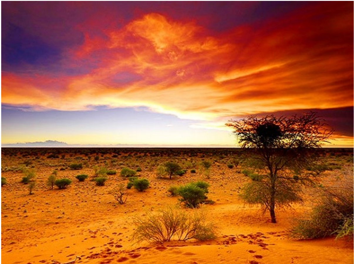
Рисунок 2.1. Ботсвана.

забезпечення охорони цілісності природної екосистеми, держава працює за стратегією високої вартості на туризм і мінімалізації впливу на навколишнє середовище. Крім цього, національні агентства розширюють фокус для відвідувачів за межами тих областей, через які вони зараз відомі.