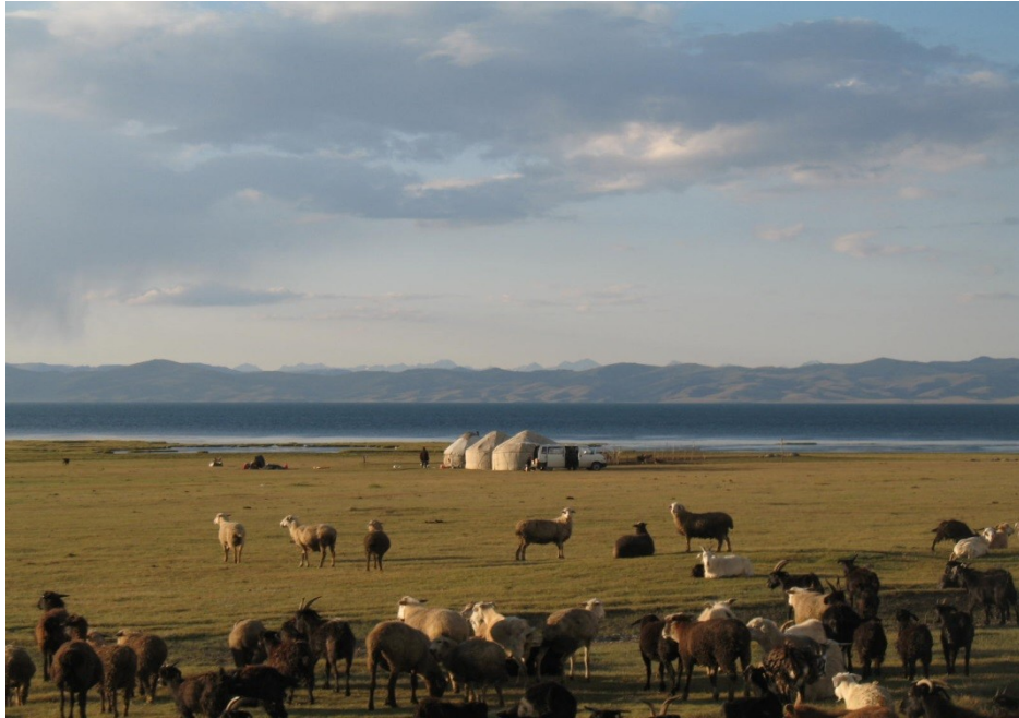
Рисунок 1.7 Джайлоо на озері Сонг-Куль в Киргизстані

Цей захоплюючий вид туризму успішно розвивається на високогірних пасовищах Киргизстану. Прекрасна можливість відпочити від великого міста. Можна вважати, що джайлоо туризм є підтипом етнічного туризму , під час якого людина знайомиться та контактує з етнічними народами на екзотичних територіях. Прикладами таких турів також є Аборигенський тур в Австралії або тур до племені Даяків, яке живе в дощових лісах Калімантану.