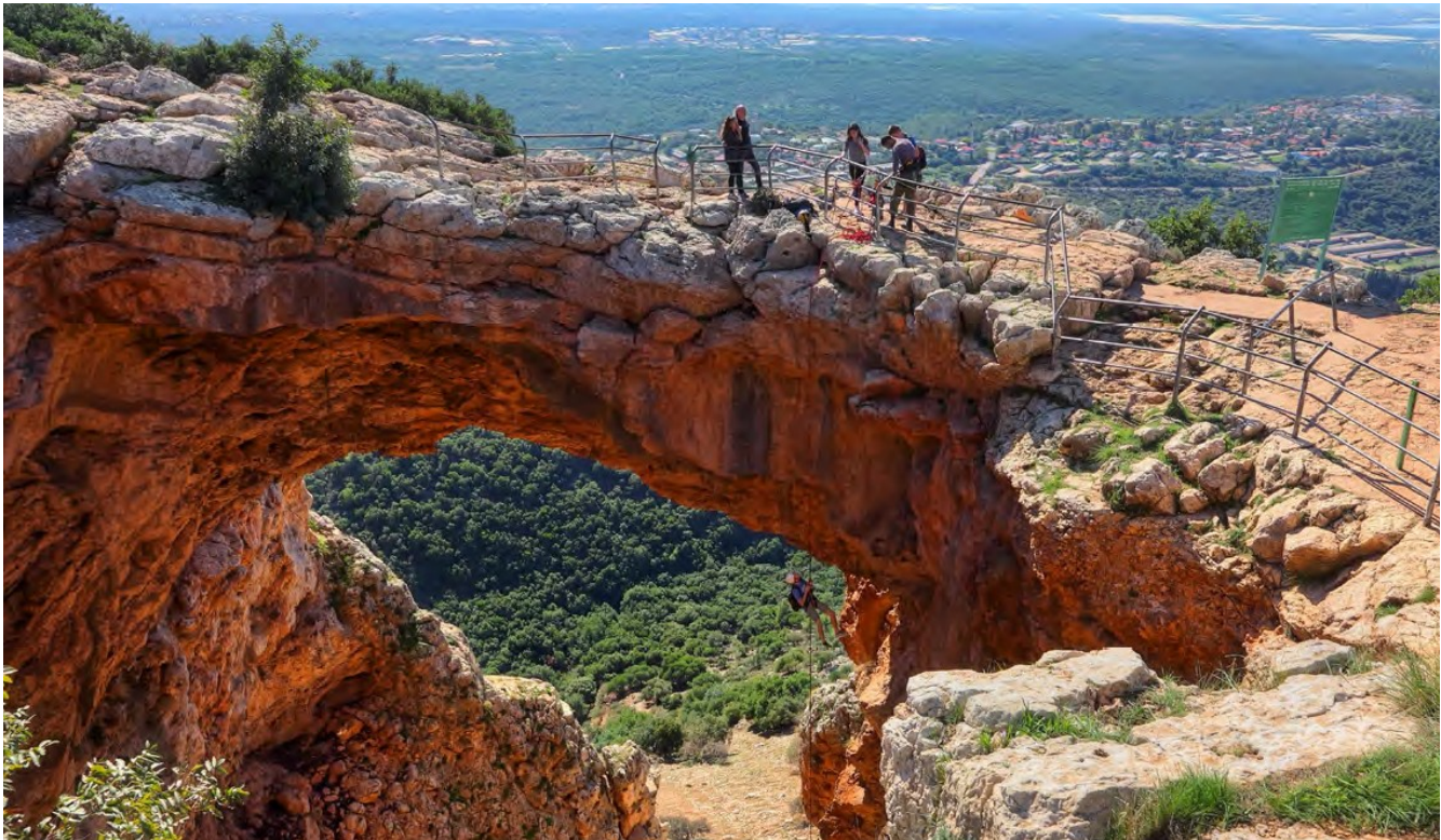
Рисунок 2.3 Ізраїль

можуть отримати від уряду компенсацію за поїздку на міжнародну конференцію або проведення поїздок ознайомлення.