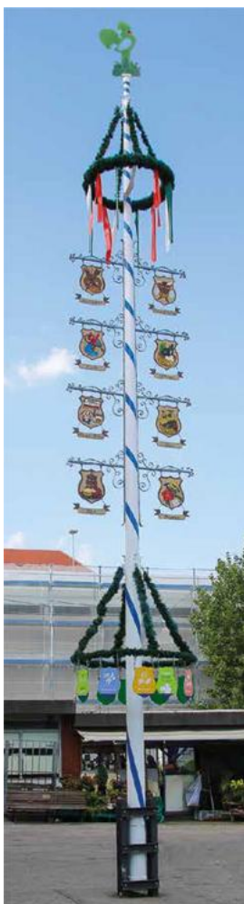
Pulverbeschichtet mit Wendelung

Ergänzen Sie den Text durch die unten angegebenen Wörter