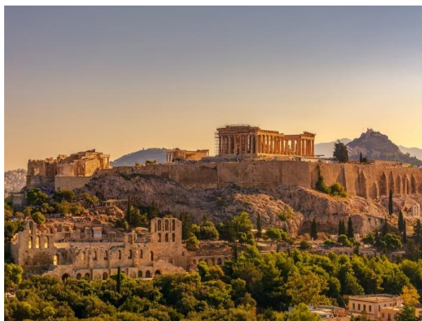
Рис. В.1. Афі́нський Акрополь