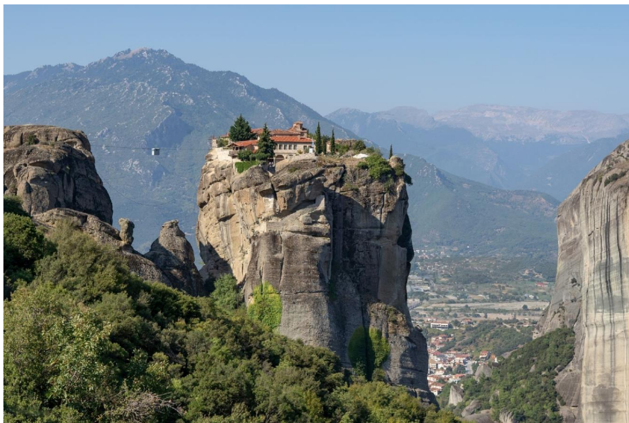
Рис. Д.1. Монастирі Метеора