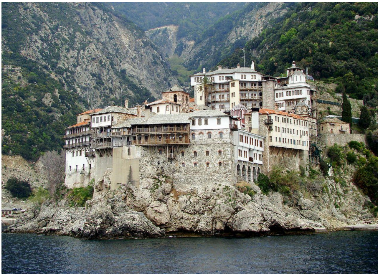
Рис. Д.2. Афон