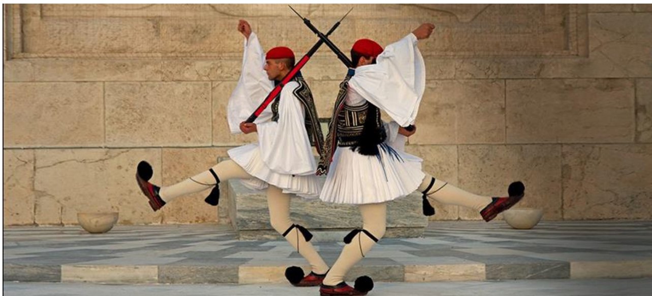
Рис. Г.1. Ритуал зміни почесної варті елітної гвардії