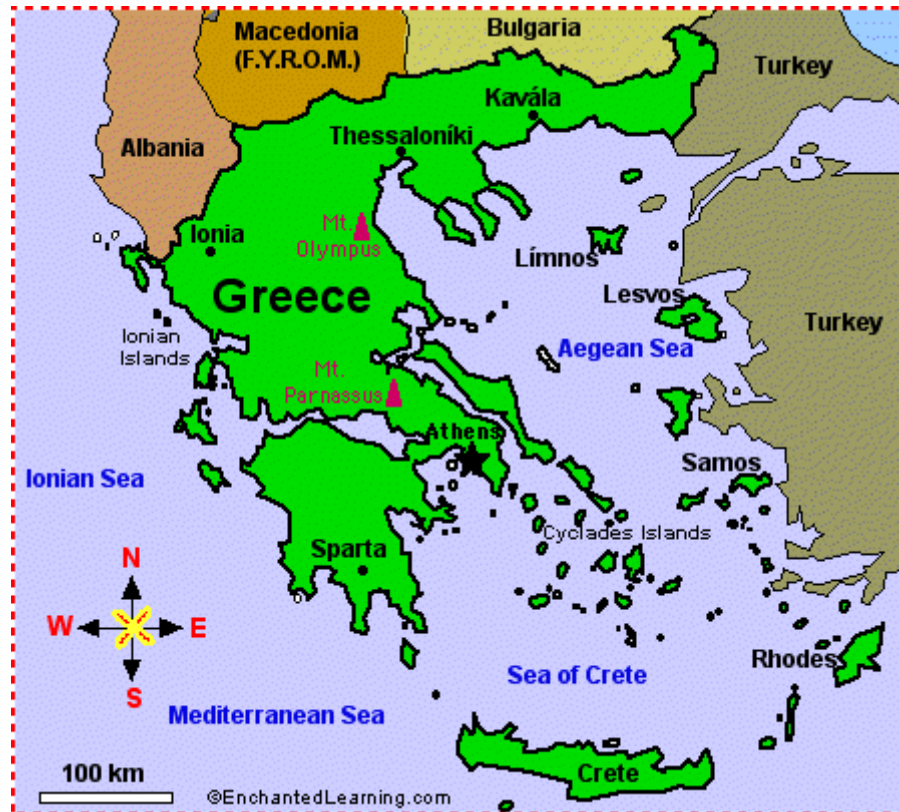
Рис. А.1. Карта Греції