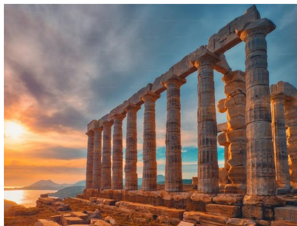
Рис. В.2. Парфенон