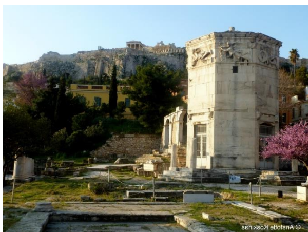
Рис. В.5. Ерехтейон