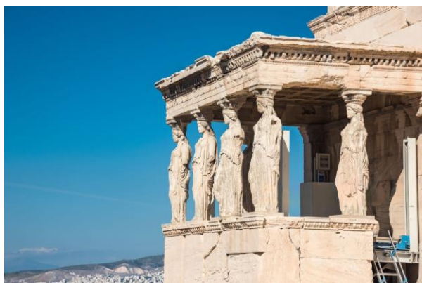
Рис. В.3. Храм Ніки