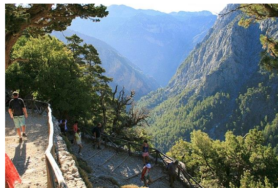
Рис. Б.4. Заповідник Самарія (Білі Гори)