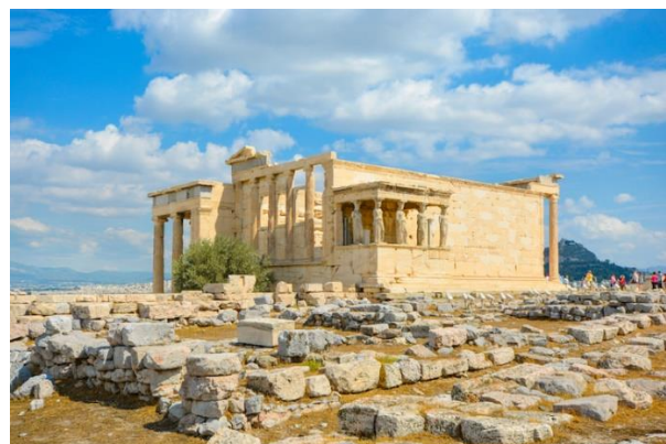
Рис. В.4. Ерехтейон