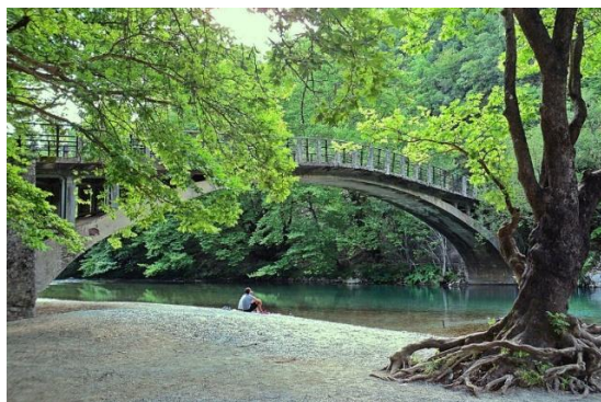
Рис. Б.3. Заповідник Вікос-Аоос