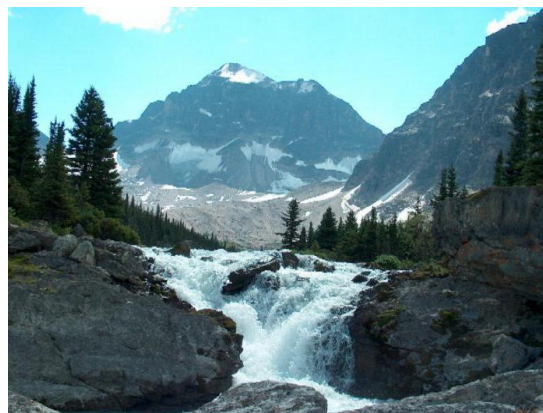
Рис. Б.1. Заповідник Олімпу