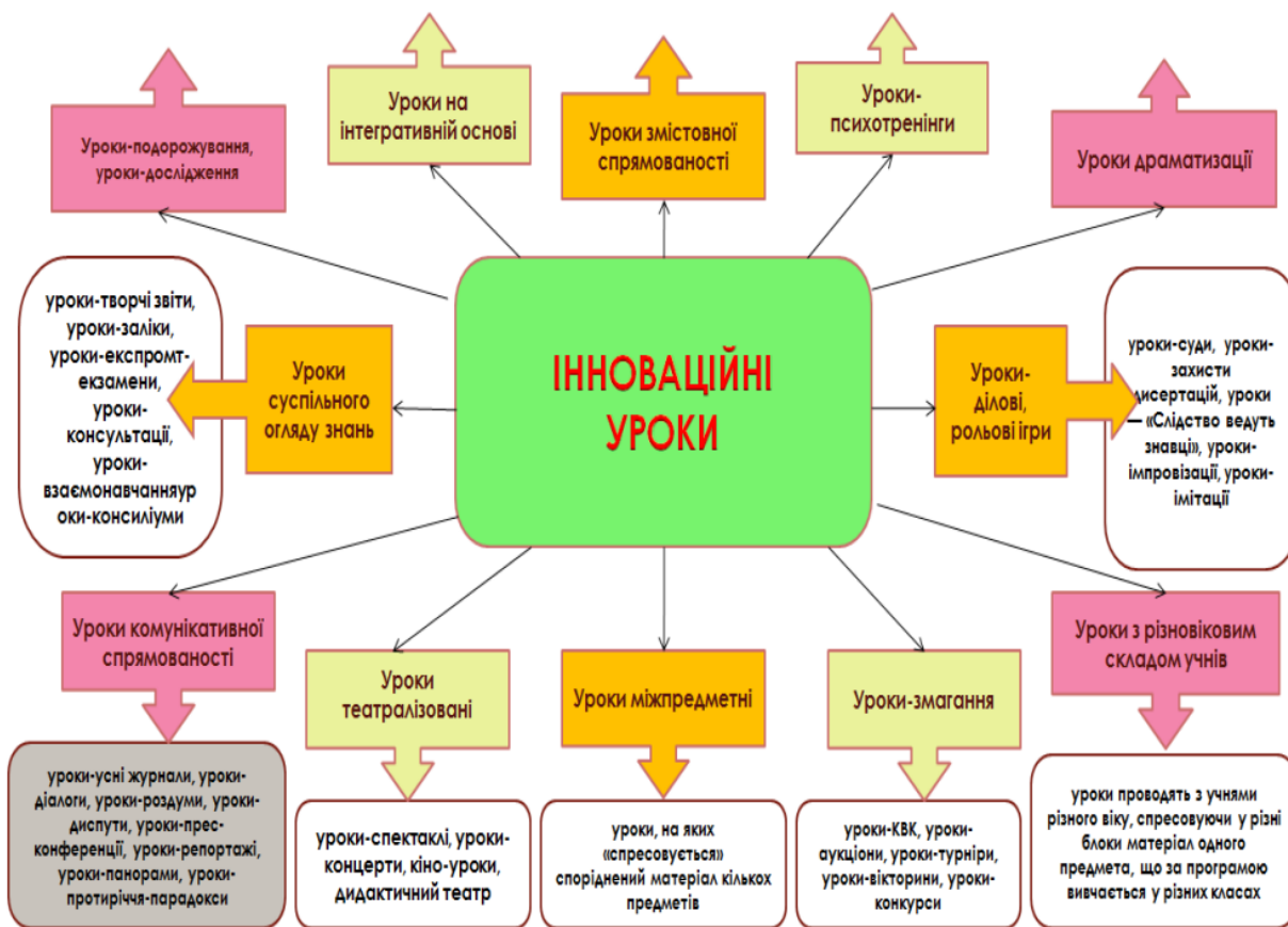
Рис.1. Умовна класифікація інноваційних уроків

О. Митник та В. Шпак наголошують, що інноваційний урок виникає завдяки нетрадиційній педагогічній теорії, уважному самоаналізу діяльності вчителя, передбаченню перебігу тих процесів, що відбуваються на уроці, а головне – завдяки відсутності штампів у педагогічній технології (1997). Кизименко (2018, с. ) пропонує умовну класифікацію інноваційних уроків (див. рис.1):