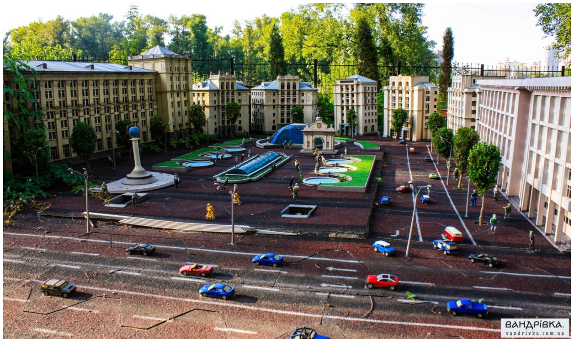
(Рис. 2.2. Парк Україна в мініатюрі. )

Парк також пропонує безліч розваг для гостей: оригінальні театралізовані вистави, виступи кіннотрюкового театру, а також концерти кращих музичних колективів, що виконують середньовічну і етнічну музику. Щорічно в парку проводяться 46 міжнародних культурно-історичних фестивалів та чемпіонатів з давніх видів спорту.