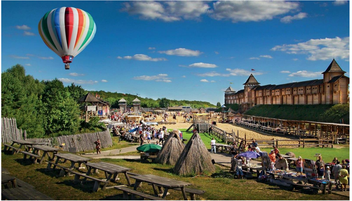
(Рис. 2.1. Парк Київська Русь. URL: https://otdyhaem.com.ua/wp-content/uploads/2022/08/parkkyivrus2.jpg )

Першим тематичним парком на державному рівні в Україні можна вважати туристичний центр "Парк Київська Русь", що розташований у селі Копачів Обухівського району, за 34 кілометри від Києва (Офіційний сайт «Парку Київська Русь». 2019. URL: http://www.parkkyivrus.com ). Цей центр виступає як унікальний туристичний об'єкт та майданчик для наукового та культурного розвитку. Колектив "Парку Київська Русь" спільно з провідними фахівцями у галузі історії, архітектури, етнографії та культурології з різних країн відтворює архітектурний образ середньовічного міста – Дитинця Києва V-XIII століть, що займав площу 10 гектарів (Офіційний сайт «Парку Київська Русь». 2019. URL: http://www.parkkyivrus.com ).