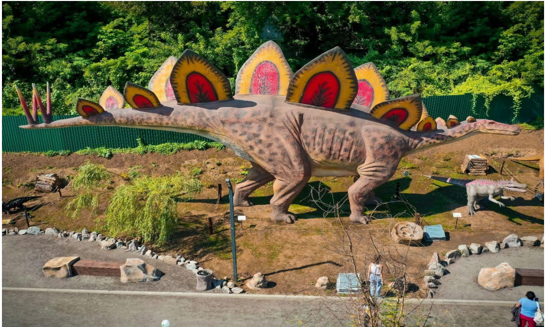
(Рис. 2.5. DinoSofia парк. URL: https://static.tildacdn.one/tild3363-3961-4462-a436-613638666639/03.jpg )

У Черкаській області працюють два динопарки - у місті Черкаси та місті Умань. Динопарк у обласному центрі (відкрито 21.07.2021) розташований на території парку "Перемоги", неподалік від зоопарку.