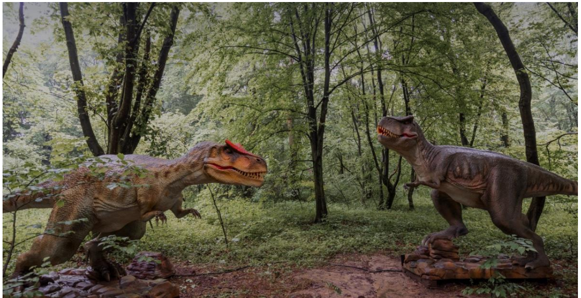
(Рис. 2.3. Уруру парк.

)