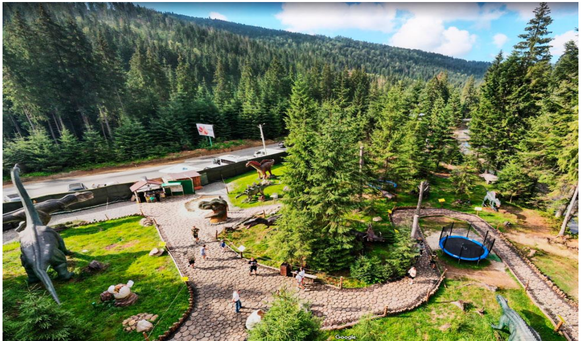
(Рис. 2.3. Дінопарк Поляниця. URL: https://chillax.com.ua/wp-content/uploads/2023/08/park-dinozavrov-1.jpg )

Першим стаціонарним парком динозаврів в Україні стало місце, відкрите у грудні 2019 року в селі Поляниця Яремчанської міської ради, поруч з гірськолижним курортом "Буковель". Зазвичай такі виставки динозаврів розміщуються в обласних центрах, а тематичні дінопарки більшого масштабу можна знайти в туристично-рекреаційних центрах, наприклад, у "Буковелі", селі Старе Село та на Гідропарку у місті Києві. Мережа таких парків значно розширюється в Україні з кожним роком. У 2020 році, незважаючи на пандемію, було відкрито вісім об'єктів подібного типу.