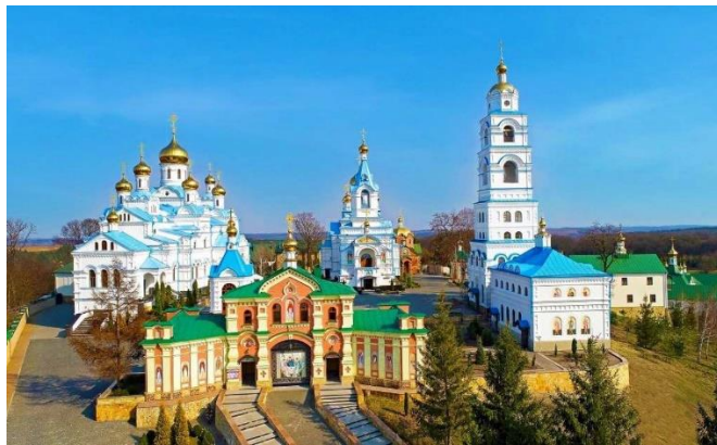
Рис. 1. Свято-Духівський монастир

світу. Харцизький Свято-Духівський монастир(рис.1) - це одна з найстаріших святинь на сході України, заснована у XI столітті. Вона відома своєю давньою історією та святими образами. Свято-Успенська Почаївська Лавра(рис.2) - це одна з найбільших православних святинь у Східній Європі, яка привертає паломників з-за кордону. Вона славиться своєю архітектурою, а також мощами святих та іконами. Софіївський Собор(рис.3) в Києві - це історична святиня, яка була заснована у XI столітті та є символом давнього культурного та релігійного спадку України. Криворізький Свято-Покровський монастир - це велика православна святиня, заснована у XVIII столітті.