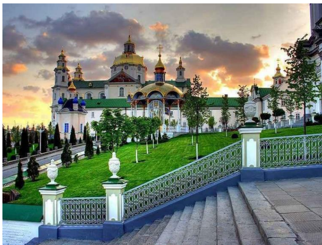
Рис. 2. Свято-Успенська Почаївська Лавра ( tobm.org.ua . URL: https://tobm.org.ua/svyato-uspenska-pochayivska-lavra/ )