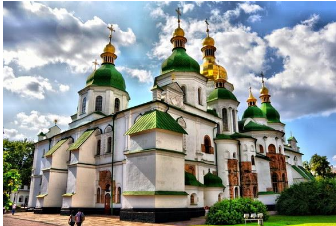
Рис. 3. Софіївський Собор ( conciiergegroup.org . URL:

https://conciiergegroup.org/ukr/sobor-svytoi-sofii/ )