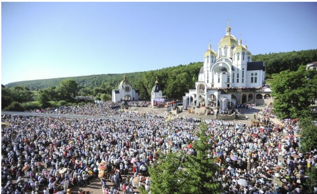
Паломництво до Зарваниці