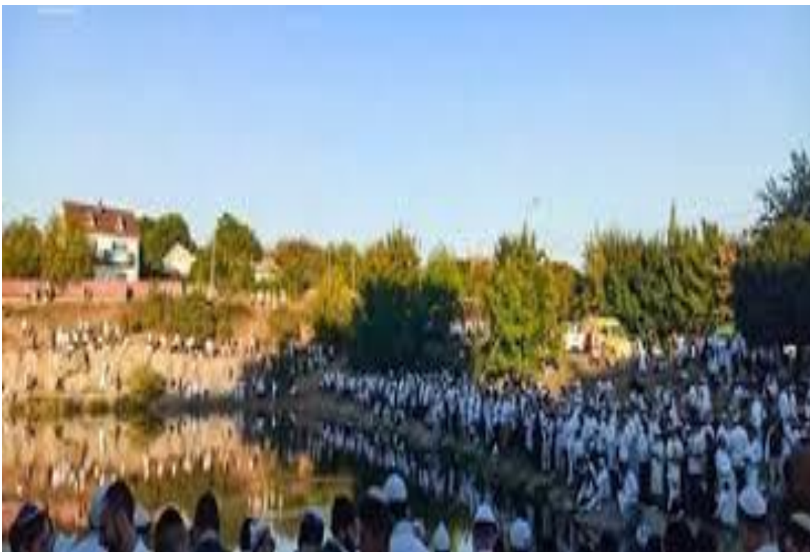
Паломництво до Умані