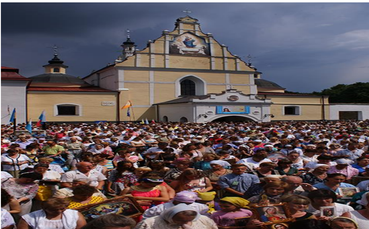
Паломництво до Летичіва