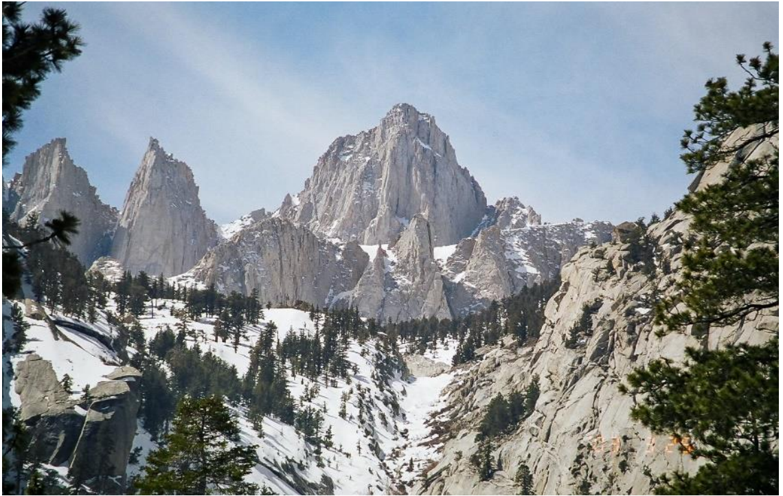
Рис. А. 3 Сьерра-Невада [14]