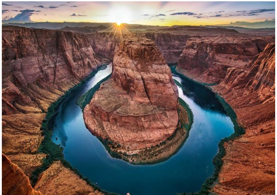
Рис. Б. 1 Гранд Каньйон [15]