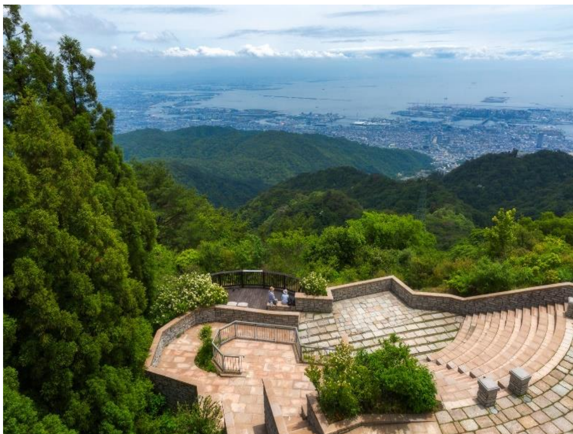
Рис А. 2 Роккі [14]