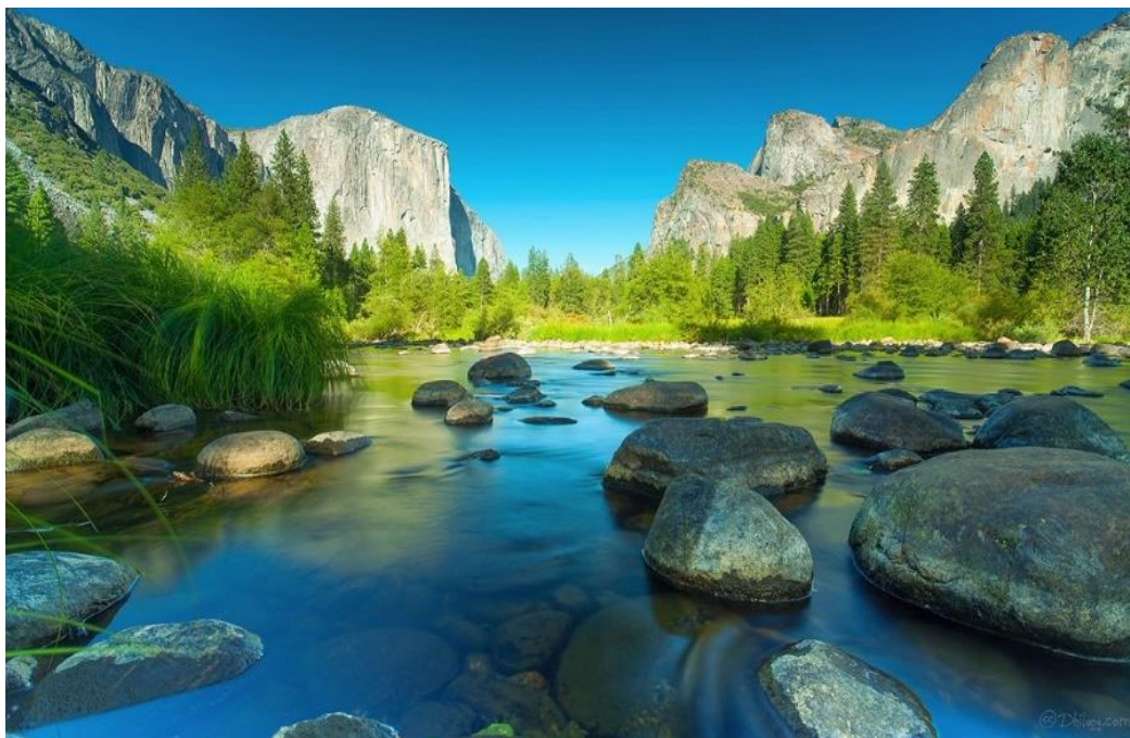
Рис. Б. 2 Йосеміті [15]