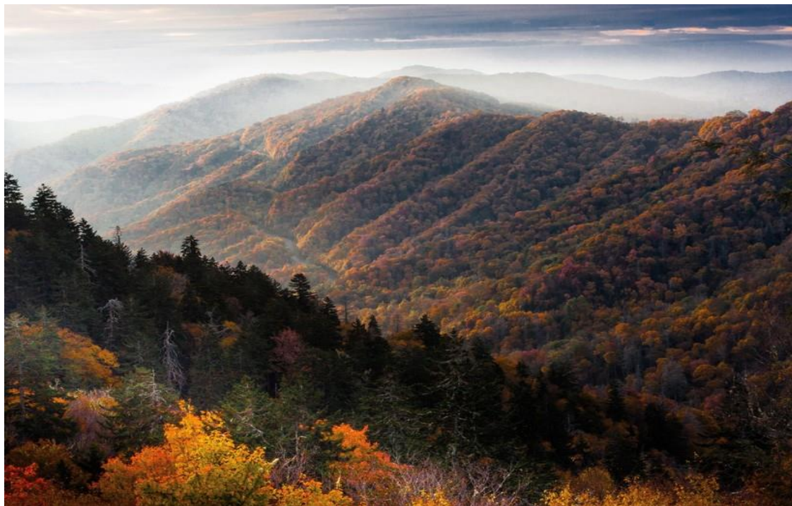
Рис. А. 1 Апалачі [14]