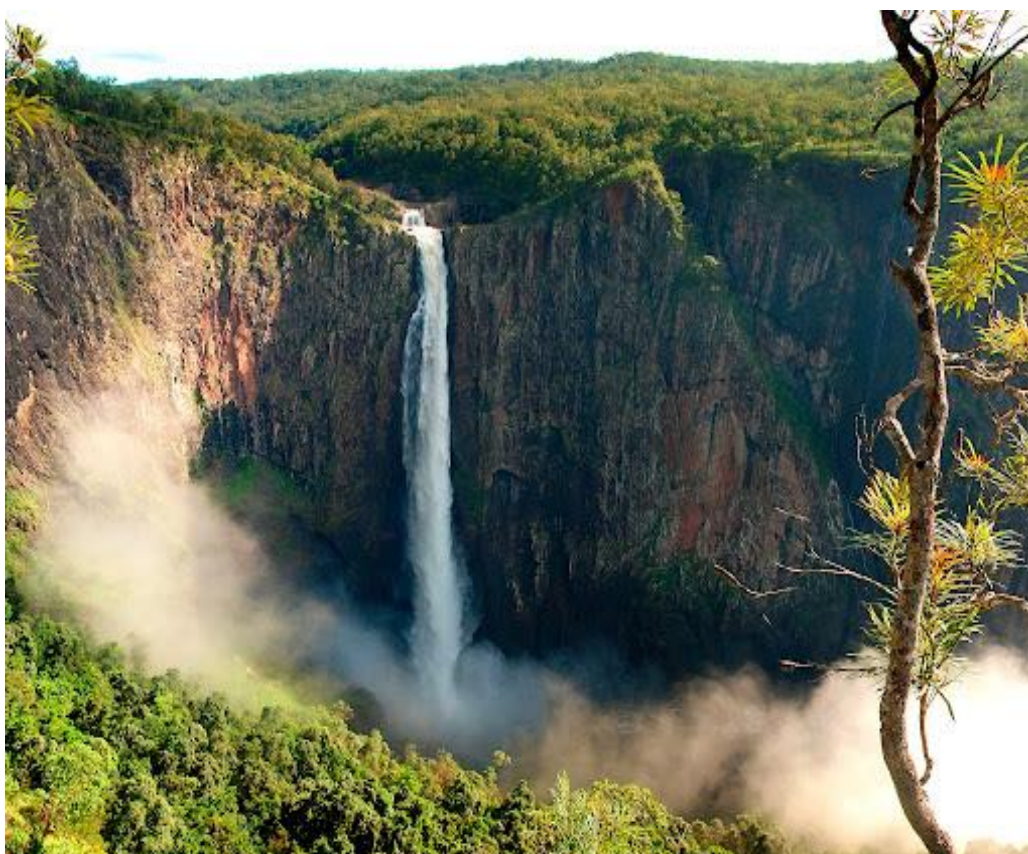
Рис. Б. 3 Блакитні гори [15]