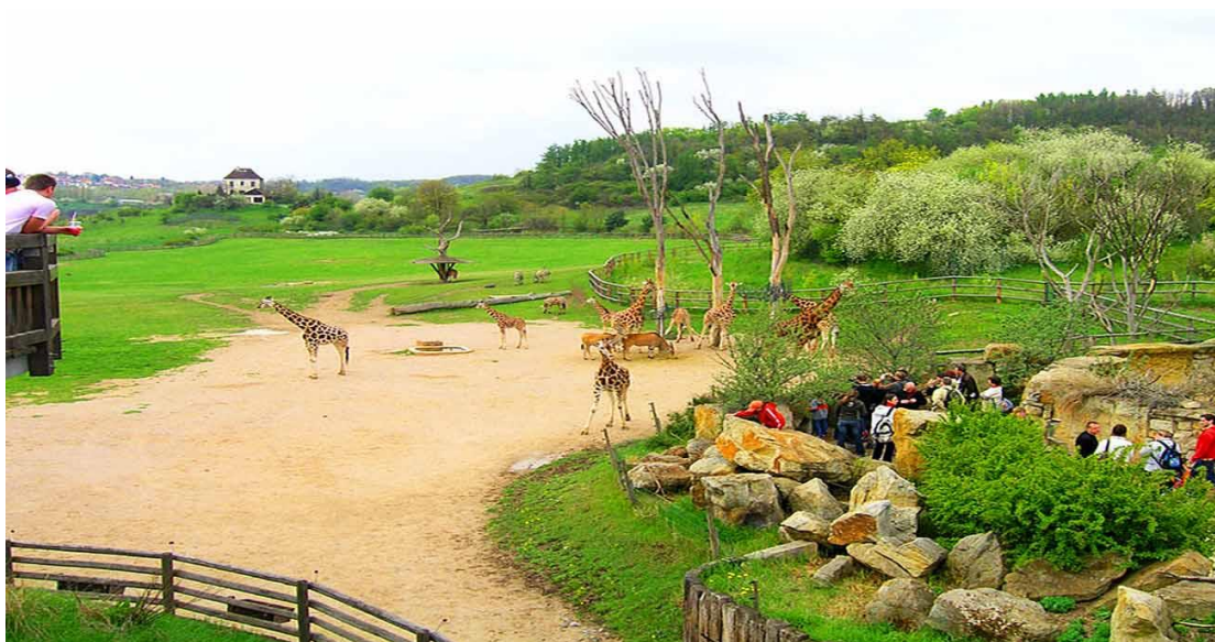
Празький зоопарк в Чехії