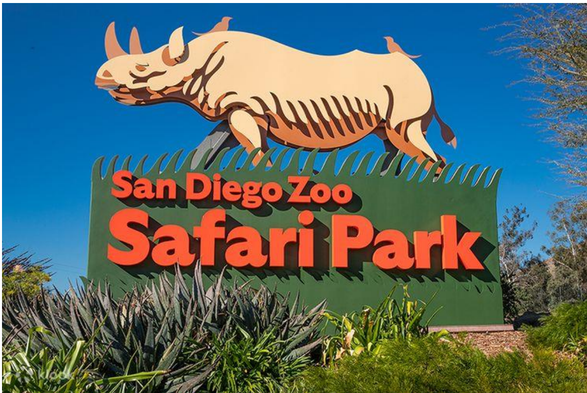
Зоопарк «San Diego Zoo» в Каліфорнії