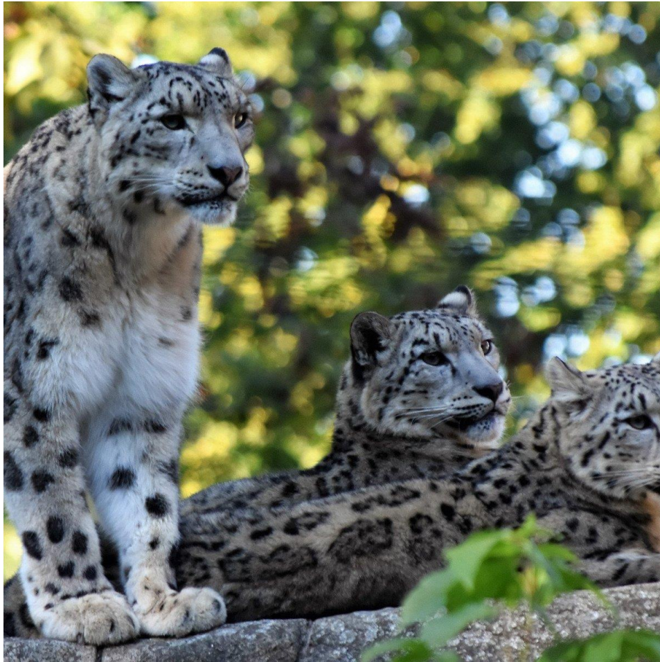
Зоопарк «Zoo Basel» в Швейцарії