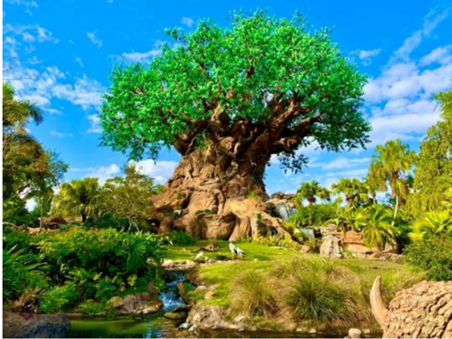
Зоопарк «Королівство Тварин» в США