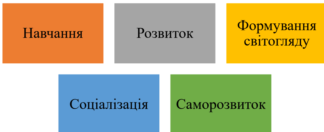
Рис. 1.1. Елементи виховання

Виховання – це цілеспрямований процес формування особистості, який включає в себе (рис.1.1.).