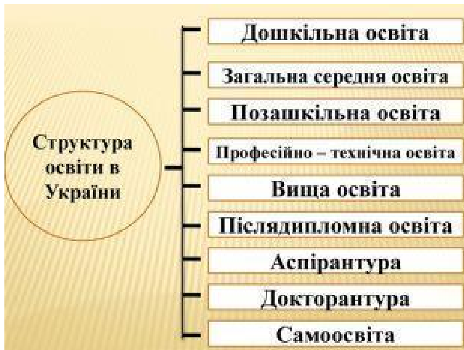
Рис. 1.1 Структура освітньої системи України (авт.-укл. Т. О. Дороніна, 2018, с. 55)

Структура освітньої системи України поділяється на декілька ключових рівнів: дошкільна, початкова, базова середня, старша середня, професійно-технічна, вища освіта та післядипломна освіта. Освіта спрямована на розвиток фізичних, психологічних та соціальних навичок дитини, підготовку її до шкільного навчання. В Україні функціонує мережа дошкільних навчальних закладів, які можуть бути як державними, так і приватними.