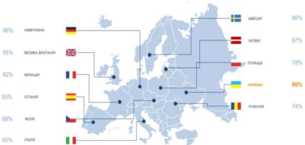
Imagen 1.2. La cobertura de Internet en los países europeos.

El creciente nivel de cobertura de Internet es extremadamente importante en el mundo actual. Abre muchas oportunidades de acceso a la información, la educación y la comunicación. Proporcionar un acceso generalizado a Internet contribuye al desarrollo económico, mejora la educación y aumenta las oportunidades de negocio e interacción humana. Los altos niveles de cobertura de Internet también contribuyen a reducir la brecha digital y ayudan a garantizar el acceso a los servicios digitales a todos los segmentos de la población. Así pues, ampliar el acceso a Internet es esencial para el desarrollo de la sociedad, mejorando la calidad de vida y creando condiciones equitativas para todos.