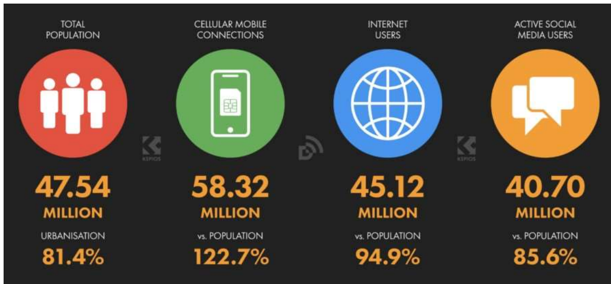
Imagen 1.1 La audiencia de internautas en España [8].

Según fuentes como GWI y data.ai, en enero de 2023 había 40,70 millones de usuarios de redes sociales en España. Esta cifra equivale al 85,6% de la población, aunque hay que tener en cuenta que no todos los perfiles corresponden a individuos únicos ni todas las plataformas registran su uso de la misma manera. GWI ha realizado un estudio anual sobre las tendencias de Internet que, entre otras cosas, examina cuánto tiempo pasa la gente en línea, qué sitios visita, qué aplicaciones utiliza y qué contenidos consume. En la imagen 1.1 se pueden ver las estadísticas de uso de Internet en el país.