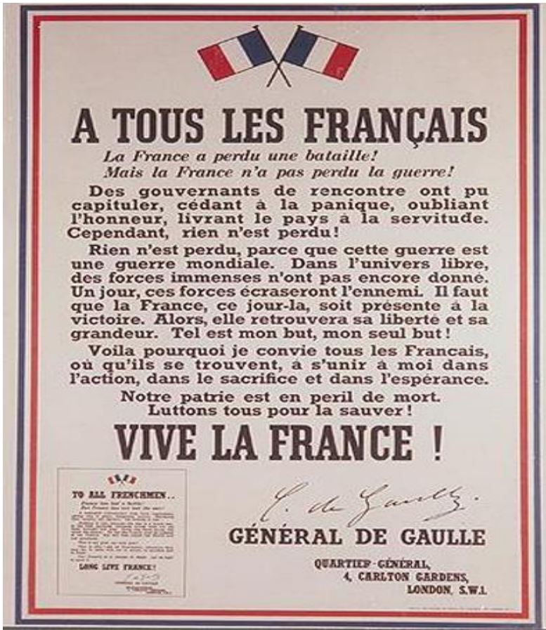
[Affiche ayant suivi l'appel du 18 juin 1940 du général de Gaulle]