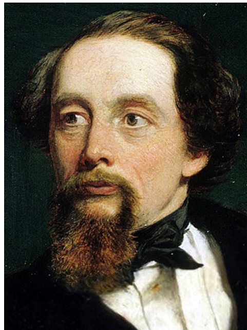
Рисунок 1.1 Чарлз Діккенс

Чарлз Діккенс (1812-1870), великий англійський письменник, є передовиком гуманістичної традиції в англійській літературі (Рис.1.1). Народившись у 1812 році в Портсмуті в родині чиновника морського відомства, Чарлз не мав класичної освіти, але протягом усього життя самовдосконалювався.