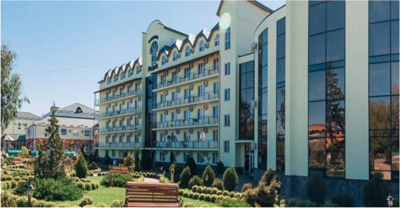
Рис. 3.3 Бальнеологічний курорт Хмільник