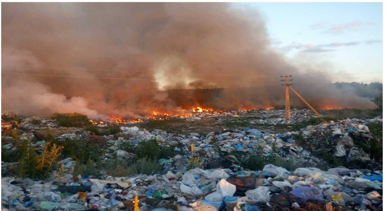
Рис. 3.6 Аварійно-небезпечне звалище на околиці Львова