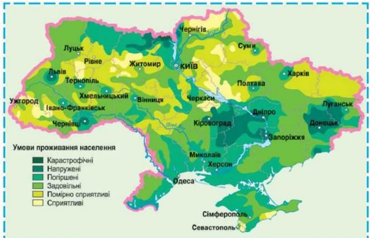
Рис 3.7 Умови проживання населення у зв'язку з екологічною ситуацією