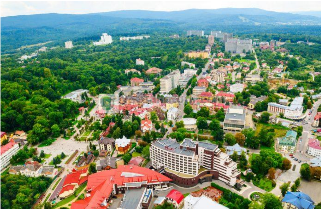
Рис. 3.1 Бальнеологічний курорт Трускавець