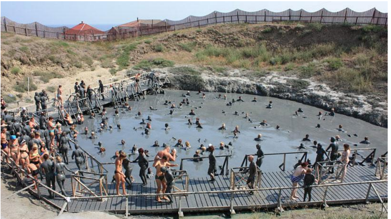
Рис. 3.2 Грязелікувальний санаторій Черче