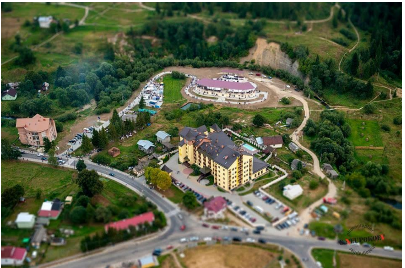
Рис. 3.4 Бальнеологічний курорт Східниця