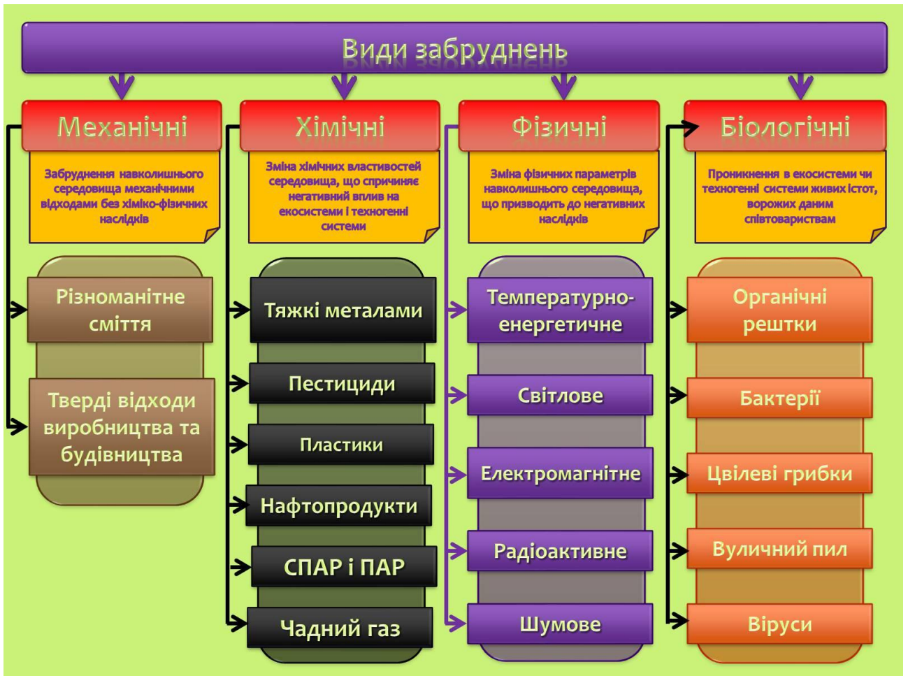
Рис. 3.5 Основні види забруднення навколишнього середовища