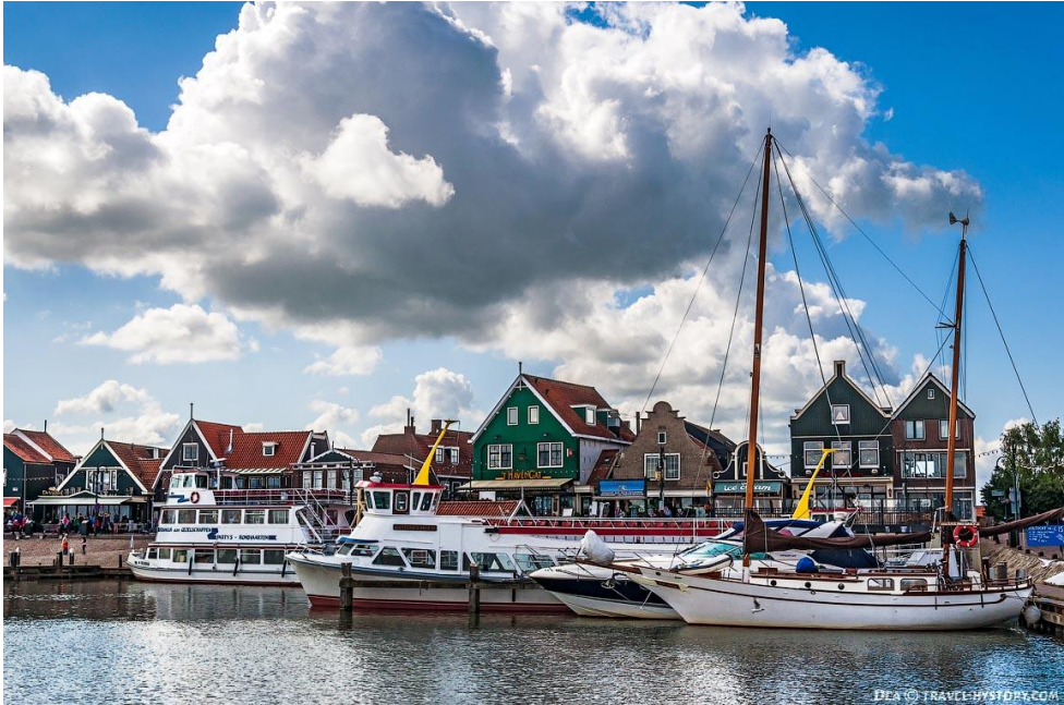
Рис. Б.2. Селище Волендам [52]