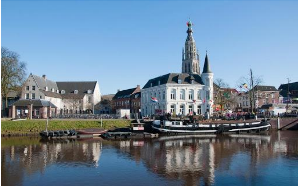
Рис. Р.1. Місто Бреда [67]