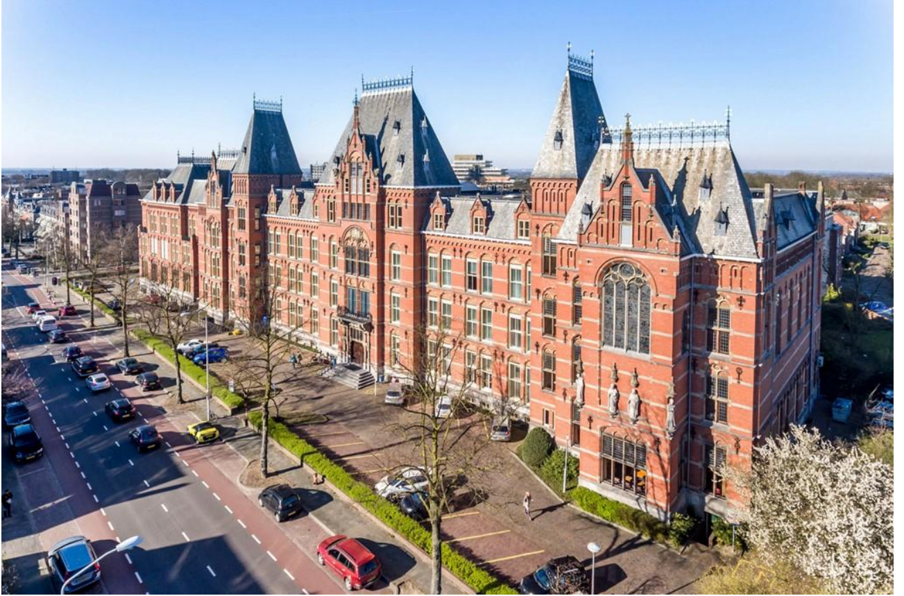
Рис. Г.1. Місто Неймеген [54]