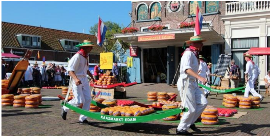
Рис. Н.1. Фестиваль сиру у місті Едам [66]