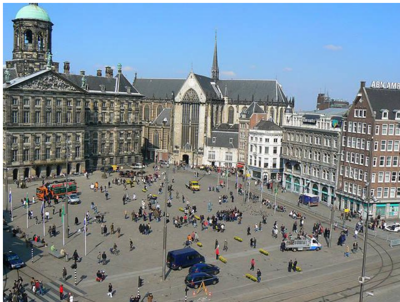
Рис. О.2. Площа Дам