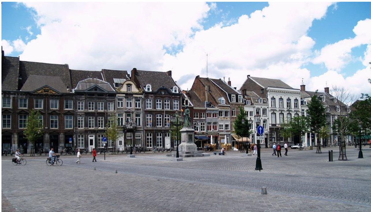
Рис. Ж.1 Місто Маастрихт [57]