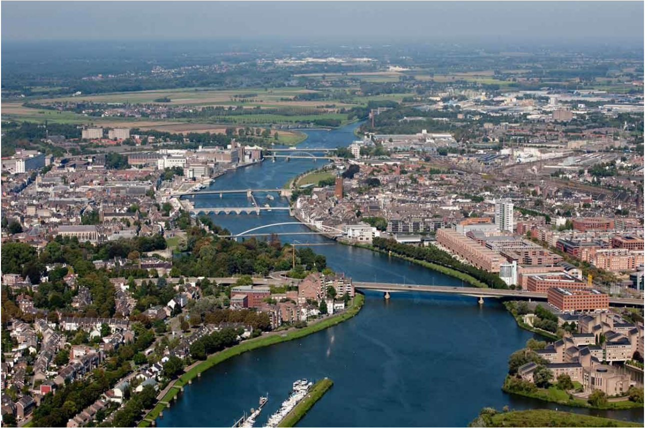
Рис. Ж.3. Місто Маастрихт [59]