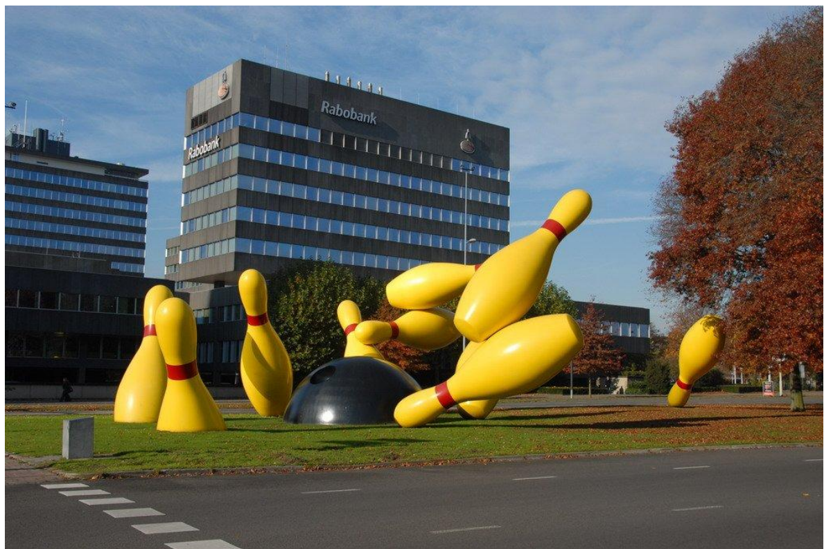
Рис. М.2. Місто Ейндховен [65]