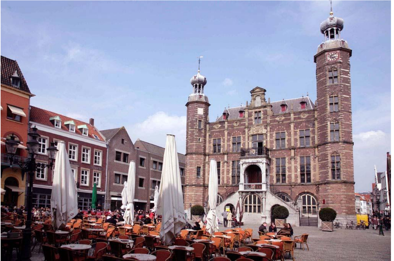
Рис. В.1. Місто Венло[53]