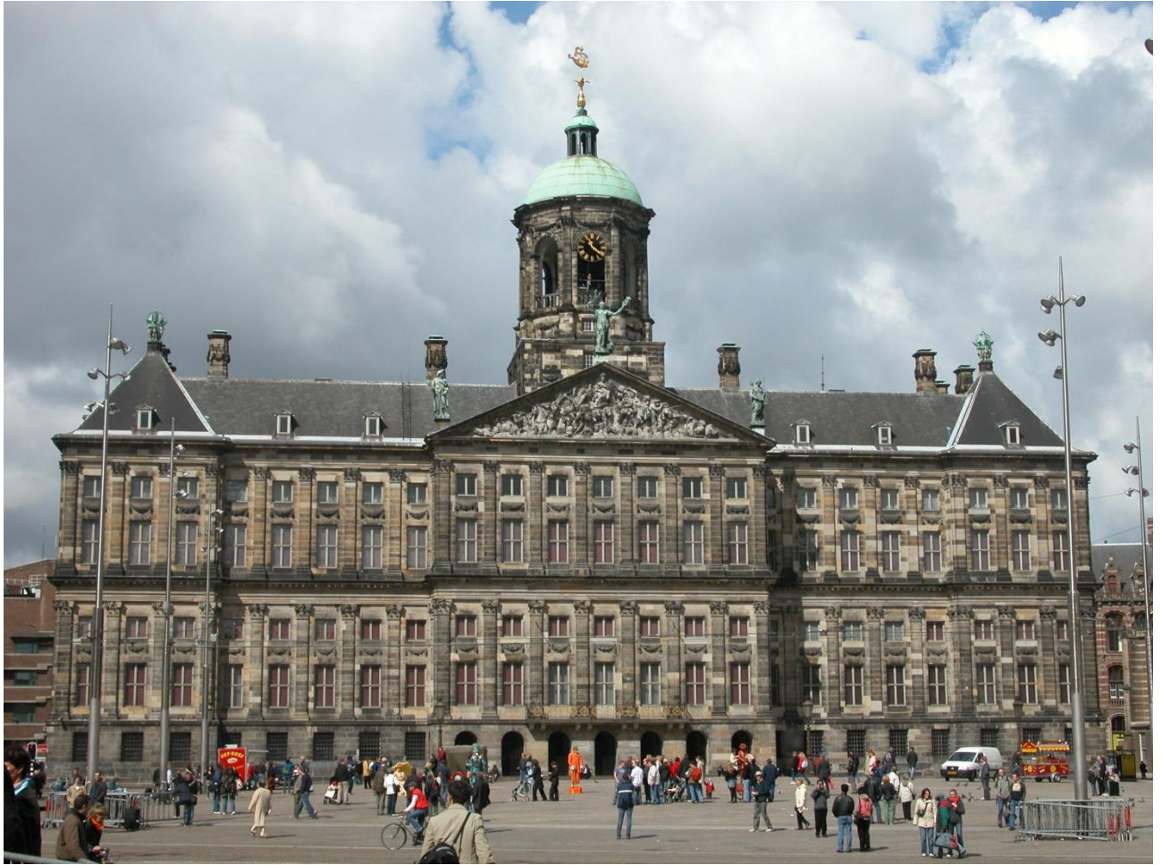
Рис. О.1. Площа Дам