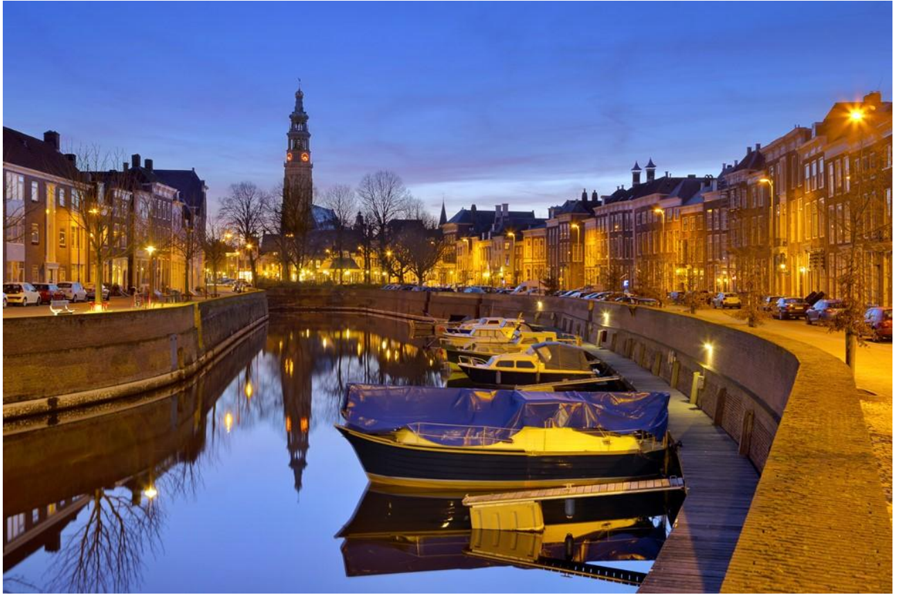
Рис. Е.1 Місто Мідделбург[56]