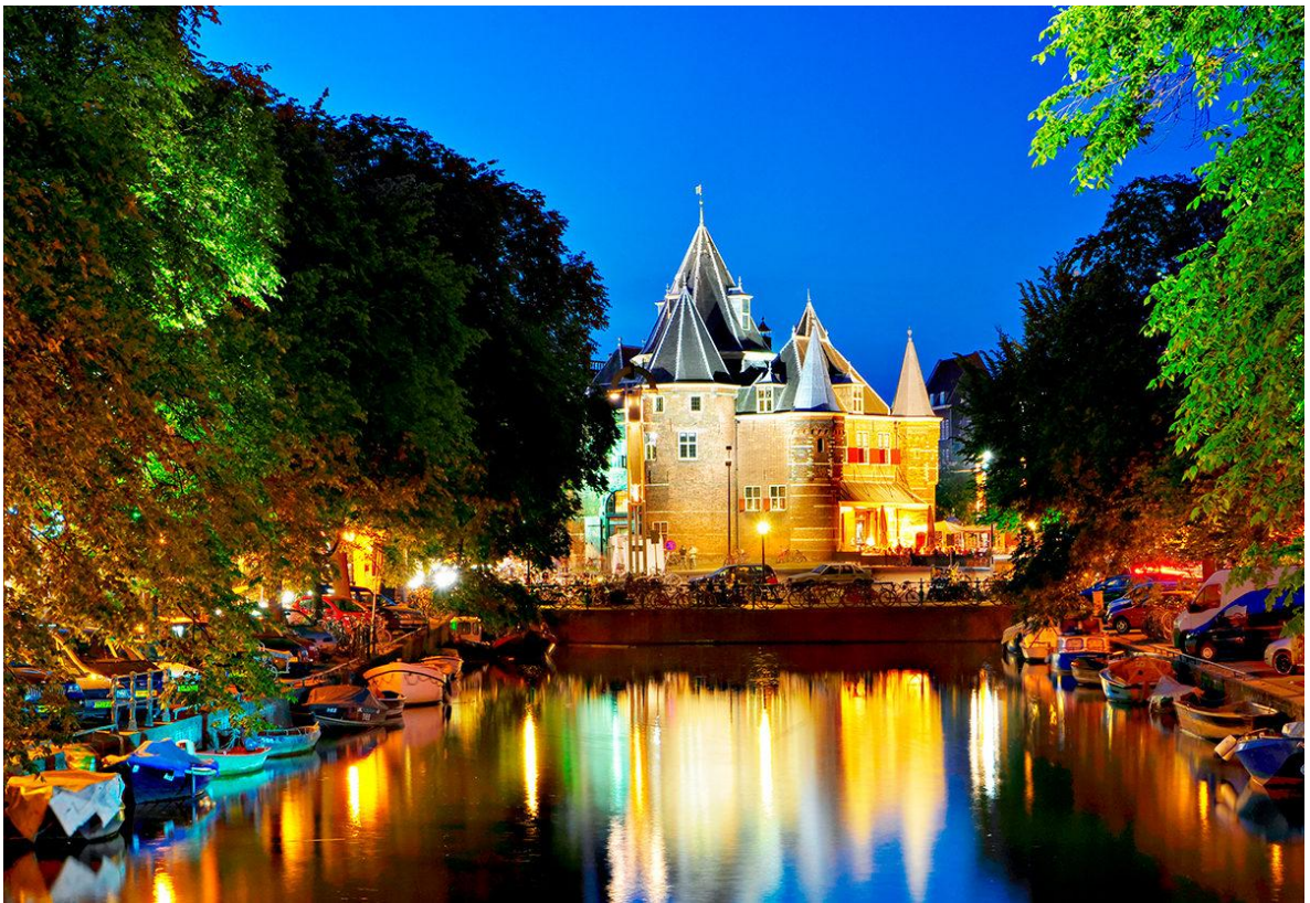
Рисунок О.4. Ваг