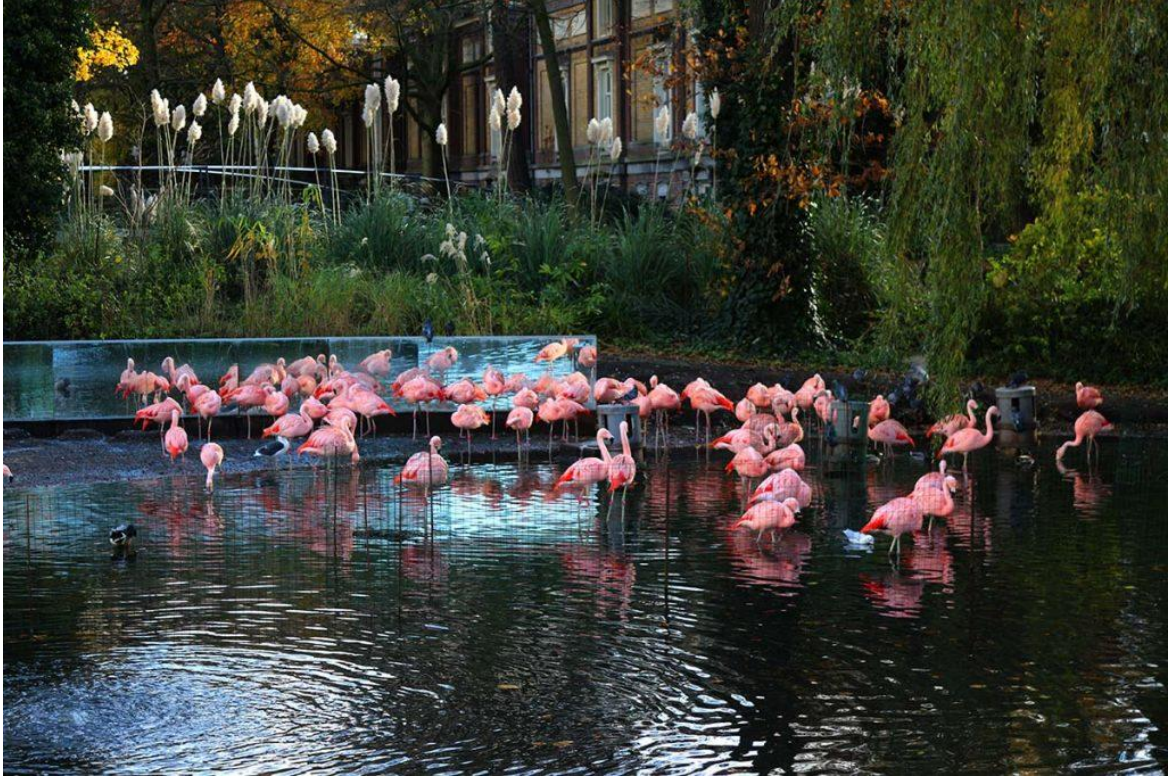
Рис. О.5. Зоопарк «Артис»