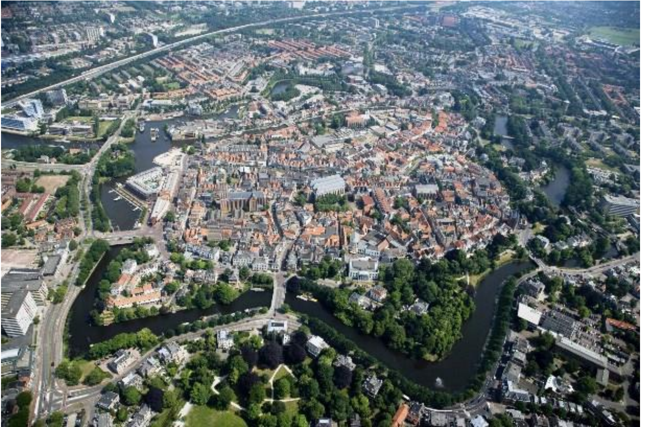
Рис. А. 1. Місто Зволле [50]