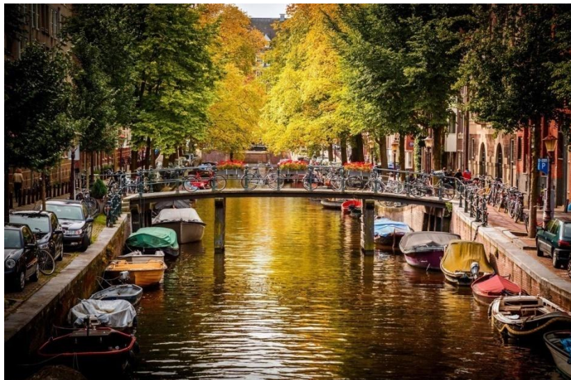
Рис. О.8. Амстердам