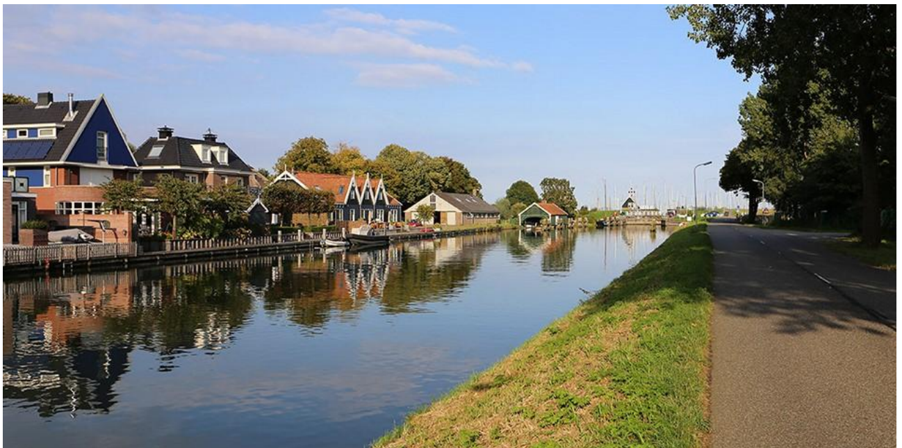
Рис. Н. 2. Місто Едам [66]