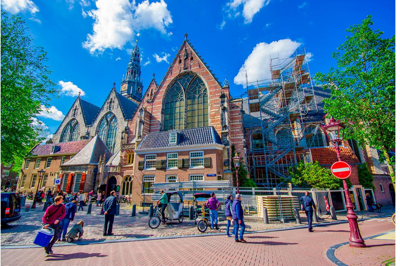
Рис. О. 3. Церква Ауде Керк