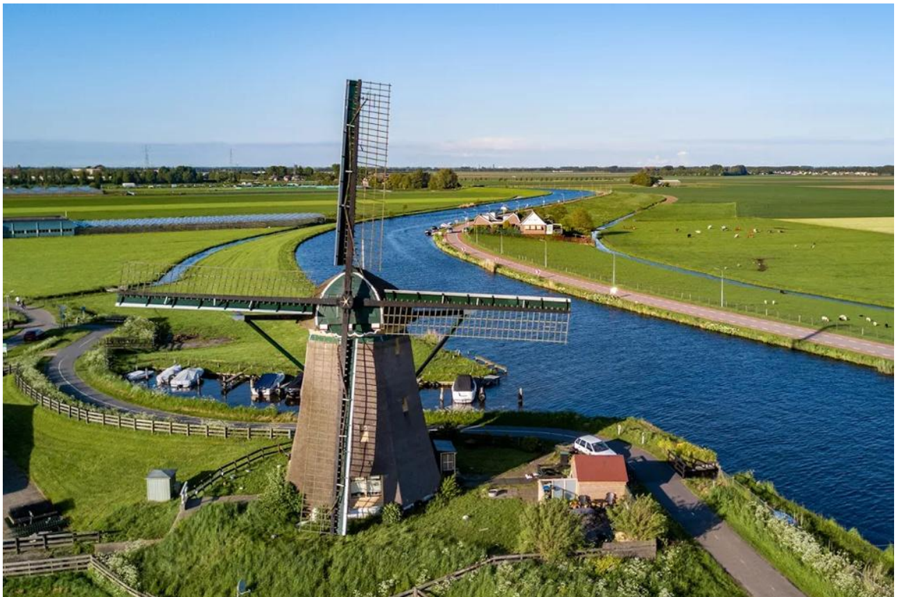
Рис. К.2. Селище Ліссе [61]