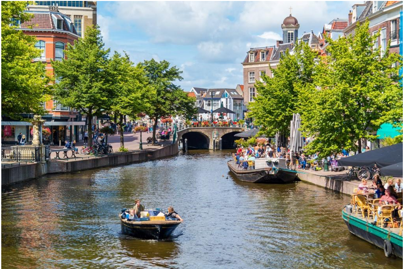
Рис.Л.1 Місто Лейден [62]