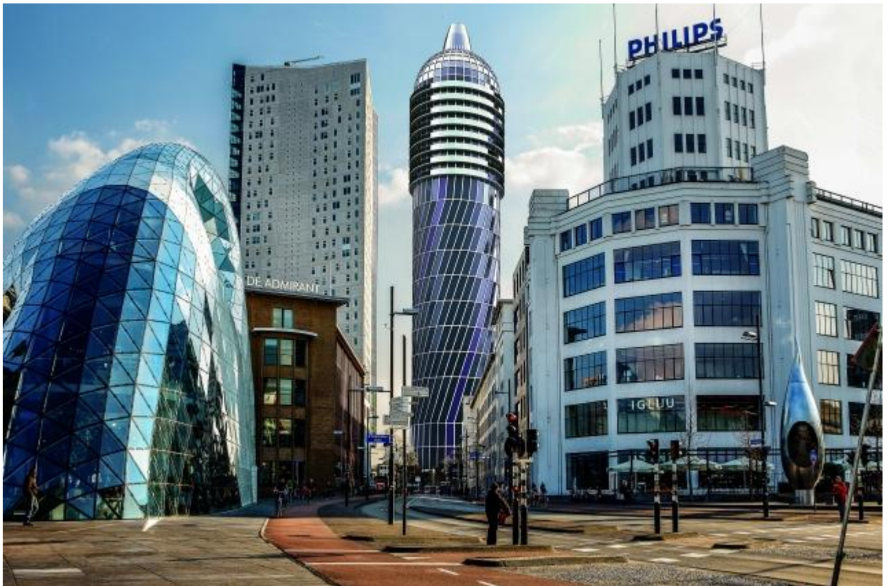
Рис. М.1. Місто Ейндховен [63]