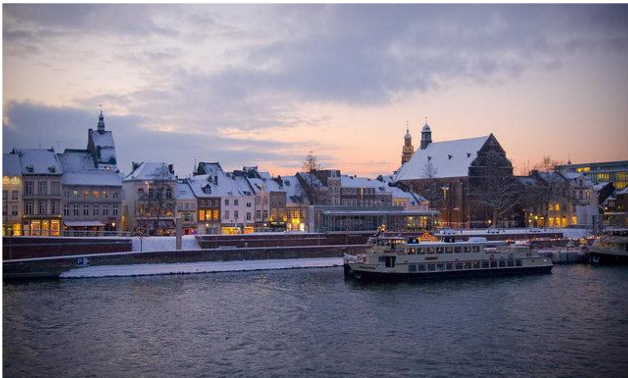
Рис. Ж.2. Місто Маастрихт [58]