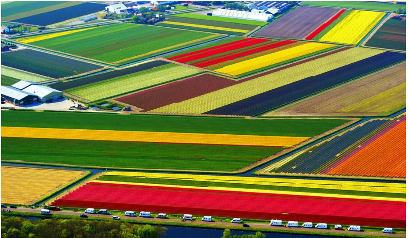
Рис. К.1 Поля тюльпанів у селищі Ліссе [60]