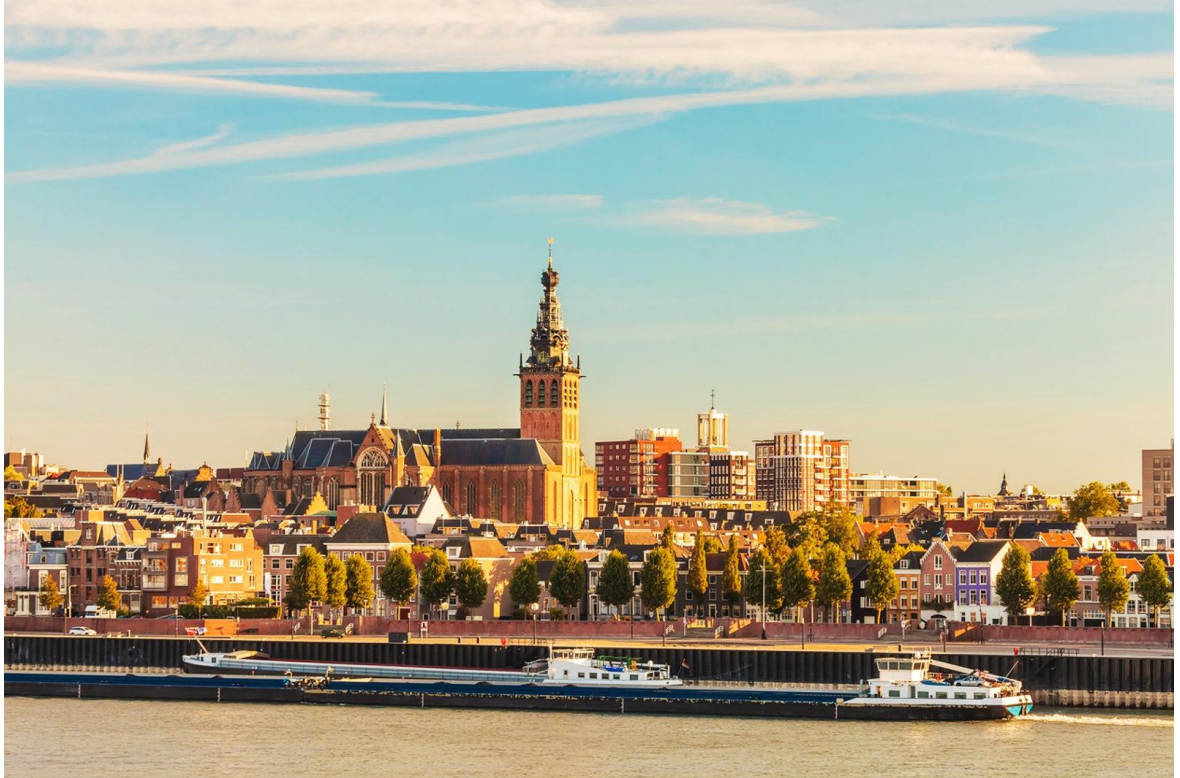
Рис. Г.2. Місто Неймеген [55]