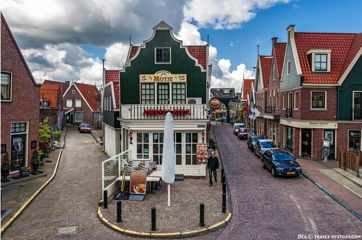
Рис. Б 1. Селище Волендам [52]