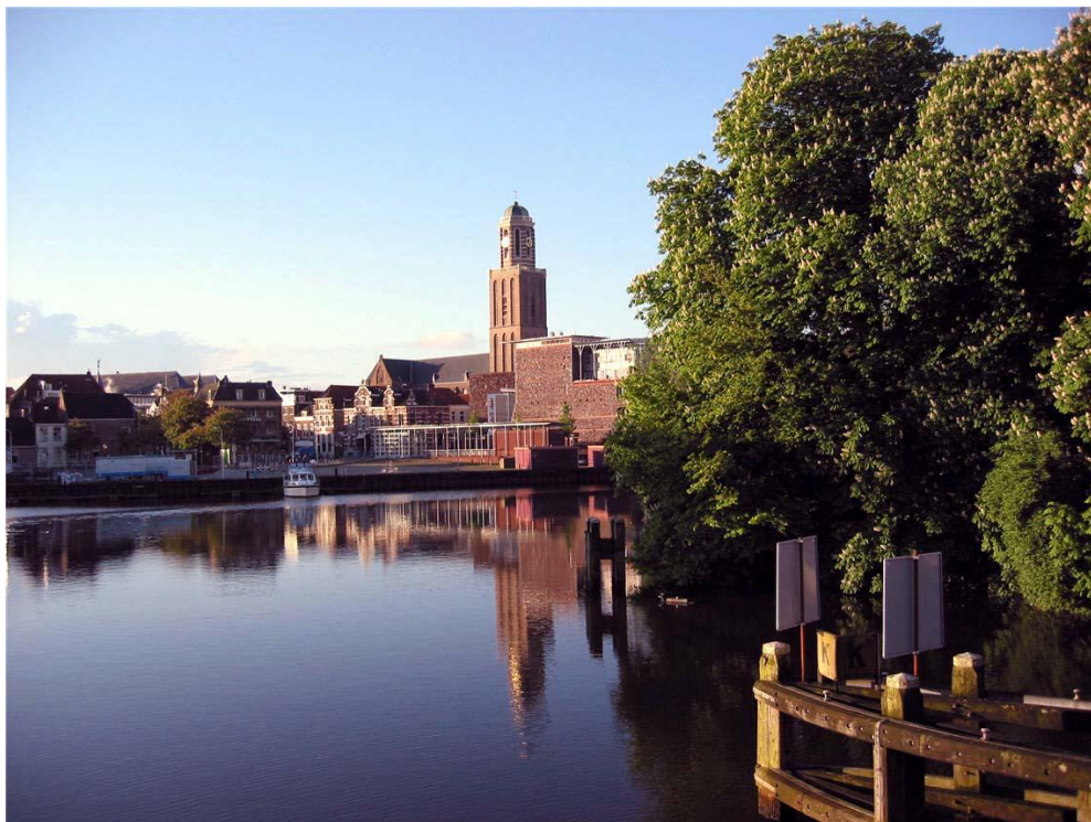
Рис. А. 2. Місто Зволле[51]