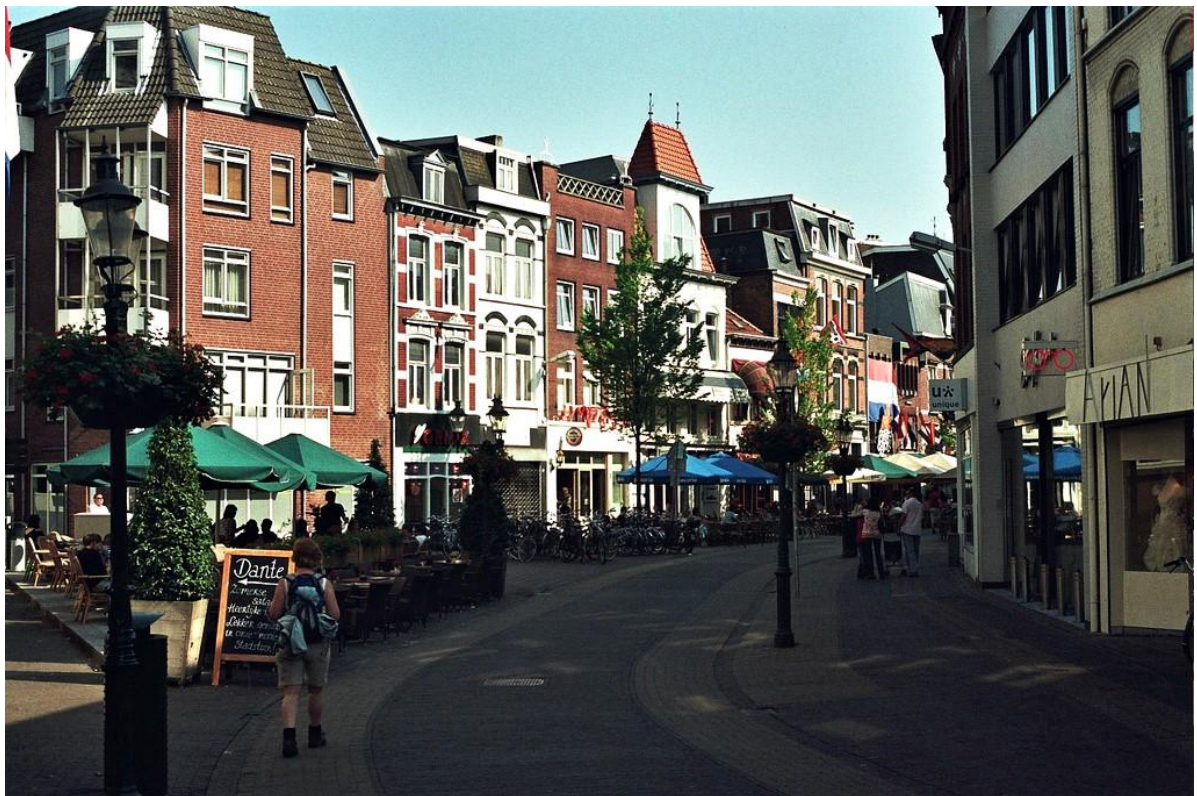
Рис. В.2. Місто Венло [53] Додаток Г