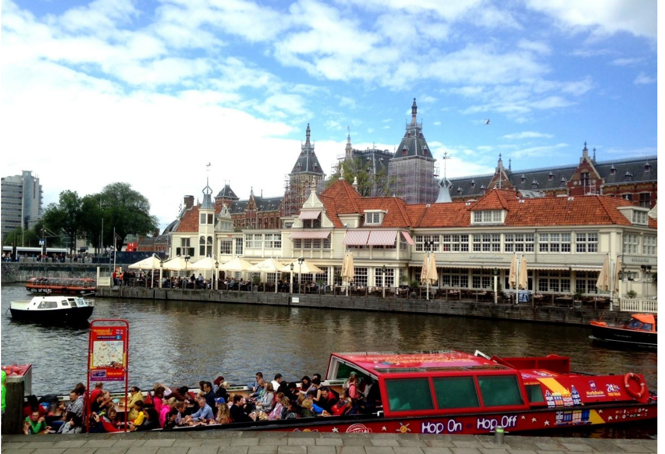
Рис. О.7. Амстердам