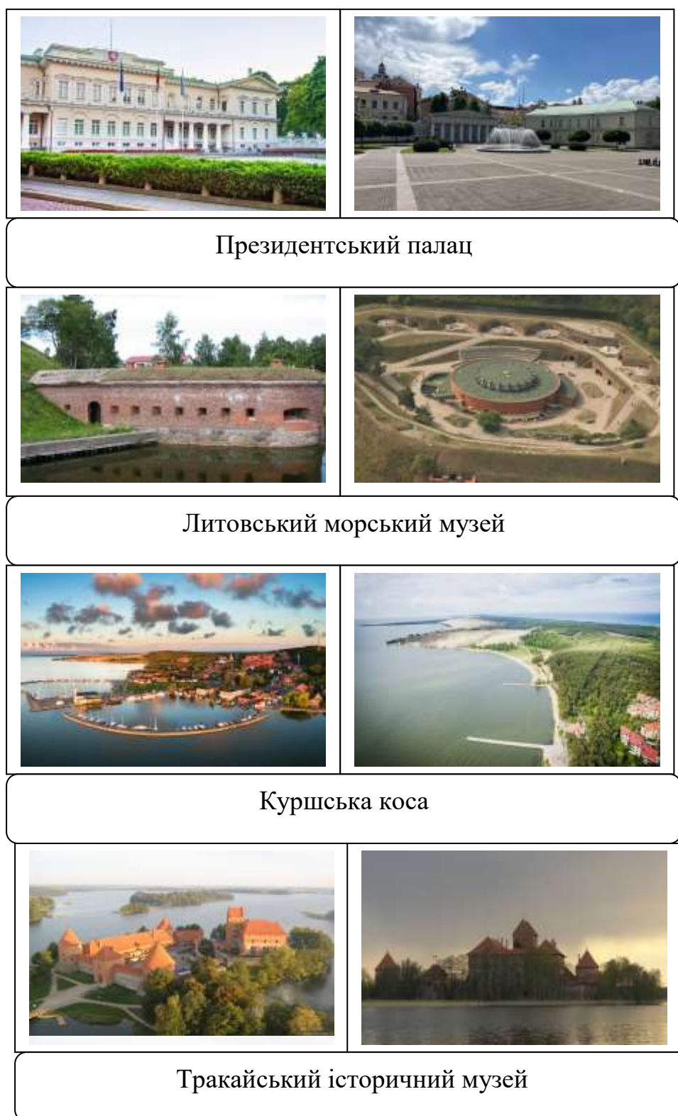
Рис. 1.1. 2.2. Архітектурна спадщина Литви як об'єкт туристичної діяльності