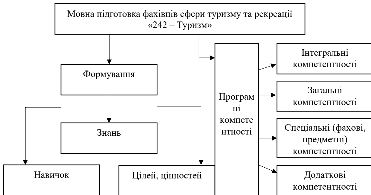
Рис. 2.1 Модель мовної підготовки фахівців у сфері туризму та рекреації

студентами компетентностей (рис.2.1). У побудованій моделі нами було виділено блоки формування мовної підготовки фахівців сфери туризму та рекреації.