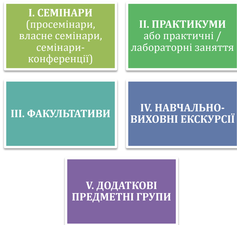
Рис. 3.2. Позаурочні заходи формування мовленнєвого етикету здобувачів освіти в старших класах

Проаналізуємо деякі інші види позурочних виховних заходів, доречних у старших класах. Ми їх узагальнили на рис. 3.2.