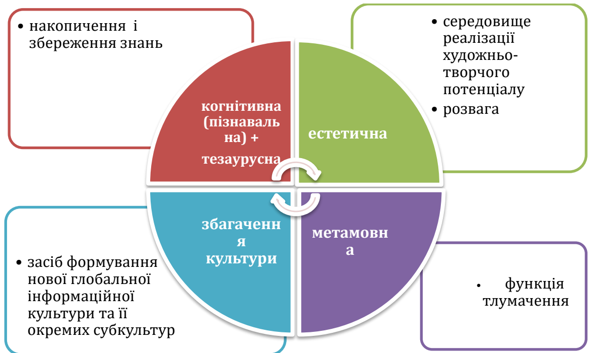
Рис. 2.3. Функції інтернету

Інтернет має низку позитивних аспектів, таких як подолання комунікативного бар'єру та розширення кола друзів. Проте ці переваги супроводжуються ризиками, особливо для підлітків. Наприклад, дружба в соціальних мережах може бути поверхневою, а підлітки можуть намагатися привернути увагу, додаючи незнайомих людей до своїх контактів. Це підвищує ризик розголошення особистої інформації і може загрожувати безпеці. Крім того, створення кількох профілів під різними іменами може негативно вплинути на самоідентифікацію підлітка, спричиняючи плутанину у власному сприйнятті та поведінці.