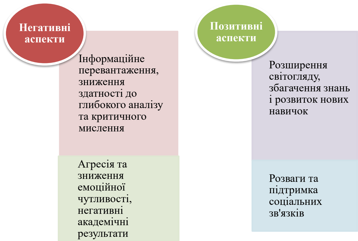
Рис. 2.4. Позитивні й негативні аспекти впливу інтернету, соціальних мереж на старшокласників

Дійсно, віртуальне спілкування в підлітковому віці стало важливою частиною соціалізації і може суттєво впливати на розвиток особистості. Соціальні мережі надають підліткам змогу розвивати комунікативні навички, знаходити нових друзів, наслідувати впливових зірок, спортсменів та реалізовувати інтереси, які можуть бути фрустровані в реальному житті. Однак важливо враховувати й потенційні негативні аспекти. Ми узагальнили їх на рис. 2.5.