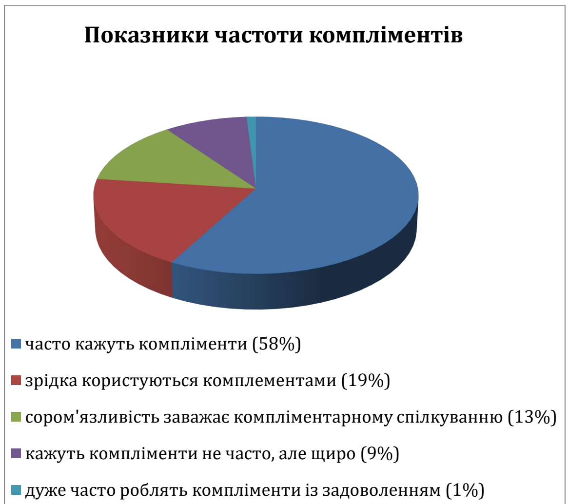
Рис. 2.2. Рівень компліментарності мовлення опитаної молоді

У ході анкетування встановлено, що молодь загалом не цурається компліментів, проте відчуває певні обмеження щодо їх вживання. Зокрема, результати опитування представлено на рис. 2.2.