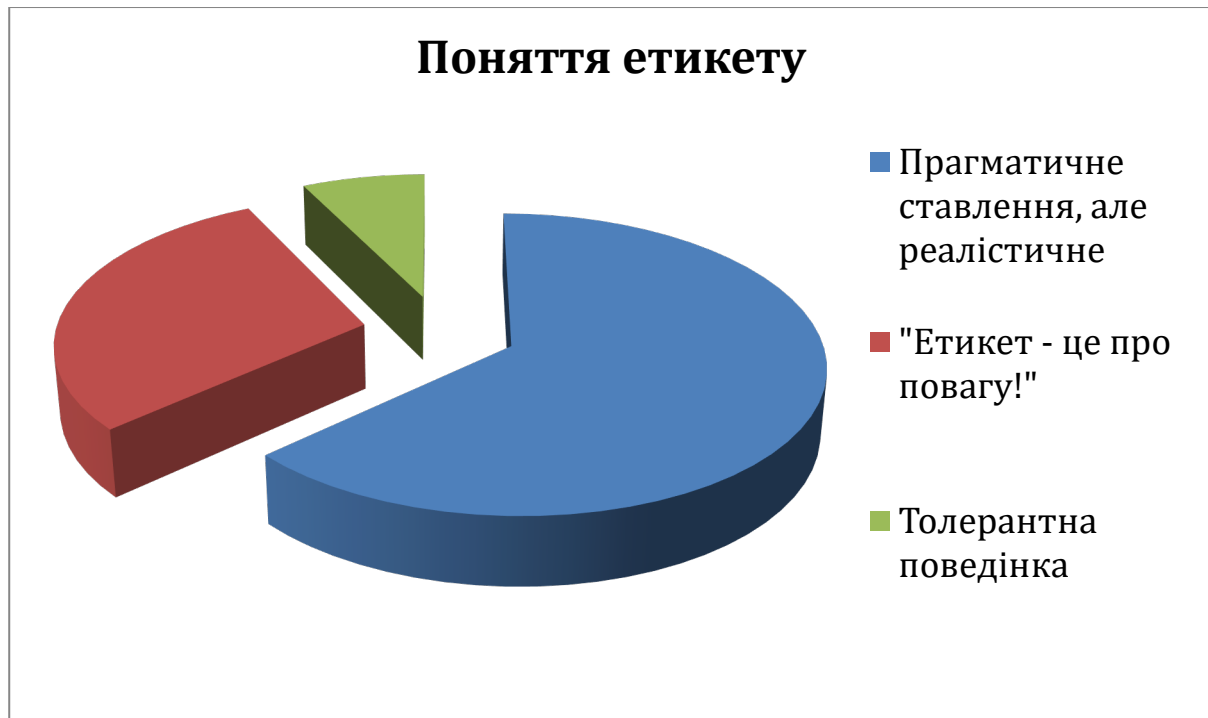
Рис. 2.1. Уявлення студентів 1 курсу про суть етикету

56 % респондентів відповіли, що етикет – це правила поведінки в соціумі / громадських місцях / суспільстві. Зазначалися наступні відповіді: “етикет допомагає забезпечити хороші відносини та уникати конфліктів” ; “сукупність правил поводження в суспільстві, він контролює поведінку людини в певних ситуаціях, роблячи спілкування більш комфортним та приємним для всіх учасників” .