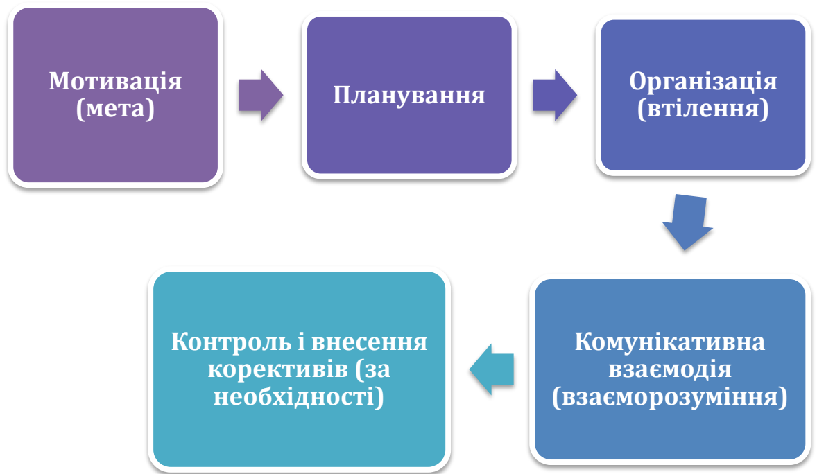
Рис. 3.1. Основні правила формування в молоді етики мовлення

Етап I. Мотивація полягає в наданні істотного впливу на формування мовленнєвого зростання особистості, засвоєння кожним із них мовного матеріалу.