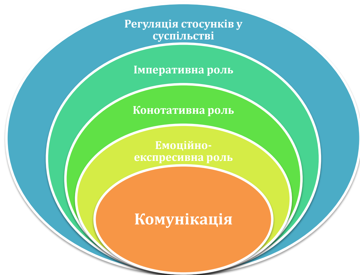
Рис. 1.1. Призначення мовленнєвого етикету

Мовленнєвий етикет багатий різними функціями, див. рис. 1.1.