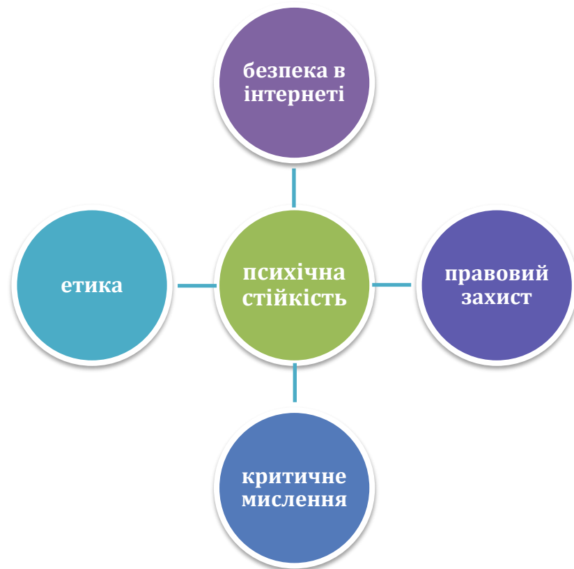
Рис. 2.5. Необхідні засади віртуальної комунікації

Отже, для максимально ефективного й безпечного використання соціальних мереж важливо поєднувати позитивні можливості з уважним підходом до управління ризиками. Основні засади цього підходу ми систематизували на рисунку 2.4.