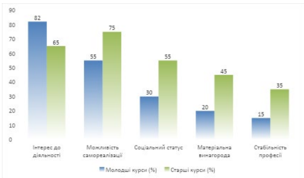
Рис. 3.4. Співвідношення результатів методик в залежності від курсу навчання.

Для вивчення змін у мотивації до вибору професії психолога на різних етапах навчання було проведено порівняльний аналіз відповідей студентів молодших (1-2 курси) та старших (3-4 курси) курсів. Це дозволило виявити динаміку змін у мотиваційній структурі, пов'язаних із накопиченням досвіду, формуванням професійних установок та усвідомленням практичних аспектів майбутньої діяльності.