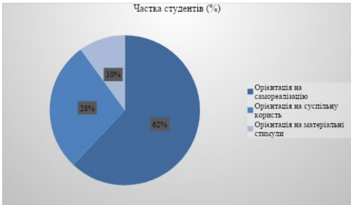
Рис. 3.3. Результати методики діагностики ціннісних орієнтацій у професійній сфері (Д.О. Леонт'єв)

Найчисельніша група, що становить 62% вибірки, орієнтована на самореалізацію. Такі студенти розглядають професію психолога як засіб реалізації власного потенціалу, досягнення особистісного зростання та внутрішньої гармонії, сприймаючи свою діяльність як своєрідну місію. Їхні коментарі, отримані через додаткове відкрите опитування, включають: «Психологія для мене - це не просто робота, а можливість реалізувати свої ідеї та прагнення» та «Я вірю, що моя професія допоможе мені знайти сенс у житті». Друга група, яка охоплює 28% респондентів, акцентує увагу на суспільній користі. Ці студенти підкреслюють значущість своєї професії для суспільства, спрямовуючи зусилля на допомогу людям, вирішення соціальних проблем і підвищення психологічного благополуччя. Типові висловлювання з їхніх відповідей: «Я хочу допомагати людям долати труднощі» і «Для мене важливо робити свій внесок у гармонізацію суспільства». Третя, найменш численна група (10%), орієнтована на матеріальні стимули. Представники цієї групи обирають професію психолога через прагнення до фінансової стабільності, звертаючи увагу на практичний аспект діяльності. Їхні відповіді відображають цю позицію: