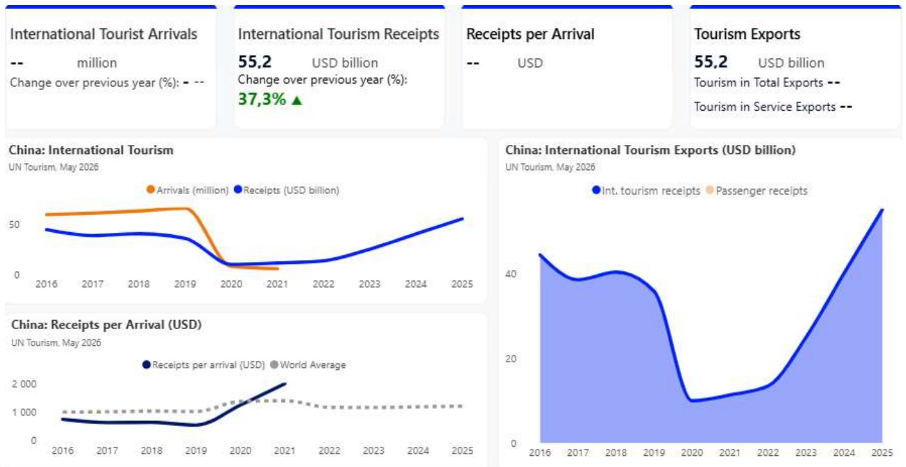
Рис. 2.1. Динаміка міжнародних туристичних прибуттів та надходжень у Китаї за період 2016–2025 рр. ( UN Tourism Data Dashboard, 2025 )

млрд доларів, що на 37,3% вище за показники попереднього року. Динаміка показників свідчить про поступову нормалізацію міжнародних туристичних потоків після періоду обмежень, пов'язаних із пандемією COVID-19 (див. рис.).