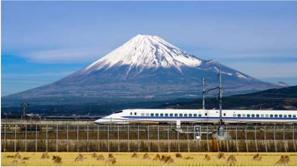
Рис. Д.1. Високошвидкісний поїзд Shinkansen - елемент сучасної залізничної транспортної системи Японії ( How the bullet train transformed Japan. URL: https://www.bbc.com/travel/article/20241126-how-the-bullet-train-transformed-japan )