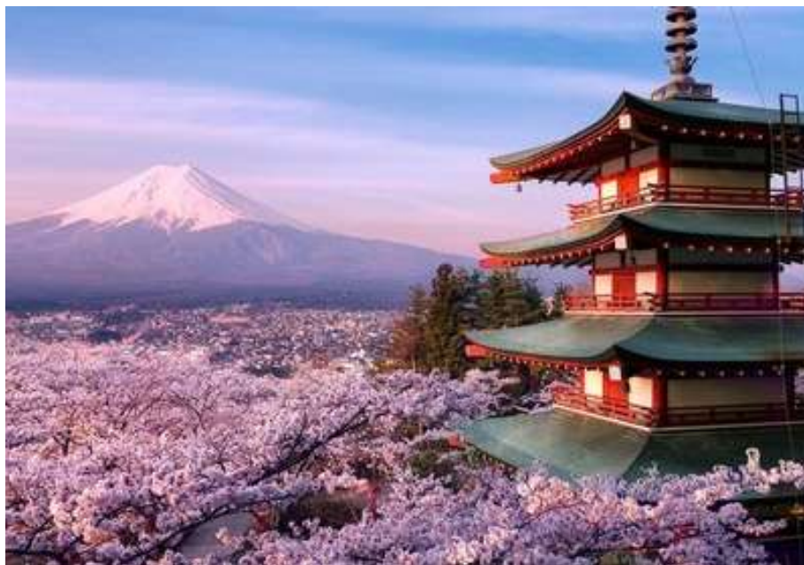
Рис. А.1. Культурний туризм (Киото – стародавня Японія. URL: https://otiumportal.com/kioto-malenka-starodavnia-yaponiia )

Фотоматеріали видів туристичних подорожей