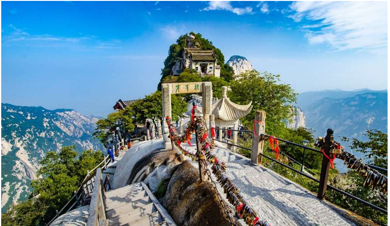
Рис. А.3. Гірський туризм ( The Five Great Mountains of China URL: https://www.expatsholidays.com/the-five-great-mountains-of-china/ )