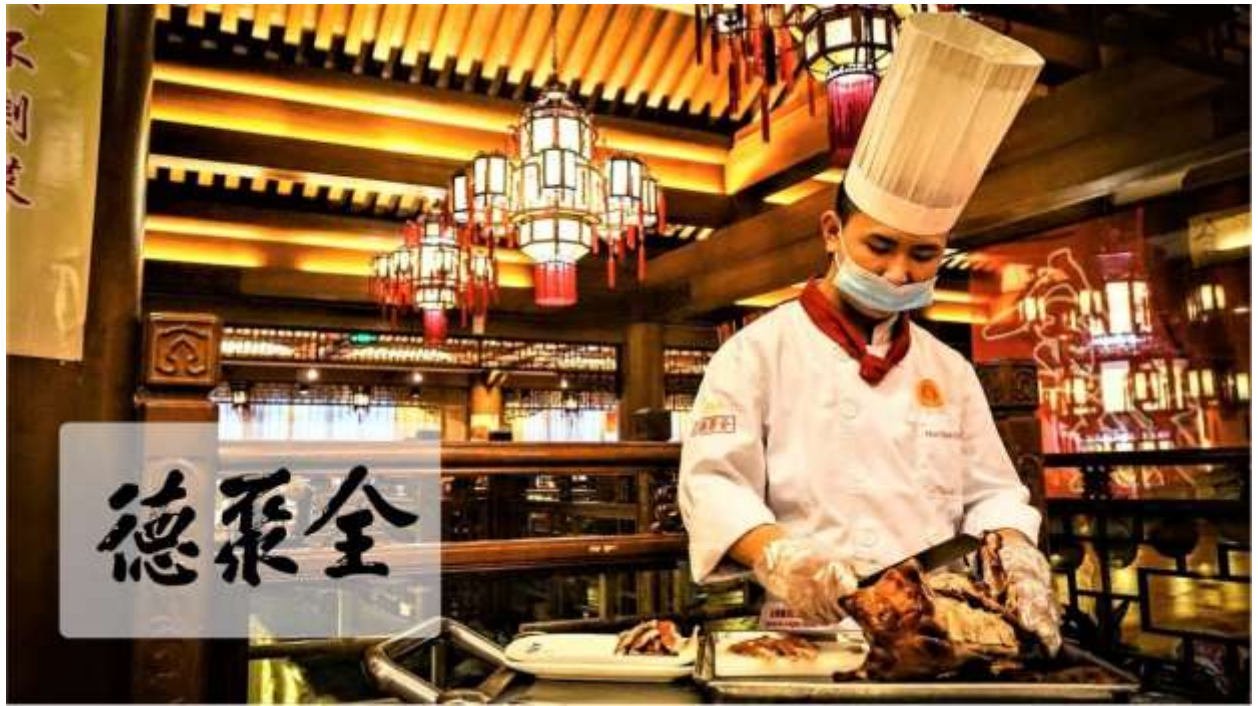
Рис. Г.5. Quanjude Roast Duck Restaurant у Пекіні як приклад ресторанної інфраструктури Китаю ( Beijing Quanjude . URL: https://english.visitbeijing.com.cn/article/47WR2d058wK )