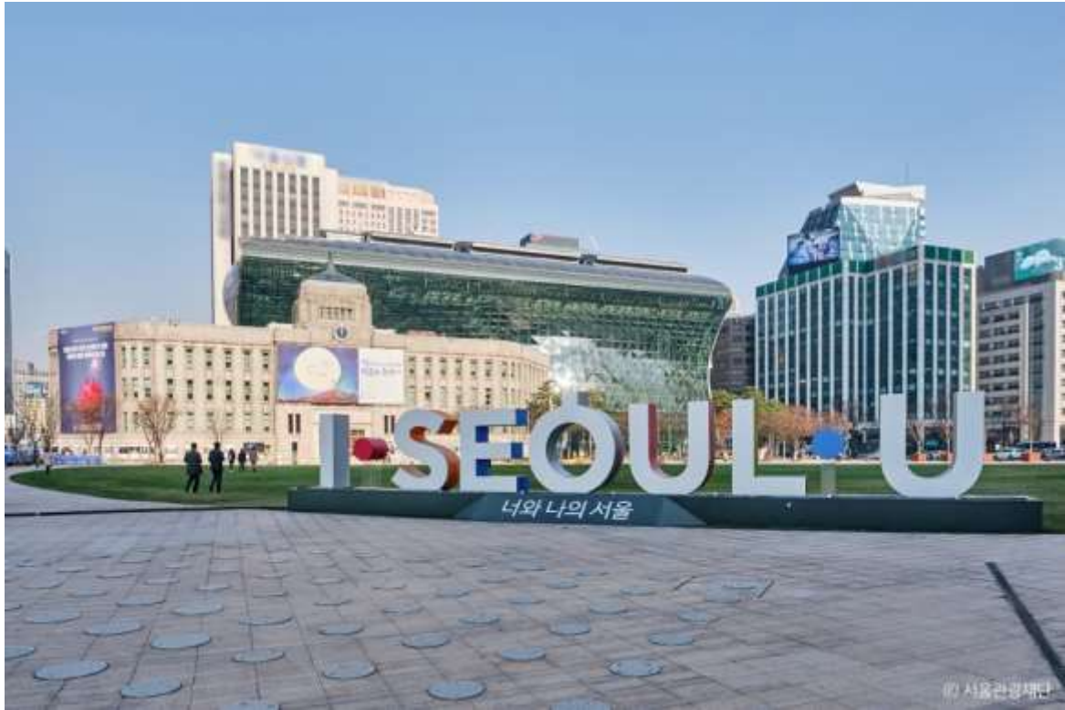
Рис. Г.3. Seoul Tourism Plaza як приклад сучасного туристичного центру Кореї (Seoul Tourism Plaza. URL: https://english.visitkorea.or.kr/svc/contents/contentsView.do?vcontsId )