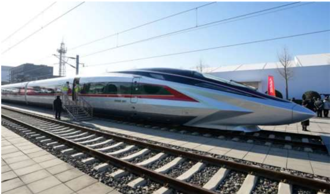
Рис. Д.2. Китайський високошвидкісний поїзд CRH як складова швидкісної залізничної інфраструктури Китаю ( China Unveils Fastest High-Speed Train in the World. URL: https://www.newsweek.com/china-unveils-world-fastest-high-speed-train-2007971 )