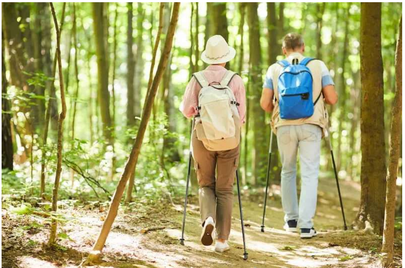
Рис. А.6. Природний туризм ( What is nature tourism and why is it so popular? URL: https://tourismteacher.com/nature-tourism/ )