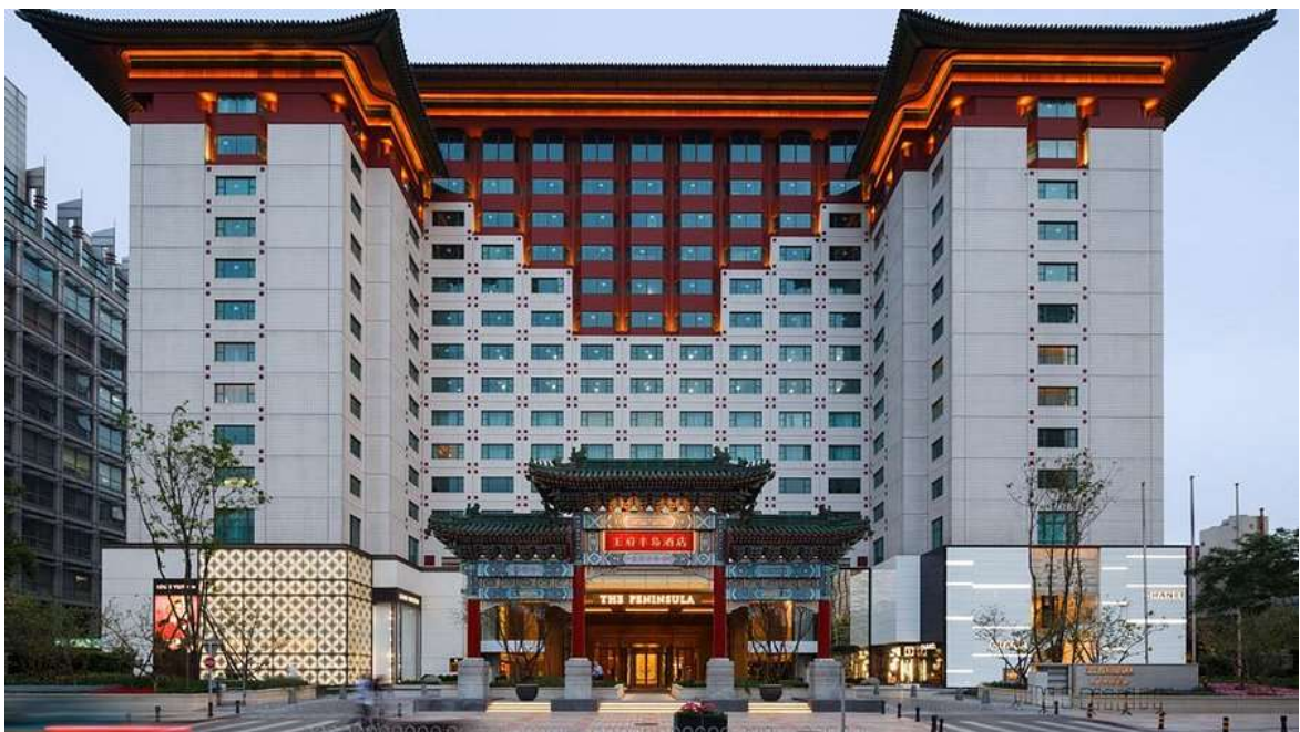
Рис. Г.2. The Peninsula Beijing як приклад готельної інфраструктури Китаю