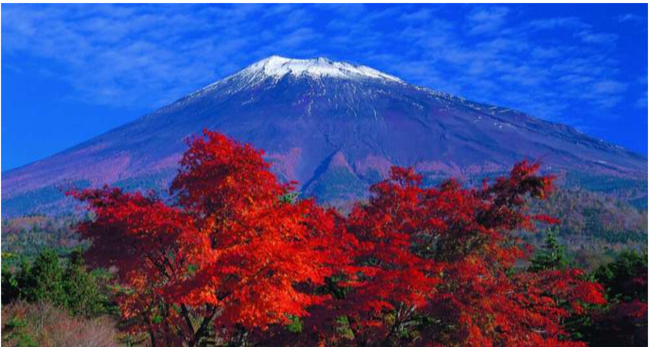
Рис. В.2. Гора Фудзі (Фудзіяма), Японія ( Fujisan, sacred place and source of artistic inspiration. URL: https://whc.unesco.org/en/list/1418/ )