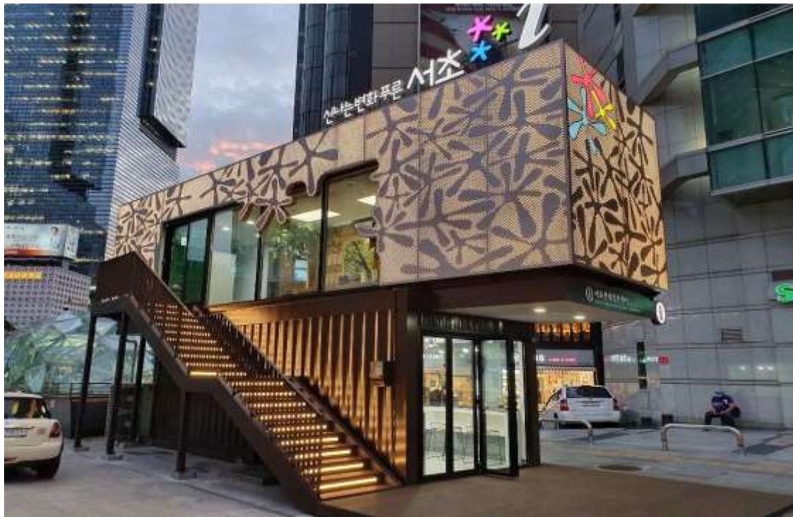
Рис. Г.4. Seocho Tourist Information Center у Сеулі як приклад інформаційного забезпечення туристів (Seocho Tourist Information Center. URL: https://oojooblog.wordpress.com/ )