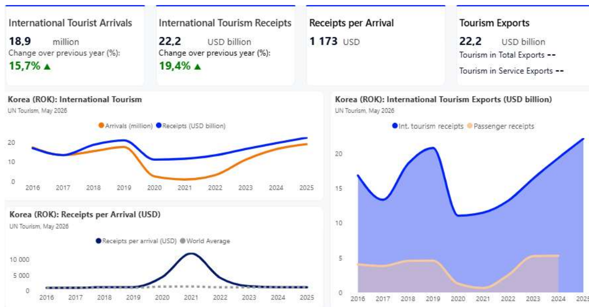
Рис. 2.3. Статистичний аналіз міжнародного туризму в Республіці Корея. (UN Tourism Data Dashboard, 2025)

Туристичний сектор Південної Кореї характеризується стабільним відновленням та помірним зростанням: у 2025 році країну відвідали 18,9 млн іноземних туристів, забезпечивши 22,2 млрд доларів доходів. Аналіз динаміки показує тимчасове аномальне зростання показника Receipts per Arrival у 2021 році, після чого спостерігається його стабілізація до 2025 року. Загалом Південна Корея зміцнює свої позиції як один з туристичних напрямків Східної Азії, що швидко розвиваються (див. рис. 2.3).