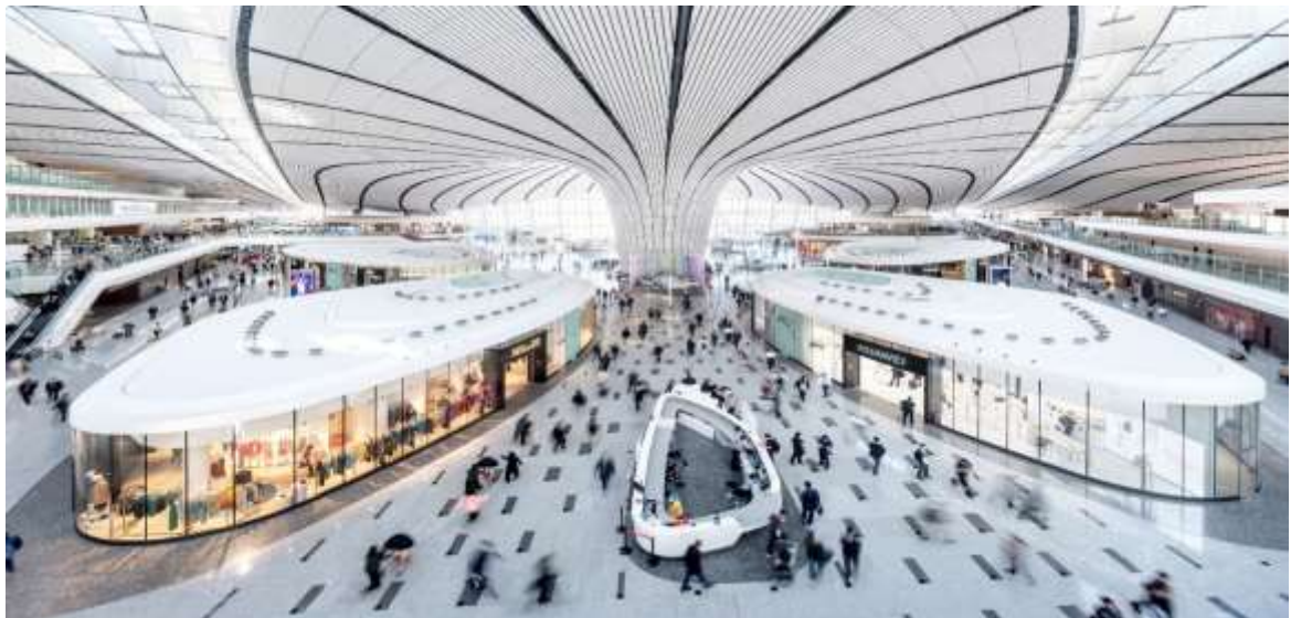
Рис. Д.4. Beijing Daxing International Airport - сучасний міжнародний авіаційний транспортний вузол Китаю ( Beijing Daxing Airport . URL: https://group.schindler.com/en/media/stories/beijing-daxing-international-airport.html )