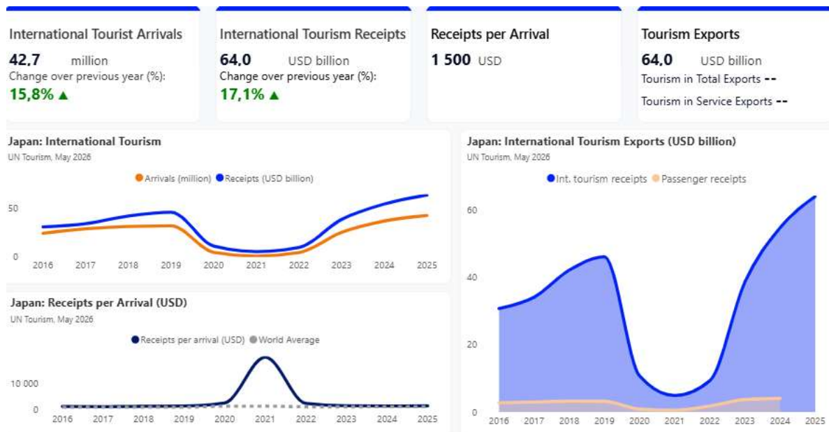
Рис. 2.2. Показники розвитку міжнародного туризму в Японії: прибуття, надходження та експорт послуг за 2016–2025 рр. ( UN Tourism Data Dashboard, 2025 )

порівняно з попереднім періодом. Графік відображає V-подібну траєкторію відновлення, за якої показники не лише досягли, а й перевищили допандемійний рівень 2019 року (див. рис. 2.2).