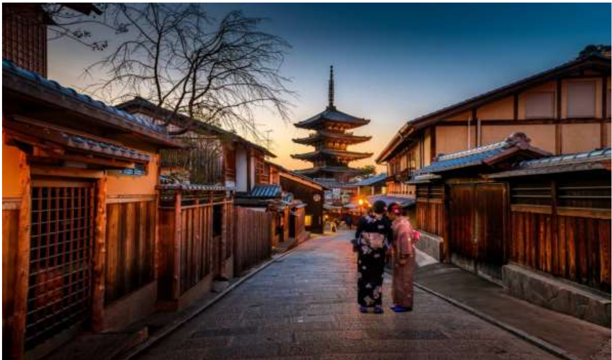
Рис. В.4. Історичний центр міста Кіото, Японія