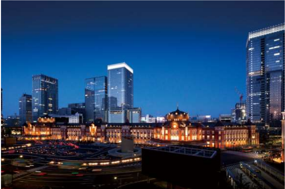
Рис. Г.1. Tokyo Station Hotel як приклад сучасної готельної інфраструктури Японії ( Tokyo Station Hotel . URL: https://www.thetokyostationhotel.jp/gallery/ )