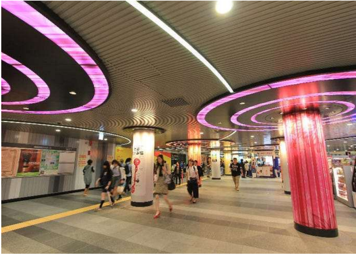
Рис. Д.3. Станція метро в Токіо як приклад ефективної міської транспортної системи ( The Complete Guide to Shibuya Station . URL: https://livejapan.com/en/in-tokyo/in-pref-tokyo/in-shibuya/article-a0001221/ )