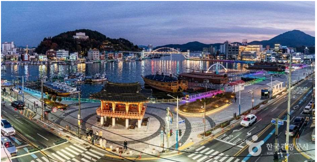
Рис. А.5. Міський туризм ( Smart tourism city . URL: https://english.visitkorea.or.kr/svc/sp/SmartTourismCity )