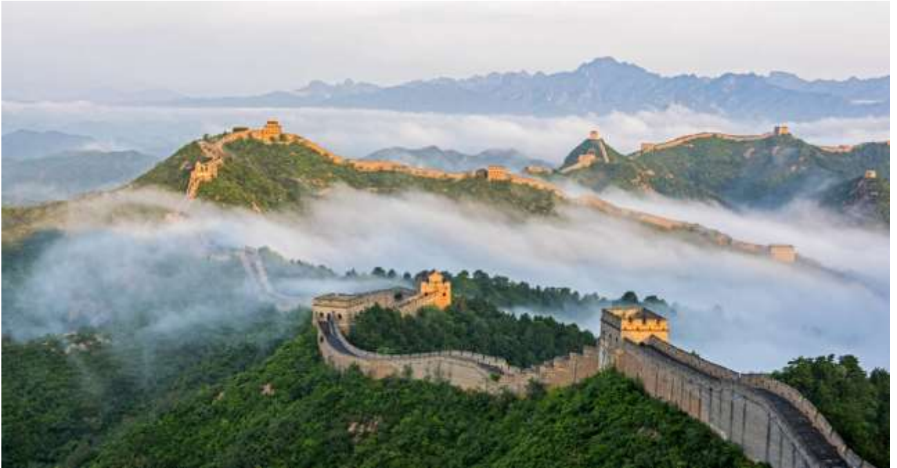
Рис. В.1. Велика Китайська стіна, Китай ( The Great Wall. URL: https://whc.unesco.org/en/list/438/ )