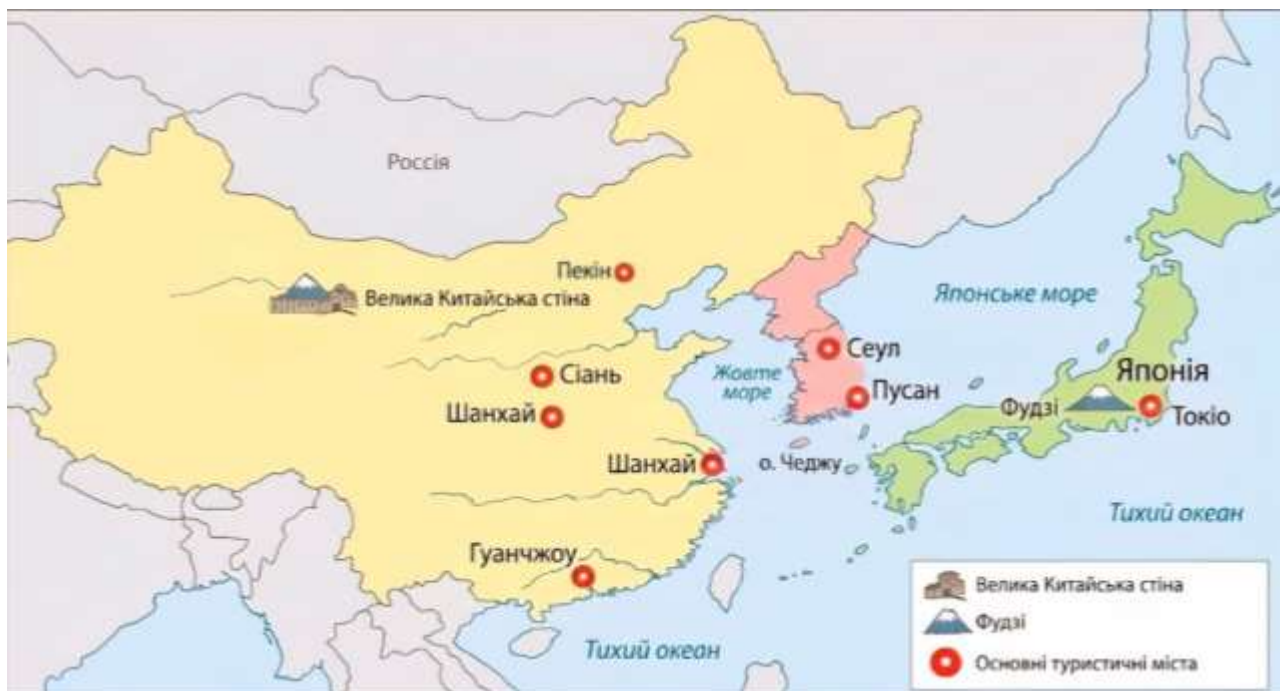
Рис. 2.1. Карта основних туристичних центрів Східної Азії (побудовано автором)

Для наочного уявлення про розташування ключових туристичних центрів регіону доцільно використати карту основних туристичних напрямків Східної Азії (див.рис.2.1).