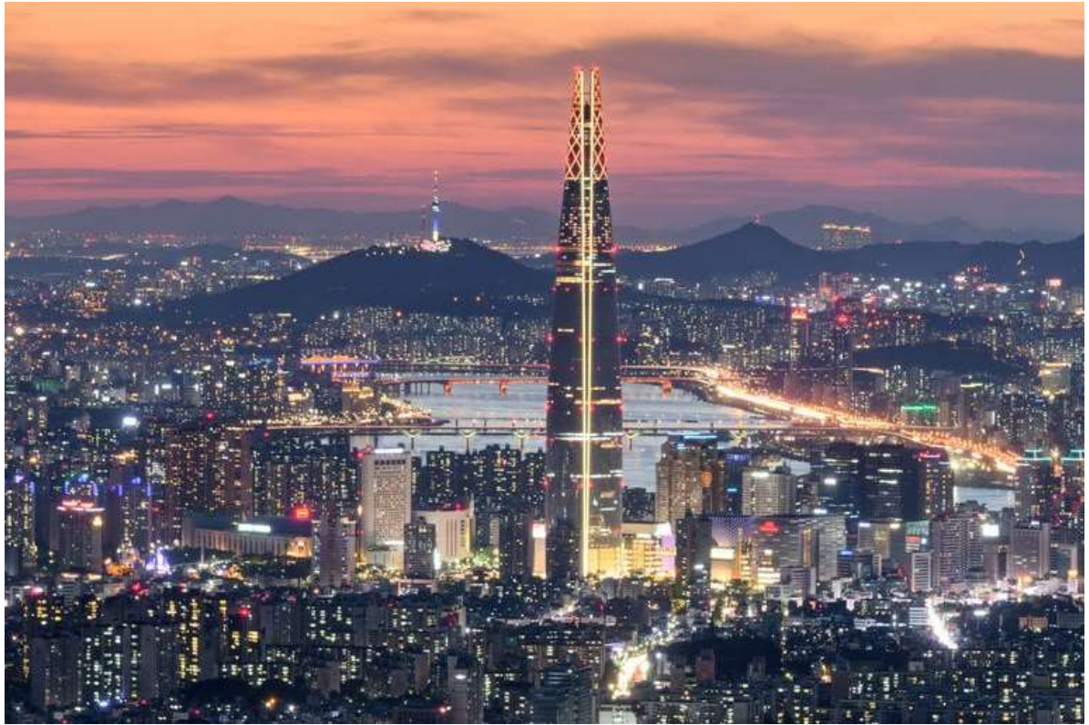
Рис. В.3. Панорама міста Сеул, Південна Корея ( Seoul city guide . URL: https://www.elle.com/uk/life-and-culture/travel/a64754317/seoul-city-guide/ )