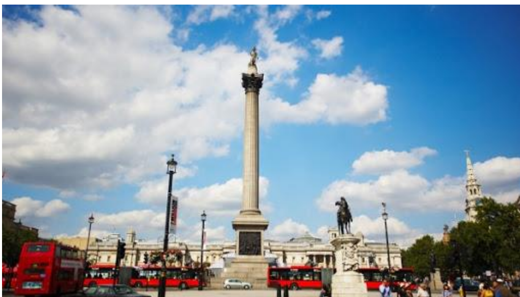
Рис. 2.29. Трафальгарська площа

площі присвячена розгрому іспансько-французького флоту 1805 року. Посередині площі знаходиться монумент заввишки у 44 м. на честь Гораціо Нельсона, адмірала, який командував британським флотом в Трафальгарській битві [44]. Саама тут громадські організації всієї країни проводять різноманітні заходи, що приваблює туристів з різних куточків не тільки країни, але й усього світу. Крім того, сама площа символізує надзвичайно важливу подію в історії країни.