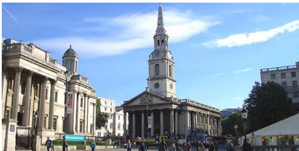
Рис. 2.13 Церква Святого Мартіна

Незважаючи на те, що церква - «королівська», в її підвалі діє їдальня і кафе для малозабезпечених. Це символ «демократичності» британської монархії. Крім того, парафіяльна громада ще з кінця XIX століття містить благодійний пансіон і богадільню, щоб відповідати імені «церкви завжди відкритих дверей», що надає допомогу всім нужденним [44].