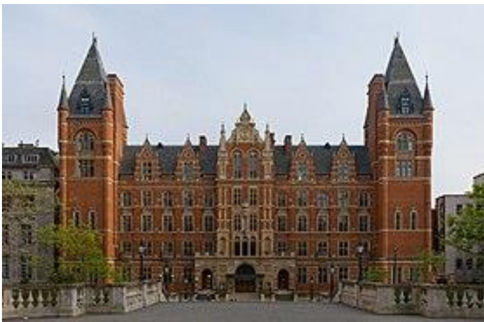
Рис. 2.19. Королівський коледж музики

Королівський коледж музики (1882 р.)– британський вищий музичний навчальний заклад, розташований в Лондоні. Крім навчальної частини, коледж в своєму розпорядженні має значну музейно-архівну складову, основа якої була закладена одним із засновників коледжу Джорджем Гроувом. У коледжі є Музей музичних інструментів, що включає більше 800 експонатів від XV століття до наших днів, колекція нотних автографів, колекція портретів (понад 300 живописних оригіналів, серед яких, наприклад, останній прижиттєвий портрет Карла Марії фон Вебера роботи Джона Коуза, і близько 10 тис. літографованих портретів, фотографій та ін.). Понад 600 тис. експонатів налічує зібрання концертних програмок з 1730 р. до сьогоднішнього дня [97].