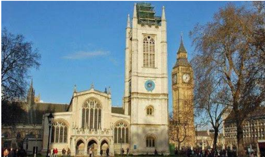
Рис. 2.3. Церква Святої Маргарити

за стала парафіяльною для членів Британського парламенту. У церкві св. Маргарити поховані Вільям Кекстон і Волтер Релі. Тут за традицією вінчалися багато поколінь англійської аристократії, у тому числі Вінстон Черчилль. Популярністю користується церковний орган.