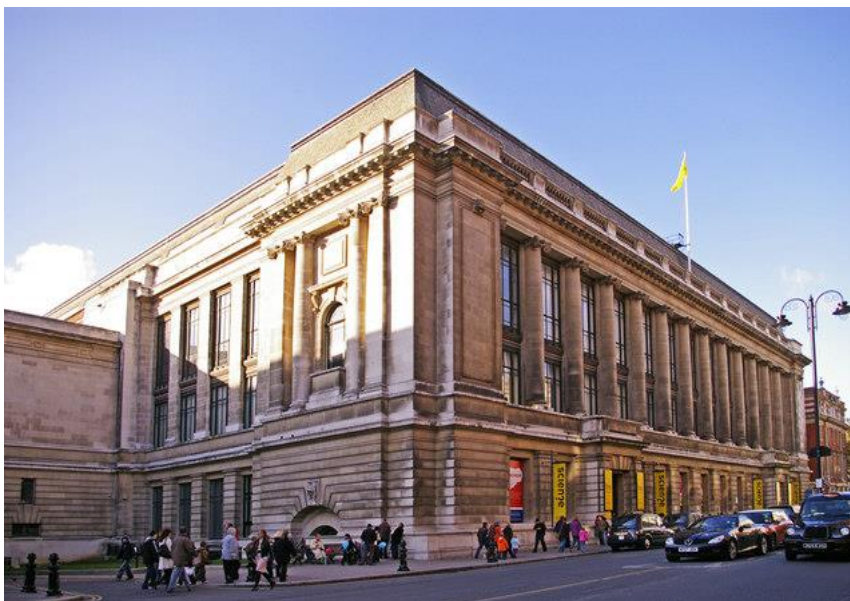
Рис. 2.17. Музей науки

Музей природознавства (1881 р.) – четвертий за відвідуваністю у Великій Британії, розташований в одній з найкрасивіших будівель Лондона і представляє сотні інтерактивних анімованих експонатів динозаврів, ссавців, 30-метрову модель блакитного кита, скелет гігантського динозавра диплодока а також цікаву механічну модель тиранозавра. [97].