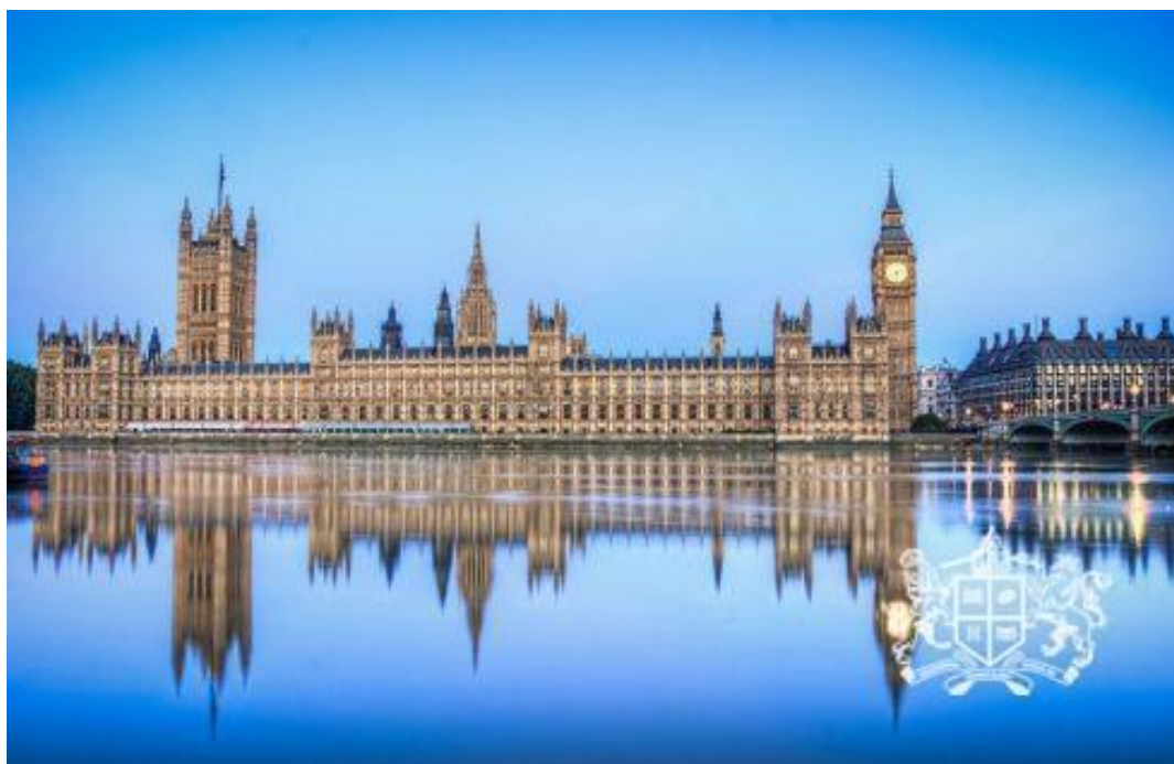
Рис. 2.1. Вестмінстерський палац.

Вестмінстер вдало і швидко реконструювали. Уже в 50-тих роках Вестмінстерський палац набув свого звичного вигляду.