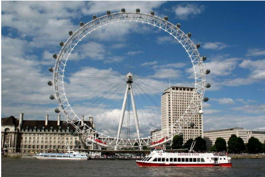
Рис. 2.34. Лондонське око

«Вемблі» – найбільший стадіон Великобританії й одна з найбільш культових футбольних арен, яка збирає тисячі туристів на футбольні матчі.