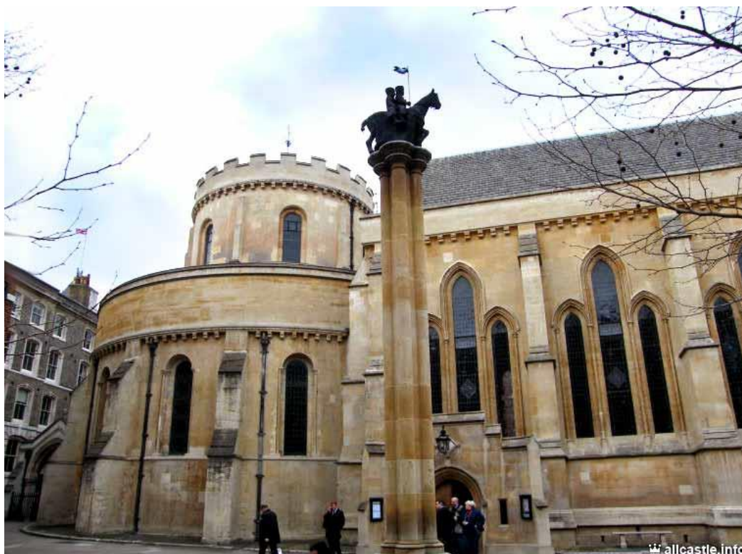
Рис.2.12. Церква Темпл

Головна визначна пам'ятка церкви – 10 кам'яних кенотафів, вмурованих у підлогу. Дев'ять з них прикрашені горельєфами лицарів у лежачому положенні, а десята - являє собою рівну кам'яну плиту. Кенотафи присвячені реальним історичним особистостям, найвідомішою з яких є Вільям Маршалл. Саме тут герої роману «Код да Вінчі» шукали лицаря, похованого Папою Римським (Ден Браун написав про Темпл багато вигадок, які не відповідають історії) [12, с. 84].