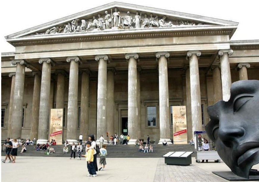
Рис.2.14 Британський музей

Так, Британський музей – один з найвідоміших музеїв у світі, який має одну із найбільших у світі колекцій старожитностей (понад 13 мільйонів екземплярів). В музеї знаходяться знахідки із Стародавнього Єгипту, Ассирії, Вавилону, Стародавнього Китаю та античної Європи [97].