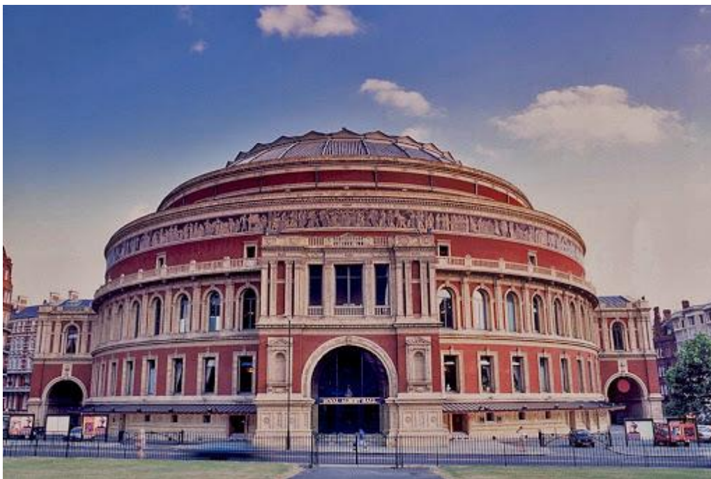
Рис. 2.28 Альберт-холл

увагою Альберт-хол. Альберт-хол – повне найменування Лондонський королівський зал мистецтв і наук імені Альберта (Royal Albert Hall of Arts and Sciences) – концертний зал в Лондоні. Вважається одним з найбільш престижних концертних майданчиків в Великобританії і в усьому світі. Побудований на згадку принца-консорта Альберта при його вдові королеві Вікторії. Щороку в Альберт-холі проходить близько 350 заходів, включаючи концерти класичної музики, постановки опер і балетів, церемонії нагороджень, благодійні концерти, банкети. Щоліта з 1941 р. в Альберт-холі проводиться міжнародний музичний фестиваль Бі-Бі-Сі Промс. У повоєнний час в Альберт-холі не раз виступали популярні рок-групи, такі як, наприклад, The Beatles, Deep Purple, Led Zeppelin і The Who. У 1956 р. Альфред Хічкок зняв в Альберт-холі кульмінаційну сцену гостросюжетної стрічки «Людина, яка занадто багато знала». Також проводяться урочисті заходи за участю студентів Імперського коледжу Лондона. Альберт-хол можна відвідати і в порядку туристичної екскурсії [44].