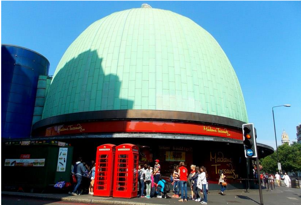
Рис. 2.20. Музей Мадам Тюссо

Музей Лондона (1976 р.) – показує історію Лондона від доісторичних до сучасних часів. Музей розташований на вулиці Лондонська стіна, поруч з Барбікан-центром та є частиною комплексу будівель Барбікан, які були побудовані в 1960–1970-ті роки як інноваційний підхід до редевелопменту пошкодженої бомбардуваннями Другої світової війни частини Лондонського Сіті. Колекція музею створена поєднанням колекцій, які раніше перебували у власності Корпорації Лондонського Сіті в Музеї Гілдхоллу та Лондонського музею, який розміщувався у Кенсінгтонському палаці. Рішення про це об'єднання було прийнято у 1964 році, а дозвіл на об'єднання, «Акт про Музей Лондона» прийнято наступного року [12, с.47].