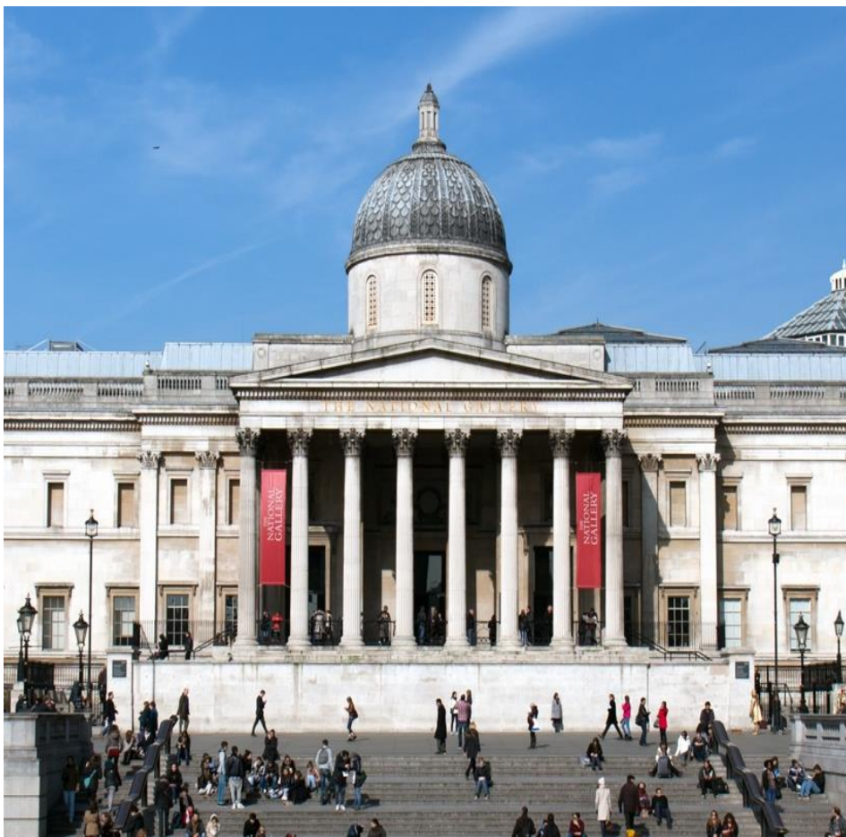
Рис.2.15 Лондонська національна галерея

Дім королівського географічного товариства – англійське наукове товариство, засноване в 1830 р. під назвою Географічне товариство Лондона (Geographical Society of London) для розвитку географічної науки під заступництвом короля Вільгельма IV. Воно поглинуло «Асоціацію з просування відкриття внутрішніх областей Африки» (Association for Promoting the Discovery of the Interior Parts of Africa), також відому як Африканська асоціація (заснована Сером Джозефом Банксом в 1788 р.), Клуб Ролі ( англ. Raleigh Club) і Палестинську асоціацію (Palestine Association). Товариство отримало королівські привілеї від королеви Вікторії в 1859 р. [44].