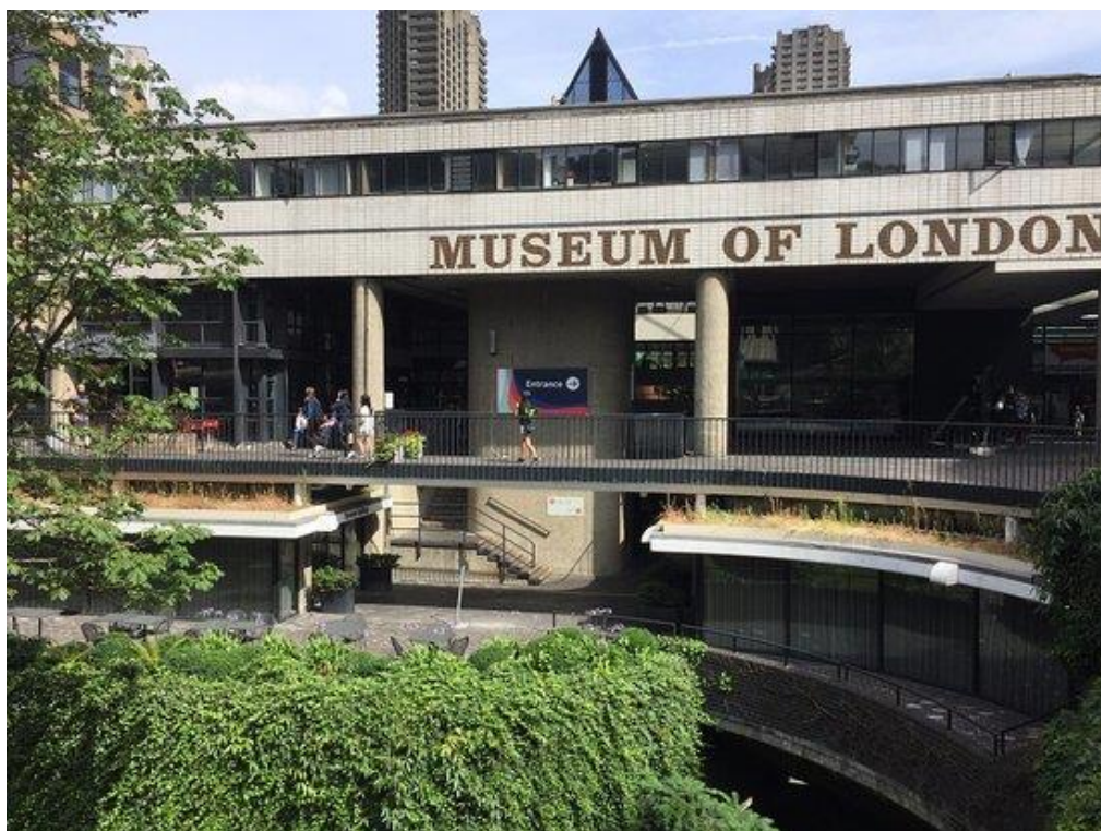
Рис. 2.21. Музей Лондона

Галерея Тейт Модерн (2000 р.) – національна галерея міжнародного модерністського й сучасного мистецтва в центрі Лондона, яка входить до групи галерей Тейт. Тут представлені твори світового сучасного мистецтва із колекції Тейт, створені у XX–на початку XXI століття [97].