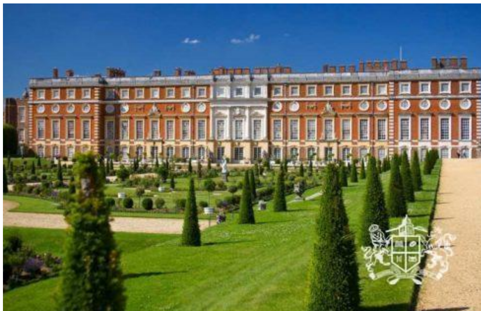
Рис. 2.9 Хемптон

До історико-культурних туристичних ресурсів крім вище перелічених належить і резиденція прем'єр-міністра Великої Британії, якій понад 200 років. Неподалік від Вайтхоллу знаходиться невеликий провулок Даунінг, де в будинку під номером 10 розташована резиденція прем'єр-міністра Великої Британії. На жаль, відвідати цю пам'ятку Лондона не можна, але можна хоча б поглянути здалеку. Цікавий факт: служать спеціальні коти-щуролови. Нині цей почесний пост обіймає кіт Ларрі [44].