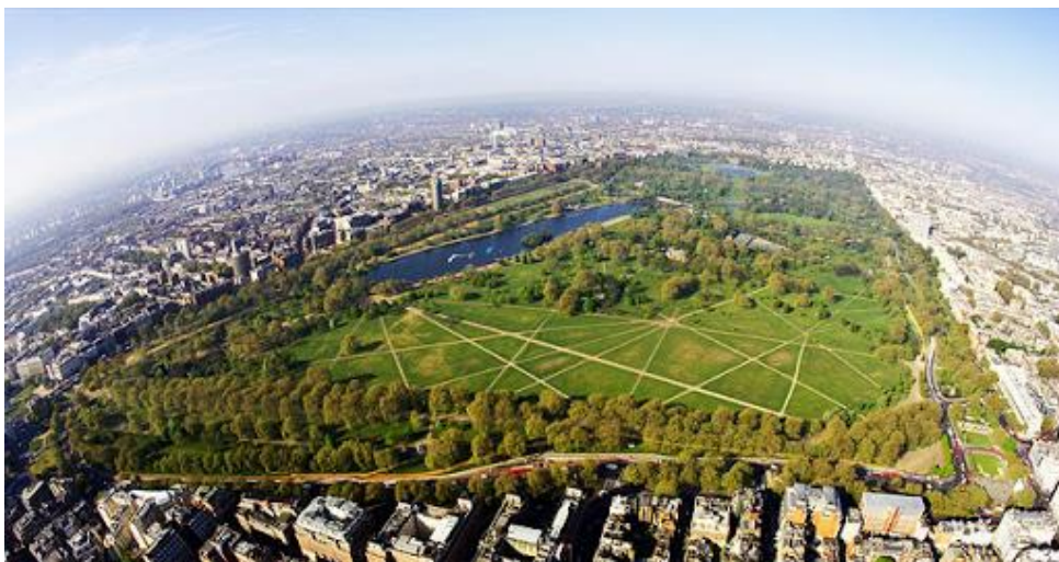
Рис. 2.27. Гайд парк

Гайд-парк — мальовничий королівський парк, який є одним з найбільших зелених зон Центрального Лондона. Парк був заснований в 1536 році для полювання на оленів. Зараз це відмінне місце для прогулянок, пікніків і відпочинку від суєти мегаполісу [97].