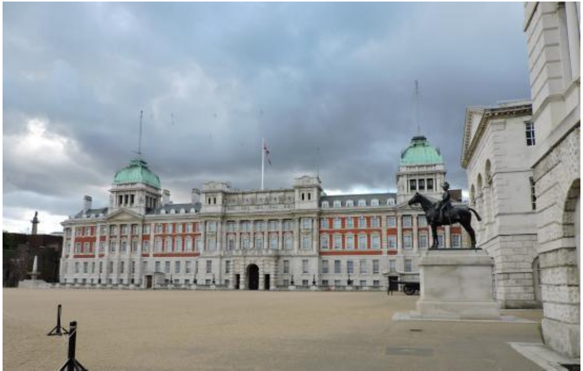
Рис. 2.8. Вайтхолл

Вайтхолл - палац, де зазвичай проходять лондонські паради. Щодня тут можна зустріти кінну гвардію під час зміни варти в Букінгемському палаці. Також у Вайтхоллі знаходиться музей кінної гвардії.