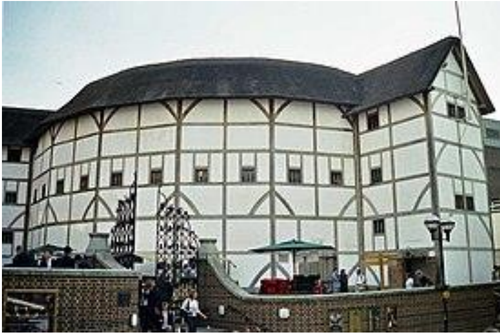
Рис. 2.24. Театр Глобус