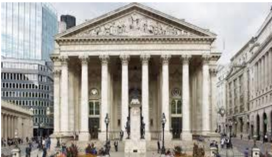
Рис. 2.32. Королівська біржа

Королівська біржа – перша за рахунком товарна біржа в Англії, існувала в Лондонському Сіті з 1565 по 1923 рр. У 1698 р від неї відділилася Лондонська фондова біржа, яка продовжує працювати донині і де відбуваються найважливіші бізнес-події країни, що безперечно привертає увагу туриста.