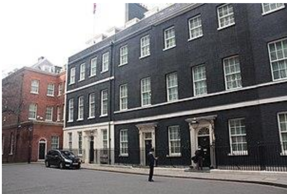
Рис.2.10. Резиденція прем'єр-міністра Великої Британії

До історико-культурних туристичних ресурсів крім вище перелічених належить і резиденція прем'єр-міністра Великої Британії, якій понад 200 років. Неподалік від Вайтхоллу знаходиться невеликий провулок Даунінг, де в будинку під номером 10 розташована резиденція прем'єр-міністра Великої Британії. На жаль, відвідати цю пам'ятку Лондона не можна, але можна хоча б поглянути здалеку. Цікавий факт: служать спеціальні коти-щуролови. Нині цей почесний пост обіймає кіт Ларрі [44].