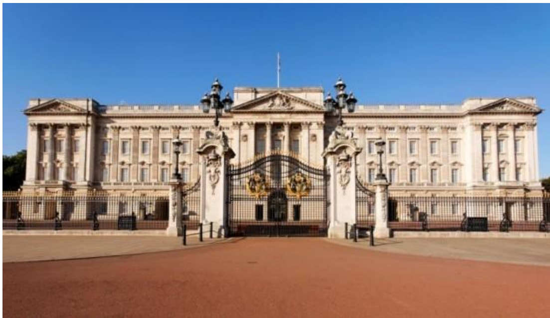
Рис. 2.7. Букінгемський палац

Якщо королева знаходиться в Букінгемському палаці, то на флагштоку піднято Королівський штандарт. Якщо вона перебуває у своїй літній резиденції, то тоді можна придбати квитки на екскурсії по розкішних залах, королівських галереях і стайнях [44].