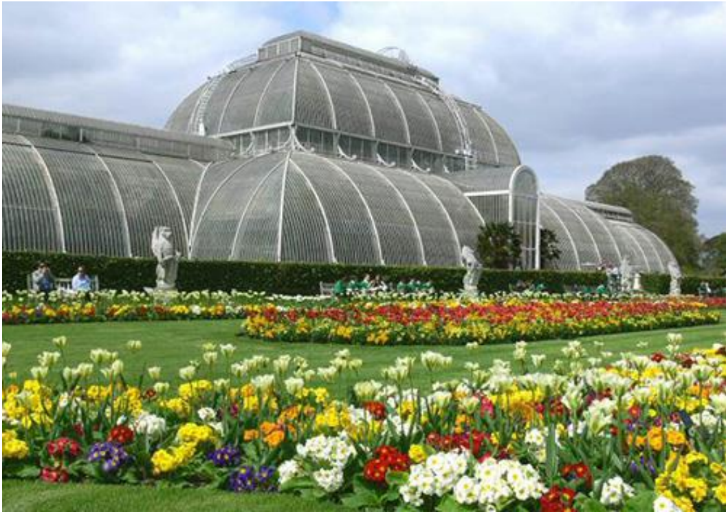
Рис.2.26. Королівські ботанічні сади

Гайд-парк — мальовничий королівський парк, який є одним з найбільших зелених зон Центрального Лондона. Парк був заснований в 1536 році для полювання на оленів. Зараз це відмінне місце для прогулянок, пікніків і відпочинку від суєти мегаполісу [97].