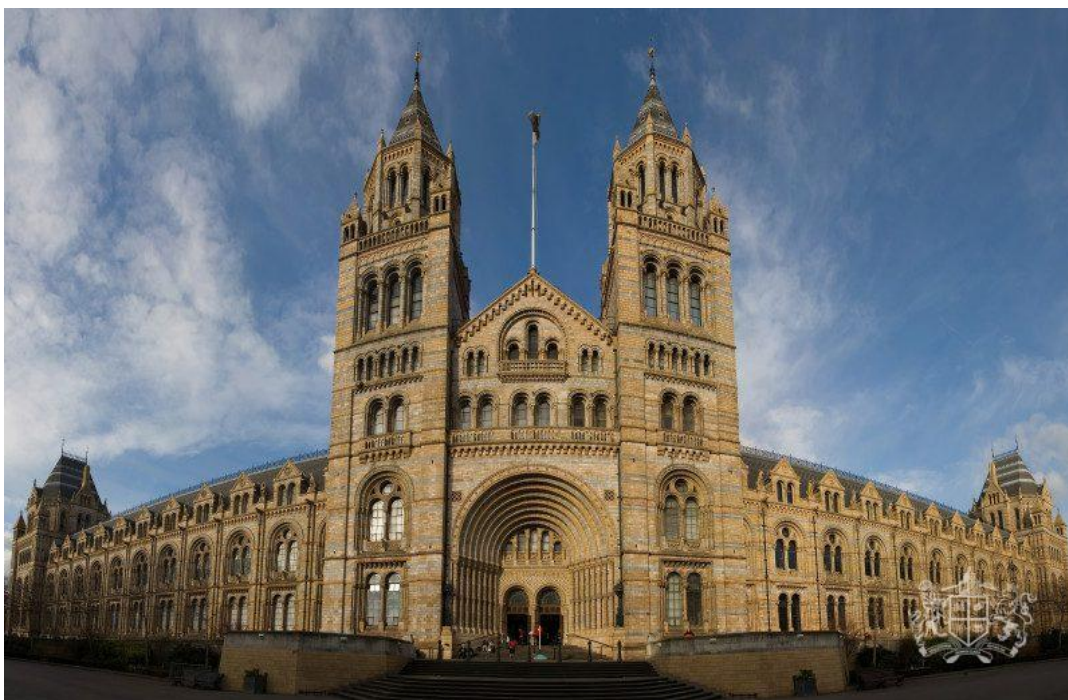
Рис. 2.18. Музей природознавства

Музей природознавства (1881 р.) – четвертий за відвідуваністю у Великій Британії, розташований в одній з найкрасивіших будівель Лондона і представляє сотні інтерактивних анімованих експонатів динозаврів, ссавців, 30-метрову модель блакитного кита, скелет гігантського динозавра диплодока а також цікаву механічну модель тиранозавра. [97].