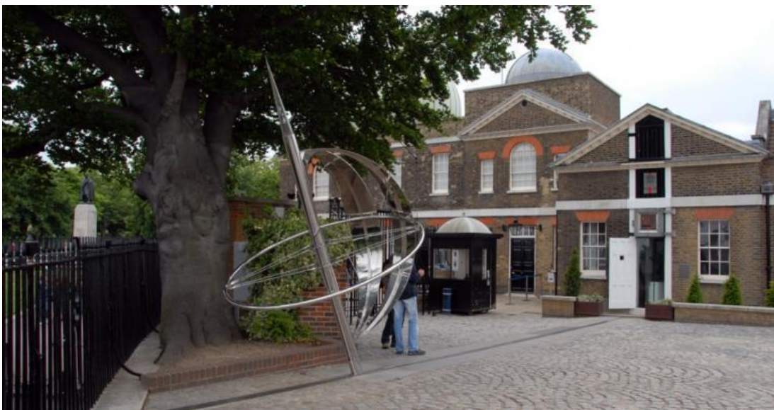
Рис.2.6. Грінвіцька обсерваторія

Грінвіч — центр британської військово-морської потужності, відомий своєю обсерваторією і колекціями національного морського музею що вражають. Саме тут знаходиться нульовий меридіан, Королівська Обсерваторія, парк та музей [44].