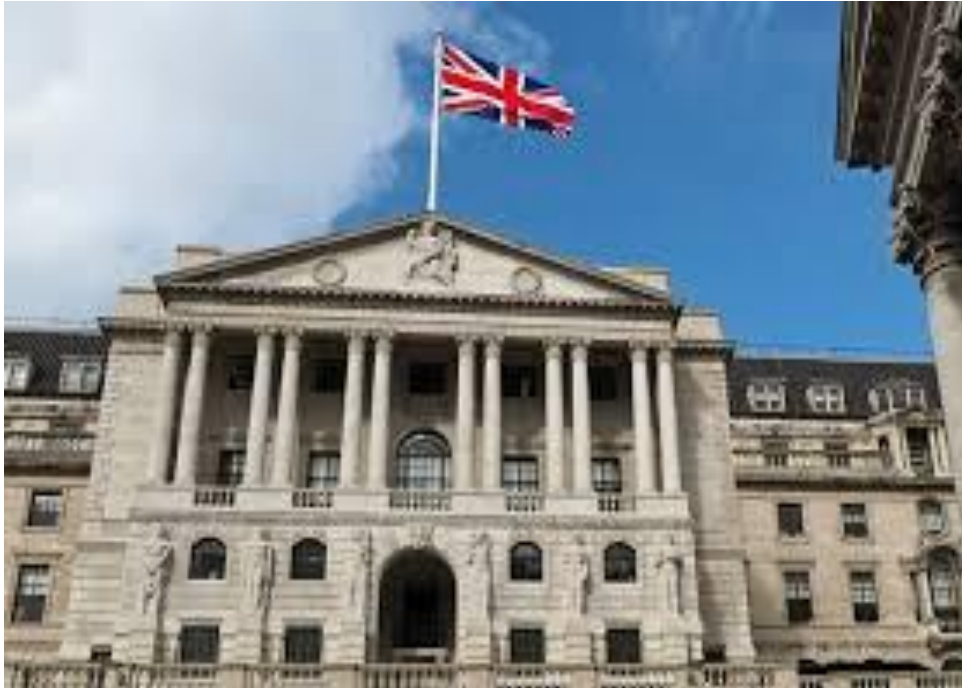
Рис. 2.31. Банк Англії

Британії, які відкриті також для широких громадських кіл, чим привертають увагу туристів [97].