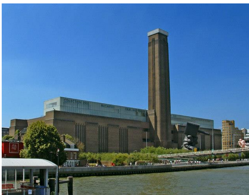
Рис. 2.22. Галерея Тейт Модерн

Галерея Тейт Модерн (2000 р.) – національна галерея міжнародного модерністського й сучасного мистецтва в центрі Лондона, яка входить до групи галерей Тейт. Тут представлені твори світового сучасного мистецтва із колекції Тейт, створені у XX–на початку XXI століття [97].