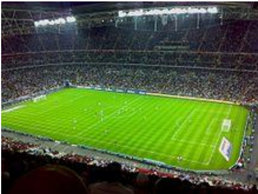
Рис. 2.35. Вемблі

«Вемблі» – найбільший стадіон Великобританії й одна з найбільш культових футбольних арен, яка збирає тисячі туристів на футбольні матчі.