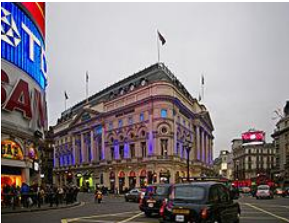
Рис. 2.30. Пікаділі.

презентації інноваційних продуктів, що безумовно приваблює сучасного туриста. Стіни будинків на площі завішені рекламою. У середині (але не в геометричному центрі) площі Пікаділлі знаходиться фонтан і знаменита скульптура Антероса, звана в народі Еросом.