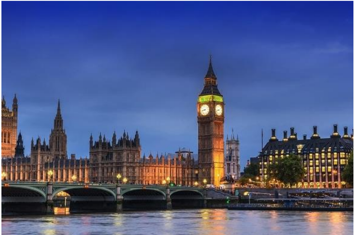
Рис. 2.2. Біг-Бен

Біг-Бен – один з головних символів Лондона, який є часовою вежею Вестмінстерського палацу. Біг-Бен був побудований в 1859 році за проектом Чарльза Баррі. Величезні годинники датуються цим же періодом.