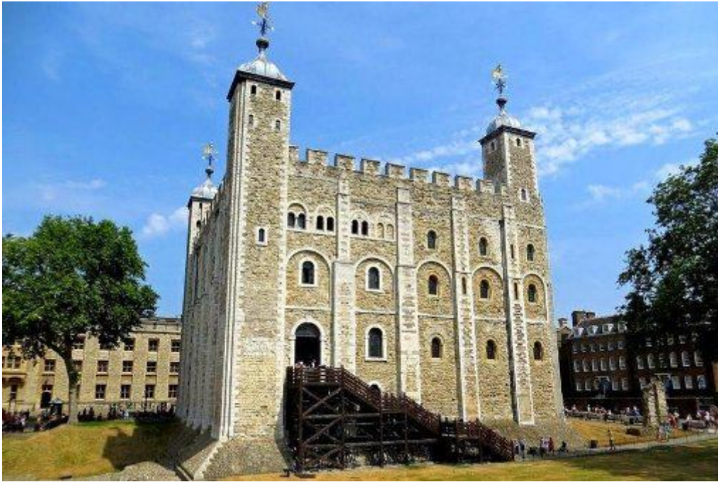
Рис. 2.4. Тауер

Грінвіч — центр британської військово-морської потужності, відомий своєю обсерваторією і колекціями національного морського музею що вражають. Саме тут знаходиться нульовий меридіан, Королівська Обсерваторія, парк та музей [44].