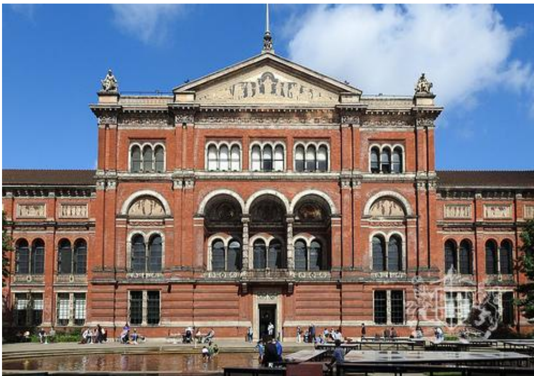
Рис. 2.16. Музей Вікторії та Альберта

неперевершеною за своїми масштабами і різноманітності. За останні роки в «V&A» проведено грандіозні реконструкції галерей середньовічного Ренесансу, Британської галереї і ювелірних виробів[12, с. 78].