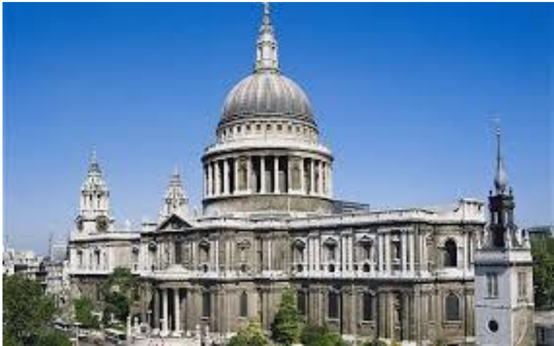
Рис.2.11 Собор Святого Павла

Собор св. Павла — найвідоміша і велика церква Лондона. Цей шедевр бароко датується XVII століттям і є одним з найкрасивіших релігійних споруд у світі. Самою примітною особливістю собору є величезний купол, який вважається шедевром англійської архітектури [61].