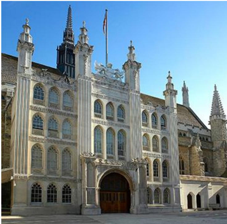
Рис. 2.23. Гілдхолл

Гілдхолл – будівля, яка протягом багатьох років була резиденцією лорд-мера. В даний час в будівлі проводяться різні офіційні заходи, також тут розміщуються художня галерея, бібліотека і музей годинників [44].