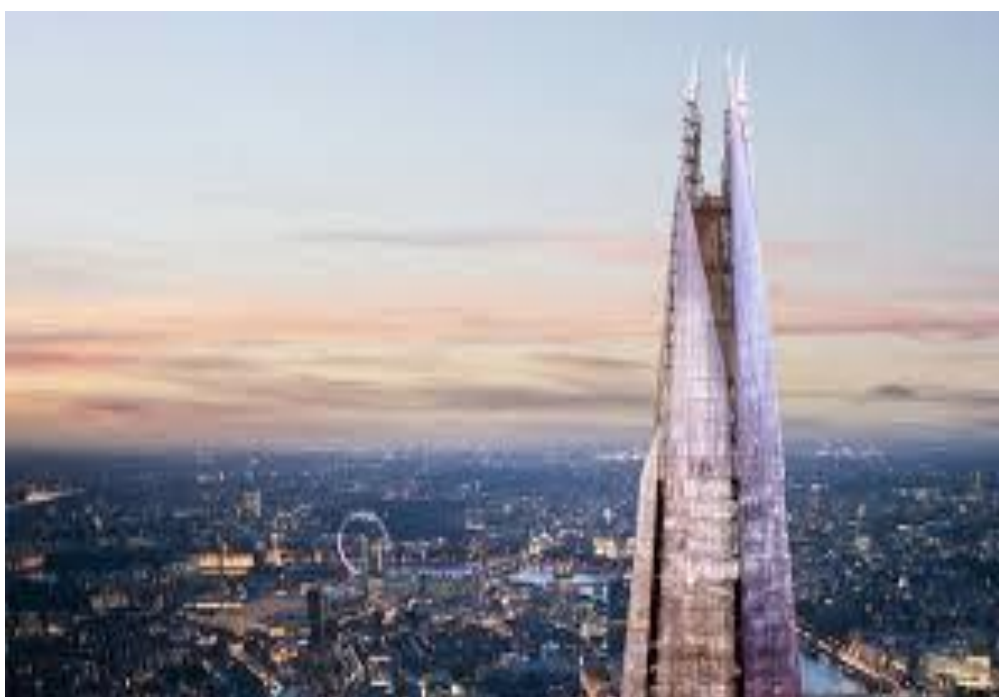
Рис. 2.33. TheShard

Незвичними пам'ятками Лондона які останнім часом користуються великою популярністю у туристів у зв'язку з тим що саме в них організують різноманітні заходи бізнесового та культурного життя є три найвищих хмарочоси в районі Сіті, а саме: HeronTower(230 м) (займає 5 місце в списку найвищих хмарочосів Лондона) OneCanadaSquare(244 м) (займає 3 місце в списку найвищих хмарочосів Лондона) та TheShard/TheShardLondonBridge(310 м) (є найвищим хмарочосом в Лондоні)